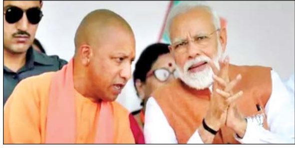
● डबल इंजन सरकार ने यूपी को बनाया देश का ग्रोथ इंजन

जनकल्याण के प्रतीक बने उत्तर प्रदेश में इंफ्रास्ट्रक्चर के जरिए विकास का पहिया दौड़ा तो आस्था के सैलाब ने पर्यटन की नई कहानी लिखी। एक तरफ नोएडा इंटरनेशनल एयरपोर्ट (जेवर), गंगा एक्सप्रेसवे, देश की पहली रैपिड रेल, एम्स, फर्टिलाइजर कारखाना, सेमीकंडक्टर यूनिट, सरयू नहर राष्ट्रीय परियोजना, केन-बेतवा नदी जोड़ी आदि परियोजनाओं के जरिए यूपी ने अलग पहचान बनाई तो दूसरी तरफ 500 वर्ष की बहुप्रतीक्षित आस्था राम मंदिर का