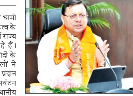
प्राकृतिक सौंदर्य का अनुभव करने पहुंच रहे हैं।

मुख्यमंत्री ने कहा कि उत्तराखंड की पहचान सदैव आध्यात्मिक परंपराओं, प्राचीन मंदिरों और सनातन संस्कृति से जुड़ी रही है। पिछले कुछ वर्षों में इन धार्मिक स्थलों के संरक्षण और सुविधाओं के विस्तार के लिए किए गए प्रयासों ने राज्य को वैश्विक धार्मिक पर्यटन मानचित्र पर और अधिक मजबूत स्थान दिलाया है। आज बड़ी संख्या में श्रद्धालु और पर्यटक यहाँ की आध्यात्मिक अनुभूति और