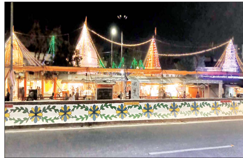
बड़े मंगल पर रंग-बिरंगी रोशनी से सजा हनुमान मंदिर