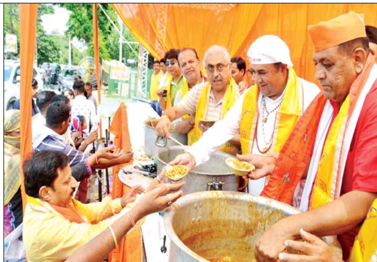
भंडारे में प्रसाद ग्रहण करते भक्तगण