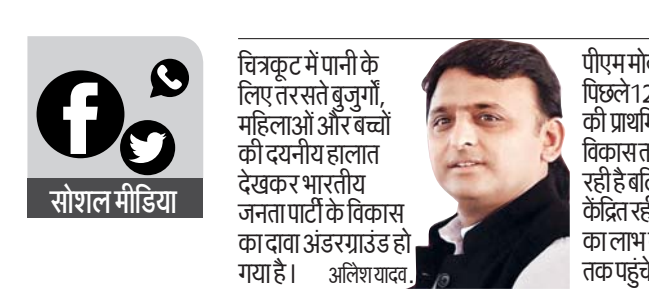
सोशल मीडिया चित्रकूट में पानी के लिए तरसते बुजुर्गों, महिलाओं और बच्चों की दयनीय हालात देखकर भारतीय जनता पार्टी के विकास का दावा अंडरग्राउंड हो गया है। अलिश यादव.