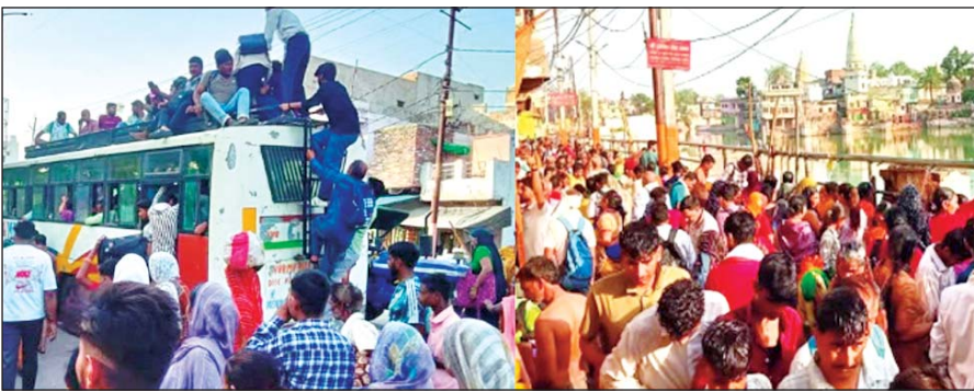
जिला संवाददाता (vol)

पशासन की व्यवस्थाएं साबित हुईं बौनी, बसों की छतों पर सफर करने को मजबूर परिक्रमार्थी, जाम और गंदगी से हाल बेहाल