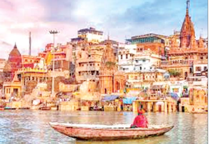
आम जनता को कोई असुविधा न हो। उन्होंने बताया कि योजना के तहत आगामी दिनों में शहर के भीतर मांस की दुकानों को रामनगर, शुजाबाद, गणेशपुर, अवलेशपुर और शिवपुर क्षेत्रों में