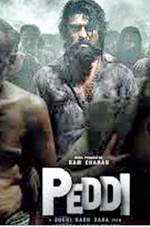
फिल्म 'पेद्दी' के प्रमोशन के लिए सितारों का जमावड़ा