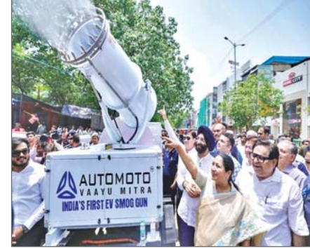
एजेंसी नयी दिल्ली। दिल्ली की मुख्यमंत्री रेखा गुप्ता ने हाल ही में सरकार की इनोवेशन चैलेंज योजना के तहत शहर के कुछ

हिस्सों में वायु प्रदूषण कम करने के उद्देश्य से एलायंस एयर उपकरणों का शनिवार को निरीक्षण किया। गुप्ता ने पर्यावरण मंत्री मनीष जयराज सिंघा के साथ कीर्ति नगर औद्योगिक क्षेत्र के पास एलायंस एयर पोल-माउटेड डस्ट कलेक्टर और कीर्ति नगर फायर स्टेशन पर स्थापित सेंट्रल वर्ज एयर प्युरीफायर का निरीक्षण किया। पिछले साल अक्टूबर में सिंघा ने प्रदूषण कम करने के लिए इस पहल को शुरू आत की थी, जिसमें व्यक्तिगत, स्टार्टअप और शोध संस्थानों को पीएम2.5 और पीएम10 जैसे कणों के उत्सर्जन को कम करने के लिए विचार प्रस्तुत करने के लिए आमंत्रित किया गया था। निरीक्षण के दौरान सिंघा ने बताया कि उपकरण में लगातार धूल जमा होती रहती है और लगभग 15-20 दिन बाद जब यूनिट भर जाती है तो बैकएंड तकनीक अधिकारियों को सूचित कर देती है। उन्होंने कहा, यह उपकरण 400 वर्ग मीटर के दायरे से धूल एकत्र कर सकता है।