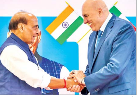
27 का अनावरण किया। सिंह ने सोशल मीडिया पर कहा, हमने पश्चिम एशिया की मौजूदा स्थिति सहित क्षेत्रीय और वैश्विक मुद्दों की एक विस्तृत श्रृंखला पर चर्चा की। उन्होंने कहा, हमने आत्मनिर्भर भारत कार्यक्रम और इटली की रक्षा सहयोग पहल के तहत पारस्परिक रूप से लाभकारी रक्षा औद्योगिक सहयोग को और प्रगाढ़ करने के तरीकों ...शेष पृष्ठ 10 पर

एजेंसी नयी दिल्ली। भारत और इटली ने बृहस्पतिवार को सैन्य साजोसामान के सह-उत्पादन के लिए एक रक्षा औद्योगिक ढांचा विकसित करने का संकल्प लिया। यह कदम ऐसे समय में उठाया गया है, जब दोनों देश पश्चिम एशिया संकट सहित एक उभरते सुरक्षा परिदृश्य का सामना कर रहे हैं।