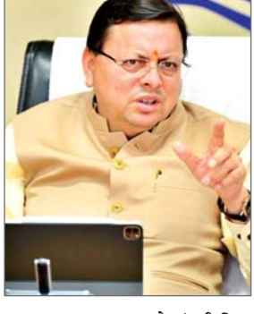
गढ़वाल आवुक्त स्तर से मंजूरी मिल सकेगी, जिससे विकास कार्यों में तेजी आएगी। परिवहन क्षेत्र में महत्वपूर्ण कदम उठाते हुए सरकार ने उत्तराखंड मोटर वाहन (संशोधन) नियमावली 2026 को हरी झंडी दी है। इसके तहत प्रवर्तन चालकों के लिए पुलिस

प्रमुख संवाददाता देहरादून। मुख्यमंत्री पुष्कर सिंह धामी की अध्यक्षता में हुई उत्तराखंड मंत्रिमंडल बैठक में विकास और प्रशासनिक सुधार से जुड़े 18 अहम प्रस्तावों को स्वीकृति दी गई। इन फैसलों का प्रभाव आगामी कुंभ 2027 की व्यवस्थाओं के साथ-साथ परिवहन, शिक्षा, उद्योग, वन, राजस्व और रोजगार जैसे विभिन्न क्षेत्रों पर पड़ेगा। बैठक के निर्णयों की जानकारी देते हुए मुख्यमंत्री के सचिव शैलेश बगौली ने बताया कि कुंभ 2027 की तैयारियों को तेज और सुव्यवस्थित बनाने के लिए स्वीकृति प्रक्रिया को सरल किया गया है। अब 1 करोड़ रुपये तक के कार्यों को मेलाधिकारी और 5 करोड़ रुपये तक की परियोजनाओं को