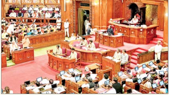
सदन की कार्यवाही शुरू होने से पहले सपा सदस्य अपनी-अपनी सीट पर हाथों में तख्तियां लेकर नारेबाजी करने लगे। सपा ...शेष पृष्ठ 10 पर

विशेष संवाददाता लखनऊ। उत्तर प्रदेश विधानमंडल के एक दिवसीय विशेष सत्र से पहले बृहस्पतिवार को सत्ता पक्ष और विपक्ष के बीच महिला आरक्षण के मुद्दे पर टकराव देखने को मिला। समाजवादी पार्टी (सपा) के सदस्यों ने विधान भवन परिसर से लेकर सड़कों व सड़न तक सरकार के खिलाफ जोरदार प्रदर्शन किया, वहीं सत्तारूढ़ भारतीय जनता पार्टी (भाजपा) के विधायकों, विशेषकर महिला सदस्यों ने विपक्ष के खिलाफ जवाबी प्रदर्शन किया।