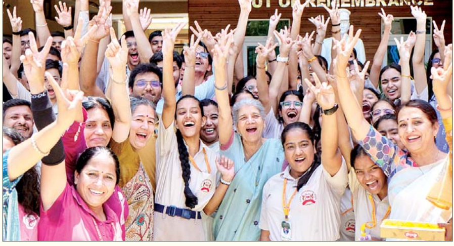
आईसीएसई परीक्षा में 2,56,590 परीक्षार्थी उत्तीर्ण जबकि 2,131 अनुत्तीर्ण हुए। आईएससी परीक्षा में कुल 1,02,414 उत्तीर्ण जबकि 902 अनुत्तीर्ण हुए। श्रेणीवार आंकड़ों के अनुसार आईसीएसई में सामान्य श्रेणी के छात्रों का उत्तीर्ण प्रतिशत 99.26 प्रतिशत रहा। अन्य पिछड़ा वर्ग में 99.24 प्रतिशत, अनुसूचित जनजाति में 98.07 प्रतिशत और अनुसूचित जाति में 98.76 प्रतिशत छात्र उत्तीर्ण हुए। आईएससी में, सामान्य श्रेणी के 99.17 प्रतिशत, अन्य पिछड़ा वर्ग में 99.12 प्रतिशत, अनुसूचित जाति में 98.77 प्रतिशत और अनुसूचित जनजाति में 98.84 प्रतिशत छात्र उत्तीर्ण हुए। आईसीएसई में 67 विषयों में जबकि आईएससी में 45 विषयों में परीक्षाएं आयोजित की गई थीं। परीक्षा परिणाम सीआईएससीई की आधिकारिक वेबसाइट पर उपलब्ध हैं। परीक्षा परिणाम पर छात्रों और उनके अभिभावकों ने बहुत खुशी जताते हुए कहा कि यह उनकी मेहनत का फल है।

एजेंसी नयी दिल्ली। भारतीय स्कूल प्रमाण पत्र परीक्षा परिषद (सीआईएससीई) ने बृहस्पतिवार को 2026 के लिए 10वीं और 12वीं कक्षा के परिणाम घोषित किए, जिनके अनुसार 10वीं कक्षा में 99.18 प्रतिशत जबकि 12वीं में 99.13 प्रतिशत परीक्षार्थी उत्तीर्ण हुए। कुल 2,58,721 परीक्षार्थियों ने 10वीं (आईसीएसई) जबकि 1,03,316 परीक्षार्थियों ने 12वीं (आईएससी) की परीक्षा दी थी। छात्रों दोनो परीक्षाओं में छात्रों से आगे रहीं। आईसीएसई में, 99.46 प्रतिशत छात्रों जबकि 98.93 प्रतिशत छात्र उत्तीर्ण हुए। आईएससी में, 99.48 प्रतिशत छात्रों जबकि 98.81 प्रतिशत छात्र उत्तीर्ण हुए।