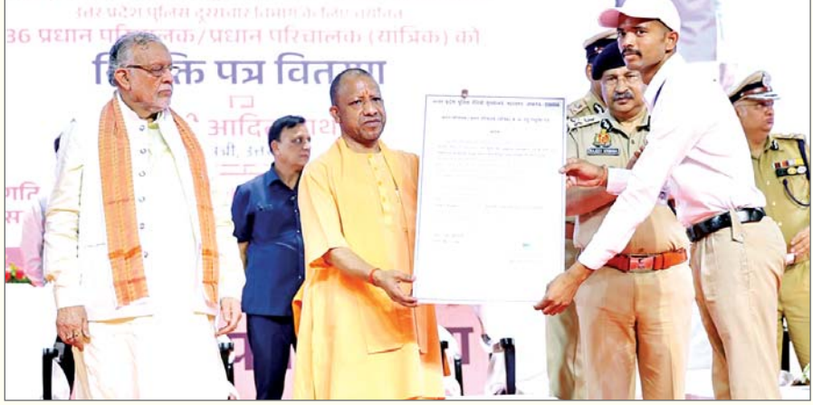
दूरसंचार विभाग में चयनित 936 प्रधान परिचालक/प्रधान परिचालक (यांत्रिक) को इंद्रा गांधी प्रतिष्ठान में नियुक्ति पत्र वितरित किए। कार्यक्रम में पुलिस दूरसंचार विभाग पर आधारित लघु फिल्म भी दिखाई गई।

लखनऊ। मुख्यमंत्री योगी आदित्यनाथ ने मंगलवार को युवाओं को बड़ी खुशखबरी दी। उन्होंने युवाओं का हासला बढ़ाते हुए कहा कि योग्य, क्षमतावान, स्वतः स्फूर्त भाव के साथ नौजवान यूपी पुलिस बल का हिस्सा बनना चाहता है और इसके लिए भर्ती व प्रोन्नति बोर्ड युवाओं को अच्छा अवसर उपलब्ध कराएगा। उप पुलिस भर्ती व प्रोन्नति बोर्ड इस वर्ष लगभग एक लाख नई भर्ती करने का उपाय है। पिछले तीन दिन में यूपी होमगार्ड में भी 41 हजार भर्ती के लिए परीक्षा हुई। सिविल पुलिस, एसआई, होमगार्ड आदि की भर्ती प्रक्रिया तेजी से बढ़ी है। मुख्यमंत्री ने उत्तर प्रदेश पुलिस विशेष संवाददाता