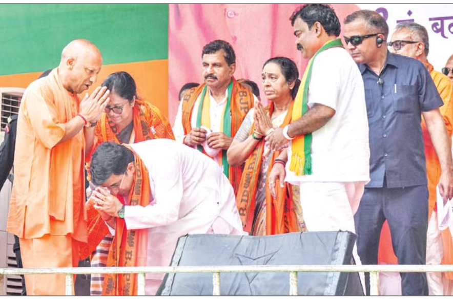
और कठमुल्लापन को बढ़ावा देने वालों को हर हाल में रोकना है। उन्होंने मतदाताओं से अपील की कि लोकतंत्र ने आपको जो ताकत दी है, अपने वोट के जरिए उसका सही इस्तेमाल कीजिए। बंगाल अब बदलाव के मुहाने पर खड़ा है। उत्तर प्रदेश की तरह डबल इंजन सरकार बनने पर बंगाल में भी विकास, सुरक्षा और सांस्कृतिक पुनर्जागरण का नया दौर शुरू होगा। सीएम योगी ने कहा कि ममता दीदी कहती है

कोलकाता/नदिया/हावड़ा। मुख्यमंत्री योगी आदित्यनाथ ने ममता बनर्जी को ललकारते हुए कहा कि पश्चिम बंगाल में 4 मई को भगवा लहराएगा। इसके बाद तृणमूल कांग्रेस (टीएमसी) के गुंडों की उल्टी गिनती शुरू होगी। उन्होंने इशारों में ममता व अभिषेक बनर्जी पर प्रहार करते हुए कहा कि बुआ-भतीजा बंगाल का अस्तित्व मिटाना चाहते हैं। कोलकाता का मेयर कहता है कि यहां ऊर्दू चलेगी। कोई माई का लाल बंगाली अस्मिता से खिलवाड़ नहीं कर सकता। टीएमसी के लोग जान लें कि बंगाल की पहचान काबा से नहीं, मां कालीबाड़ी से है। सीएम योगी बुधवार को पश्चिम बंगाल के जोरसांको, चकदहा व उदयनारायणपुर विधानसभा क्षेत्रों में जनसभाओं को संबोधित कर रहे थे। बंगाल में उनका जादू लगातार सिर चढ़कर बोल रहा है। टीएमसी के गुंडों की अराजकता व धमकी के बावजूद हजारों की भीड़ चिलचिलाती धूप में सिर पर पगछा और छता लिए सीएम योगी को देखने-सुनने के लिए उमड़ पड़ी। जनसभाओं में आए अधिसंख्य लोग हाथ में पोस्टर लिए हुए थे, जिन पर लिखा था- योगी जी बुलडोजर लाओ, हम तुम्हारे साथ हैं।