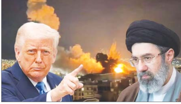
और विशेष अमेरिकी दूत स्टीव वित्कॉफ तथा जेरेड कुशनर मंगलवार को इस्लामाबाद जाने वाले थे, लेकिन व्हाइट हाउस ने कहा कि प्रतिनिधिमंडल की पाकिस्तान यात्रा आज (मंगलवार को) नहीं होगी। ट्रंप ने मंगलवार को एक बयान में कहा इस तथ्य के आधार पर कि ईरान की सरकार गंभीर रूप से आंतरिक मतभेदों से जुड़ रही है और पाकिस्तान के फौलड मार्शल आसिम मुनीर तथा प्रधानमंत्री शहबाज शरीफ के अनुरोध पर हमसे कहा गया है कि हम ईरान पर अपने हमले को तब तक रोकें, जब तक उसके नेता और प्रतिनिधि समेकित प्रस्ताव तैयार नहीं कर लेते। हालांकि, ट्रंप ने स्पष्ट कर दिया है कि अमेरिका ईरान पर अपने हमले को तब तक ही रोकेंगे, जब तक

वाशिंगटन/इस्लामाबाद। अमेरिका के राष्ट्रपति डोनाल्ड ट्रंप ने मध्यस्थ देश पाकिस्तान के अनुरोध पर ईरान के साथ युद्धविराम को अनिश्चितकाल के लिए बढ़ा दिया है। ट्रंप ने कहा कि यह कदम तेहरान के आंतरिक मतभेदों से जुड़ रहे नेतृत्व को सात सप्ताह से जारी युद्ध को समाप्त करने के लिए एक प्रस्ताव तैयार करने का समय देने के उद्देश्य से उठाया गया है। नाटकीय रूप से यह घोषणा तब की गई, जब आठ अप्रैल को घोषित दो सप्ताह का युद्धविराम कुछ ही घंटों में समाप्त होने वाला था। इसके साथ ही उत्तराष्ट्रपति जेडी वेंस के नेतृत्व वाले अमेरिकी प्रतिनिधिमंडल की इस्लामाबाद यात्रा भी टल गई, जहां ईरानी प्रतिनिधियों के साथ शांति वार्ता प्रस्तावित थी। वेंस