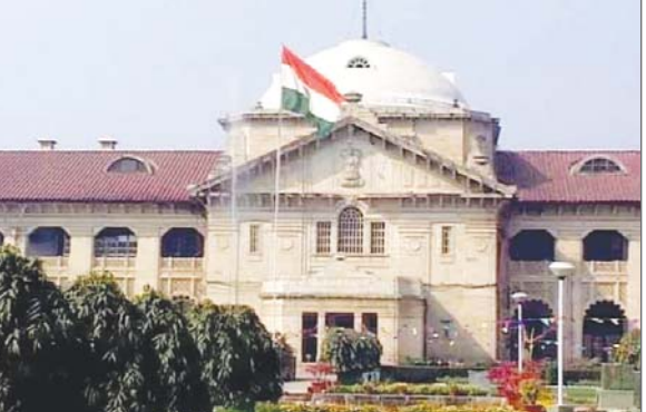
किया। कोर्ट के सामने लंबे समय से सुनवाची चल रही है और बुधवार को विभिन्न याचिका पक्षों के अधिवक्ताओं की ओर से बहस पूरी कर ली गयी। वहीं, जब कोर्ट ने राज्य सरकार के आवास एवं शहरी विकास विभाग, जिलाधिकारी अयोध्या और आवास एवं विकास परिषद के अधिवक्ताओं से बहस करने को कहा तो उनकी ओर से पेश हो रहे ...शेष पृष्ठ 10 पर

लखनऊ इलाहाबाद हाईकोर्ट लखनऊ बेंच ने अयोध्या में उत्तर प्रदेश आवास एवं विकास परिषद की विभिन्न योजनाओं के लिए की जा रही भूमि अधिग्रहण की कार्यवाही पर बुधवार को अंतरिम रोक लगा दी है। कोर्ट ने कहा कि जिन योजनाओं के लिए भूमि अधिग्रहण करने के चुनौती दी गयी है उन सभी में राज्य सरकार सहित सभी पक्षकार मौके पर यथास्थिति बनाए रखेंगे। कोर्ट ने मामले की अमली सुनवाची गुरुवार केानियत किया है। यह आदेश जस्टिस राजन राय एवं जस्टिस मंजीव शुक्ला की पीठ ने बुधवार को ग्याहर याचिकाओं पर एक साथ सुनवाई के दौरान पारित