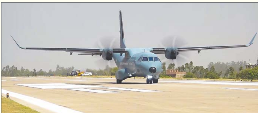
लिए एक्सप्रेस-वे के पास एक हवाई यातायात नियंत्रण प्रणाली भी स्थापित की गई है। स्थानीय प्रशासन ने इससे पहले हवाई पट्टी के आसपास सुरक्षा व्यवस्था बढ़ा दी थी और निवासियों से इससे सुरक्षित दूरी बनाए रखने और अफवाहों पर ध्यान देने से बचने की अपील की थी। इस अभ्यास से क्षेत्र में उत्साह भी पैदा हुआ है क्योंकि लोगों को लड़ाकू विमानों को करीब से देखने का मौका मिल रहा है। अधिकारियों ने कहा कि एहतियात के तौर पर

सुल्तानपुर (उप्र)। वायुसेना का लड़ाकू विमानों का दो दिवसीय अभ्यास बुधवार को सुल्तानपुर जिले में पूर्वांचल एक्सप्रेस-वे पर एक आपातकालीन हवाई पट्टी पर शुरू हुआ, जिसके मद्देनजर अधिकारियों ने सुरक्षा के कड़े इंतजाम करने के साथ ही यातायात प्रतिबंध लगाए हैं। अधिकारियों के अनुसार, यह अभ्यास अरवल-किरी करतब हवाई पट्टी पर किया जा रहा है, जहां आपात स्थिति के दौरान एक्सप्रेस-वे का उपयोग वैकल्पिक रनवे के रूप में करने की तैयारी के तहत लड़ाकू विमान टच-एंड-गो ऑपरेशन संचालित कर रहे हैं। उन्होंने कहा कि अभ्यास के दौरान विमानों की आवाजाही के प्रबंधन के