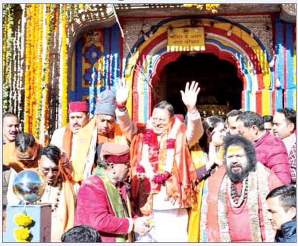
कि चारधाम यात्रा भारत की सनातन चेतना का भव्य पर्व है और हिमालय में स्थित वे धाम हमारी आस्था के अमर