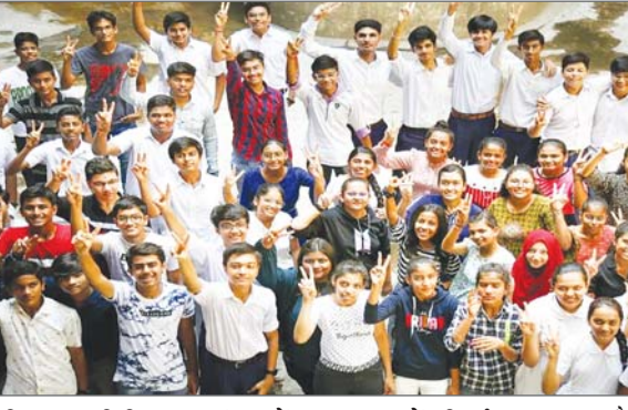
प्रशिक्षण, डिजिटल संसाधनों, छात्रवृत्ति और प्रतियोगी परीक्षाओं के लिए मार्गदर्शन जैसे क्षेत्रों में हुए ठोस सुधारों ने शिक्षा व्यवस्था को जमीनी स्तर से बदल दिया है। वर्ष 2017 से 2026 के बीच उत्तर प्रदेश की शिक्षा व्यवस्था में परिवर्तन एक सतत और योजनाबद्ध प्रक्रिया के रूप में उभरकर सामने आया है। 2017 में अनुशासन और पारदर्शिता को केंद्र में रखकर सुधारों की नींव रखी गई, जिसे 2018 में इंफ्रास्ट्रक्चर ...शेष पृष्ठ 10 पर

लखनऊ। उत्तर प्रदेश अब केवल जनसंख्या का सबसे बड़ा राज्य नहीं, बल्कि शिक्षा और प्रतियोगी परीक्षाओं में देश का उभरता हुआ टैलेंट पावरहाउस बन चुका है। स्कूलों की मजबूत होती बुनियाद से लेकर यूपीएससी, एनईईटी और जेईई जैसी राष्ट्रीय परीक्षाओं में लगातार बढ़ती सफलता यह दर्शा रही है कि प्रदेश में शिक्षा अब पढ़ाई के साथ-साथ प्रशिक्षण और प्रतियोगिता केंद्रित मॉडल में बदल चुकी है। वर्ष 2017 के बाद योगी सरकार के संरचनात्मक सुधारों, डिजिटल हस्तक्षेप और अवसरों के विस्तार ने इस परिवर्तन को गति दी है। स्कूलों के आधारभूत ढांचे, शिक्षक