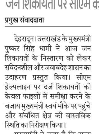
देहरादून। उत्तराखंड के मुख्यमंत्री पुष्कर सिंह धामी ने आज जन शिकायतों के निस्तारण को लेकर संवेदनशील और जवाबदेह शासन का उदाहरण प्रस्तुत किया। सीएम हेल्पलाइन पर दर्ज शिकायतों की केवल फाइलों में समीक्षा करने के बजाय मुख्यमंत्री स्वयं मौके पर पहुंचे और संबंधित क्षेत्र की वास्तविक स्थिति का निरीक्षण किया। मुख्यमंत्री ने कहा है कि राज्य सरकार का उद्देश्य केवल योजनाएं घोषित करना नहीं, बल्कि उनका लाभ समाज के अंतिम व्यक्ति तक प्रभावी रूप से पहुंचाना है। उन्होंने कहा कि जनता की समस्याओं का समयबद्ध, पारदर्शी और गुणवत्तापूर्ण समाधान

हर जरूरतमंद तक पहुंचे सरकारी योजनाओं का लाभ जन शिकायतों पर सीएम का सख्त रुख, मौके पर पहुंचकर जानी जमीनी हकीकत