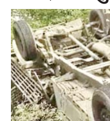
सिद्धार्थनगर - 17 अप्रैल शुक्रवार को रोशनल हाईवे पर गौहनिया चौराहे के पास मुर्गियों से लदी एक पिकअप अनियंत्रित होकर पलट गई। इस दुर्घटना में सैकड़ों मुर्गियों की मौत हो गई। जबकि चालक और दो खलासियों को मामूली

चोटें आईं। मामला चिल्लिया थाना क्षेत्र का है। जानकारों के अनुसार, पिकअप वाहन तुलसीपुर से मुर्गियों का भार लेकर नौगढ़ की ओर जा रहा था। शुक्रवार सुबह लगभग 10 बजे गौहनिया चौराहे के पास पहुंचते ही चालक का वाहन पर से नियंत्रण हट गया और पिकअप मुड़क किनारे पलट गई। बताया जा रहा है कि वाहन में लगभग 18 से 20 क्विंटल सड़क लदी थीं, जो उसकी क्षमता से अधिक थीं। हादसे के बाद घटनास्थल पर अफरा-तफरी मच गई और स्थानीय लोगों की भीड़ जमा हो गई। सूचना मिलने पर जेसीबी मशीन बुलाई गई, जिसकी मदद से पलटे हुए वाहन को सीधा कर सड़क किनारे हटाया गया। इससे यातायात सुचारु हो सका। जीवित बची मुर्गियों को दूसरे पिकअप वाहन में लोड कर आगे भेजा गया। प्रारंभिक जांच में दुर्घटना की मुख्य वजह ओवरलोडिंग मानी जा रही है। पिकअप में उसकी पार्सिंग क्षमता से अधिक मुर्गियां लादी गई थीं, जिसके कारण वाहन असंतुलित हो गया और चालक नियंत्रण खो बैठा। इससे भारी आर्थिक नुकसान होने की आशंका है।