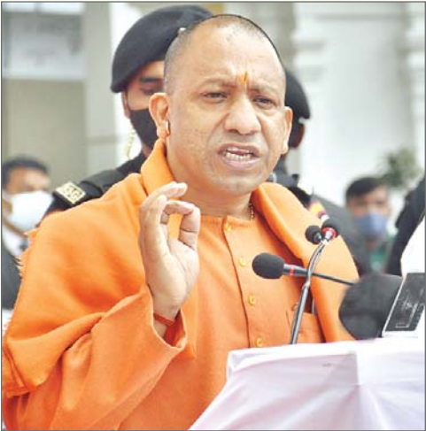
जहां जीवन-यापन की लागत अपेक्षाकृत अधिक है। यहां अकुशल श्रमिकों के लिए 13,690 रुपये, अर्द्धकुशल के लिए 15,059 रुपये और कुशल श्रमिकों के लिए 16,868 ... शेष पृष्ठ 10 पर

लखनऊ। नोएडा और ग्रेटर नोएडा में हालिया घटनाक्रम के बाद उत्तर प्रदेश की योगी आदित्यनाथ सरकार ने बड़ा हस्तक्षेप करते हुए न्यूनतम मजदूरी दरों में संशोधन का निर्णय लिया। सरकार के निर्णय पर प्रदेश की राज्यपाल ने भी अपनी मुहर लगाते हुए नोटिफिकेशन जारी कर दिया है, जिसके बाद सरकार की ओर से निर्धारित नई न्यूनतम मजदूरी दरें कानूनी रूप से प्रभावी हो गई हैं। अब यह पूरे प्रदेश में बाध्यकारी रूप से लागू होंगी।