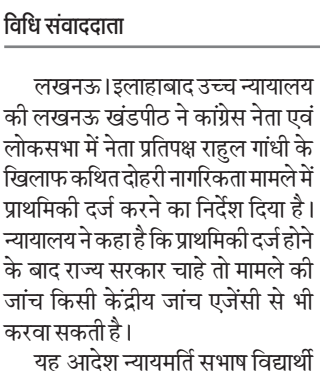
लखनऊ। इलाहाबाद उच्च न्यायालय की लखनऊ खंडपीठ ने कांग्रेस नेता एवं लोकसभा में नेता प्रतिपक्ष राहुल गांधी के खिलाफ कथित दोहरी नागरिकता मामले में प्राथमिकी दर्ज करने का निर्देश दिया है। न्यायालय ने कहा है कि प्राथमिकी दर्ज होने के बाद राज्य सरकार चाहे तो मामले की जांच किसी केंद्रीय जांच एजेंसी से भी करा जा सकती है।

राहुल गांधी पर प्राथमिकी दर्ज करने का आदेश दोहरी नागरिकता का मामला, इलाहाबाद हाईकोर्ट का ऑर्डर