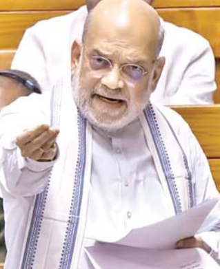
रिजिजू ने कहा कि संविधान संशोधन विधेयक के पारित नहीं होने के बाद, अब इससे संबंधित दोनों विधेयकों परिसीमन विधेयक, 2026 और संघ राज्य विधि (संशोधन) विधेयक, 2026 को आगे नहीं बढ़ा जा सके। उन्होंने कहा महिलाओं को अधिकार और सम्मान देने वाले विधेयक का

नयी दिल्ली। केंद्रीय गृह मंत्री अमित शाह ने शुक्रवार को कांग्रेस समेत अन्य विपक्षी दलों पर महिला आरक्षण का विरोध करने का आरोप लगाते हुए लोकसभा में कहा कि देश की महिलाएं देख रही हैं कि उनके रस्ते का रोड़ा कौन है और विपक्ष के नेताओं को चुनाव में महिलाओं के आक्रोश का सामना करना पड़ेगा। शाह ने महिला आरक्षण अधिनियम से संबंधित संविधान (131वां) संशोधन विधेयक 2026, परिसीमन विधेयक, 2026 और