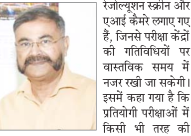
गडबड़ी, अनियमितता या अनुचित साधनों के इस्तेमाल से जुड़े मामलों में कड़ी कार्रवाई सुनिश्चित की जाएगी। बयान में अभ्यर्थियों...शेष पृष्ठ 10 पर

स्थापित किया गया है, जहां से सभी परीक्षा केंद्रों की सघन निगरानी की जाएगी। बयान के मुताबिक, नियंत्रण कक्ष में दो दर्जन से अधिक हाई-रेजोल्यूशन स्क्रीन और एआई कैमरे लगाए गए हैं, जिनसे परीक्षा केंद्रों की गतिविधियों पर वास्तविक समय में नजर रखी जा सकेगी। इसमें कहा गया है कि प्रतियोगी परीक्षाओं में किसी भी तरह की गड़बड़ी, अनियमितता या अनुचित साधनों के इस्तेमाल से जुड़े मामलों में कड़ी कार्रवाई सुनिश्चित की जाएगी। बयान में अभ्यर्थियों...शेष पृष्ठ 10 पर