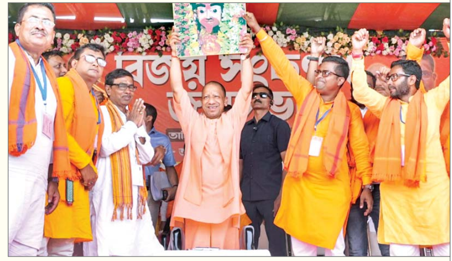
गया है। उन्होंने कहा तुणमूल कांग्रेस राजधानी से अपराध की राजधानी में बंगाल को भारत की सांस्कृतिक बदल दिया है। भाजपा की सरकार बनने पर बंगाल को फिर से देश की सांस्कृतिक...शेष पृष्ठ 10 पर

रामपुरहाट/बाराबनी (पश्चिम बंगाल)। मुख्यमंत्री योगी आदित्यनाथ ने बृहस्पतिवार को सत्तारूढ़ तुणमूल कांग्रेस पर तीखा हमला करते हुए आरोप लगाया कि पिछले 15 वर्षों में भ्रष्टाचार, जबरन वसूली और माफिया राज ने पश्चिम बंगाल को पहचान के संकट में धकेल दिया है। योगी ने बीरभूम के रामपुरहाट और बोलपुर तथा पश्चिम बर्धवान के बाराबनी में भारतीय जनता पार्टी (भाजपा) के उम्मीदवारों के समर्थन में चुनावी सभाओं को संबोधित करते हुए कहा कि कभी देश की सांस्कृतिक राजधानी माने जाने वाले बंगाल को तुणमूल कांग्रेस सरकार के तहत अपराध की राजधानी में बदल दिया