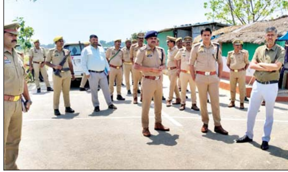
जिला संवाददाता (vol)