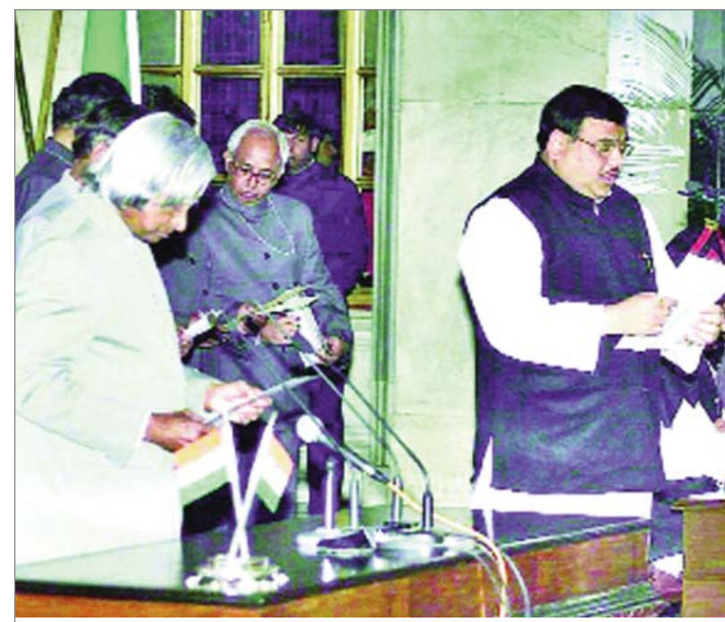
वतौर केंद्रीय राज्यमंत्री शपथग्रहण करते डॉ. अखिलेश दास गुप्ता। तत्कालीन राष्ट्रपति एपीजे अब्दुल कलाम ने शपथ ग्रहण कराया