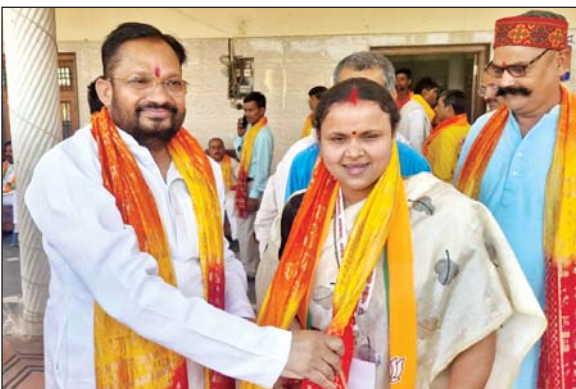
जिला संवाददाता (vol)

श्रावस्ती। पंडित दीनदयाल उपाध्याय प्रशिक्षण महाअभियान 2026 के अंतर्गत जनपद मुख्यालय भिनगा में त्रि-मंडलीय (हरिहरपुररानी, सिरसिया एवं