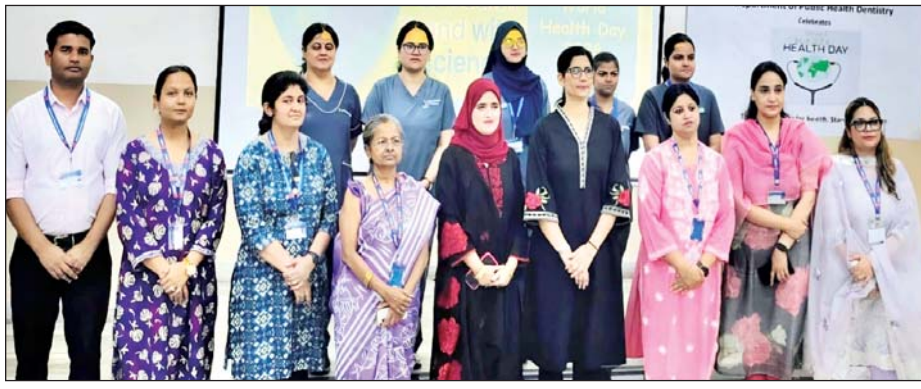
विशेष संवाददाता (vol)

लखनऊ। विश्व स्वास्थ्य दिवस 2026 के अवसर पर, जो कि प्रत्येक वर्ष 7 अप्रैल को विश्वभर में मनाया जाता है, बाबू बनारसी दास कॉलेज