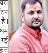
District Collector or official