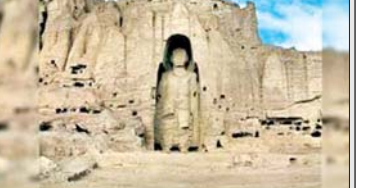
ऐतिहासिक धरोहरों पर हो रही बमों की वर्षा

मानव सभ्यता का इतिहास केवल किताबों में ही नहीं लिखा जाता, यह कई और तरीकों से भी दर्ज होता है। कलाकृतियों से, साहित्य से, महान फिल्मों से, दुनिया को बदल देने वाले आविष्कारों से और ऐतिहासिक स्थापत्यों से भी यानी वो महान इमारतें जो अपने आपमें किसी युग की सभ्यता और संस्कृति का पर्याय बन जाएं। 18 अप्रैल को विश्व धरोहर दिवस के रूप में मनाया जाता है ताकि दीवारों, खंडहरों और पत्थरों में सांस लेते इतिहास से इंसान मानव सभ्यता के अतीत की पदचाप सुन सके। लेकिन जब विश्व धरोहरों पर युद्ध के दौरान दुश्मन सारे नियम-कायदों को भूलकर उन पर बम बरसाए, उन्हें चकनाचूर करने का एक भी मौका न गंवाए, तो फिर ऐसे विश्व धरोहर दिवस (18 अप्रैल) की क्या प्रासंगिकता बचती है? यह कोई बढ़ा-चढ़ाकर की जा रही आलोचना नहीं है। मौजूदा समय में ईरान, उसके पहले इराक, सीरिया, जॉर्डन, लेबनान और गाजापट्टी पर कई ऐतिहासिक इमारतों को, जो विश्व धरोहरों के रूप में चिन्हित की गई थीं, गोला-बारूद से नेस्तनाबूद की गई हैं। ये अब महज ढांचे या खंडहर के रूप में ही बची हैं।