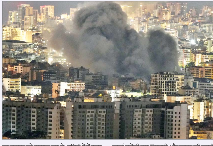
इस प्रस्ताव को व्यापक रूप से, प्रतिबंधों में राहत, असेन्य परमाणु सहयोग, ईरान के परमाणु कार्यक्रम को रोकें जाने, अंतरराष्ट्रीय परमाणु

ट्रंप की 15 शर्तें - प्रतिबंधों में राहत, असेन्य परमाणु सहयोग, परमाणु कार्यक्रम रोक जाना, होर्मुज से पोतों का आवागमन एजेंसी दुबई। ईरान को युद्धविराम के संबंध में अमेरिका की ओर से पाकिस्तानी मध्यस्थों के जरिए भेजा गया 15-सूत्री प्रस्ताव मिल गया है। पाकिस्तान के अधिकारियों ने बुधवार को यह जानकारी दी। यह प्रस्ताव ऐसे समय भेजा गया जब अमेरिका ने पश्चिम एशिया में पहले से ही तैनात मरीन की एक टुकड़ी की सहायता के लिए पैराट्रूप को भेजना शुरू कर दिया था। ईरान की सेना ने अमेरिका के कूटनीतिक प्रयासों का मजाक उड़ाया और इजराइल और फारस की खाड़ी क्षेत्र में बुधवार को और हमले किए। इनमें से एक हमले के कारण कुवैत अंतरराष्ट्रीय हवाई अड्डे पर भीषण आग लगा गई और आसमान में काल धुआं फैल गया। पाकिस्तान के अधिकारियों ने बताया कि ईरान को युद्धविराम के संबंध में अमेरिका का 15-सूत्री प्रस्ताव मिल गया है। पाकिस्तानी अधिकारियों ने