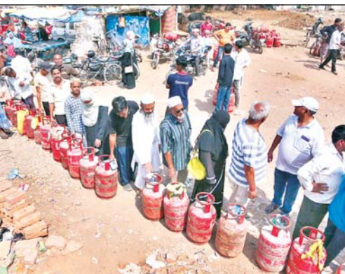
विकल्प है और इसकी आपूर्ति घरेलू उत्पादन तथा विविध स्रोतों से की जाती है। पीएनजी पाइपलाइन के माध्यम से रसोई गैस बर्नर तक लगातार पहुंचाई जाती है, जिससे सिलेंडर की बुकिंग की आवश्यकता नहीं रहती। पेट्रोलियम

समुत्पत्त्य 21.55 करोड़ से अधिक की राशि का अंतरण किया। इसके साथ ही उन्होंने 136 परिवारों को मुख्यमंत्री आवास, शौचालय और आवास के लिए भूमि के ...शेष पृष्ठ 10 पर