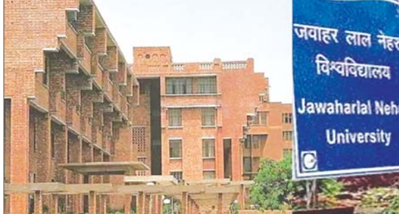
शैक्षणिक कार्यक्रमों का मूल्यांकन करती है, जिसमें 55 विषय और पांच व्यापक संकाय क्षेत्र शामिल हैं। रैंकिंग के अनुसार, भारत ने विभिन्न विषयों और व्यापक संकाय क्षेत्रों में शीर्ष 50 स्थानों में 27 स्थान हासिल किए हैं, जो 2024 में दर्ज किए गए 12 स्थानों की तुलना में दोगुने से भी अधिक हैं। ये स्थान 12 संस्थानों द्वारा प्राप्त किए गए हैं। इसके मुताबिक, धनबाद स्थित भारतीय खनन विद्यापीठ विश्वविद्यालय ने खनिज एवं खनन अभियांत्रिकी अध्ययन में वैश्विक स्तर पर 21वां स्थान ...शेष पृष्ठ 10 पर

एजेंसी नयी दिल्ली। जवाहरलाल नेहरू विश्वविद्यालय, चार भारतीय प्रौद्योगिकी संस्थान (आईआईटी) और बिरला इंस्टीट्यूट ऑफ टेक्नोलॉजी (बीआईटीएस), पिलानी विभिन्न विषयों के मामले में विश्व के शीर्ष 50 संस्थानों में शामिल हैं। क्यूएस वर्ल्ड यूनिवर्सिटी रैंकिंग ने बुधवार को यह घोषणा की। विश्व विश्वविद्यालय रैंकिंग के लिए प्रसिद्ध लंदन स्थित क्यूएस क्वाकवरेली साइमंड्स ने क्यूएस वर्ल्ड यूनिवर्सिटी रैंकिंग बाय सबजेक्ट का 16वां वार्षिक संस्करण प्रकाशित किया है। यह रैंकिंग 100 से अधिक देशों के 1900 विश्वविद्यालयों में 21000 से अधिक