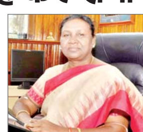
कहा कि तपेदिक-मुक्त भारत अभियान ने प्रारंभिक निदान का विस्तार करने, मुफ्त उपचार सुनिश्चित करने, पोषण संबंधी सहायता को मजबूत करने और रोगी देखभाल में सुधार करने

एजेंसी। नयी दिल्ली। राष्ट्रपति द्रौपदी मुर्मू ने तपेदिक (टीबी) को हमेशा के लिए समाप्त करने के मकसद से सभी हितधारकों से सामूहिक संकल्प के साथ मिलकर काम करने का आह्वान किया। राष्ट्रपति ने एक संदेश में कहा कि तपेदिक अब भी एक महत्वपूर्ण सार्वजनिक स्वास्थ्य चुनौती बनी हुई है, जो दुनिया भर में लाखों लोगों के जीवन को प्रभावित कर रही है। विश्व क्षय रोग दिवस की पूर्व संस्था पर मुर्मू ने