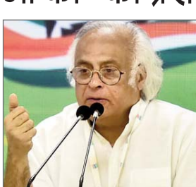
भारत की आर्थिक वृद्धि को बढ़ा-चढ़ाकर बताया गया था। ऐसा लगता है कि प्रधानमंत्री का मानना है कि अगर वह इस बेहद विश्वसनीय और परेशान करने वाली रिपोर्ट से खुद को नहीं जोड़ते तो इससे बच सकते हैं। उन्होंने कहा, अंततः प्रधानमंत्री का कोविड-19 महामारी का आह्वान चिंताजनक है।

एजेंसी। नयी दिल्ली। कांग्रेस ने सोमवार को आरोप लगाया कि प्रधानमंत्री नरेन्द्र मोदी ने लोकसभा में पश्चिम एशिया की स्थिति पर जो वक्तव्य दिया, वो आत्म-प्रशंसा, कायरता और डॉयलागबाजी से भरा हुआ था तथा ईरान पर हमले की निंदा भी नहीं की गई। पार्टी महासचिव जयराम रमेश ने यह भी कहा कि प्रधानमंत्री द्वारा कोविड काल के समय का उल्लेख करना चिंताजनक है क्योंकि उस वक्त सरकार की प्रतिक्रिया विनाशकारी थी। रमेश ने एक्स पर पोस्ट किया, आज लोकसभा में प्रधानमंत्री का अस्वाभाविक रूप से छोटा भाषण, हमेशा की तरह आत्मप्रशंसा, कायरता और डॉयलागबाजी वाला था। ईरान पर जारी अमेरिकी-इजराइल हवाई हमलों की निंदा में एक भी शब्द नहीं कहा गया। उन्होंने कहा कि खाड़ी देशों और होमुजु जलडमरूमध्य पर ईरान का हमला निश्चित रूप से पूरी तरह से अस्वीकार्य है, लेकिन शासन परिवर्तन और राज्य के पतन के उद्देश्य से ईरान पर लगातार बमबारी भी अस्वीकार्य है। कांग्रेस नेता ने कहा, प्रधानमंत्री ने भारत के आर्थिक विकास रिकॉर्ड पर भी अपना बड़बोलपन जारी रखा। कुछ दिन पहले, उनके अपने पूर्व मुख्य आर्थिक सलाहकार ने चेतावनी दी थी कि प्रधानमंत्री मोदी के कार्यकाल में