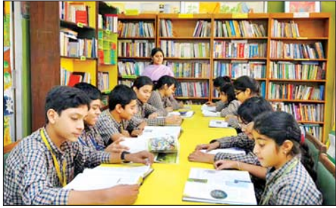
उपकरण, 20 हेडफोन, एक लैडब्रेरी कियोस्क, एक चार्जिंग कार्ट और एक प्रिंटर उपलब्ध कराया जाएगा।

नयी दिल्ली। दिल्ली सरकार 2025-26 के आर्थिक सर्वेक्षण के अनुसार 125 स्कूलों के पुस्तकालयों को आधुनिक सुविधाओं से लैस करेगी। इन पुस्तकालयों में 20 डिजिटल उपकरण, हेडफोन, एक कियोस्क और चार्जिंग कार्ट उपलब्ध कराए जाएंगे। इसके अलावा सर्वेक्षण में यह भी सामने आया है कि पहली कक्षा से आठवीं कक्षा तक के लगभग 7.50 लाख छात्रों में सीखने की कमी (लर्निंग गैप) पाई गई है। सर्वेक्षण में कहा गया है कि सितंबर 2025 में किए गए एक प्रारंभिक मूल्यांकन में बुनियादी साक्षरता और संख्यात्मक कौशल में कमियों की पहचान की गई, जिसके आधार पर शैक्षणिक हस्तक्षेप की योजना तैयार की गई है।