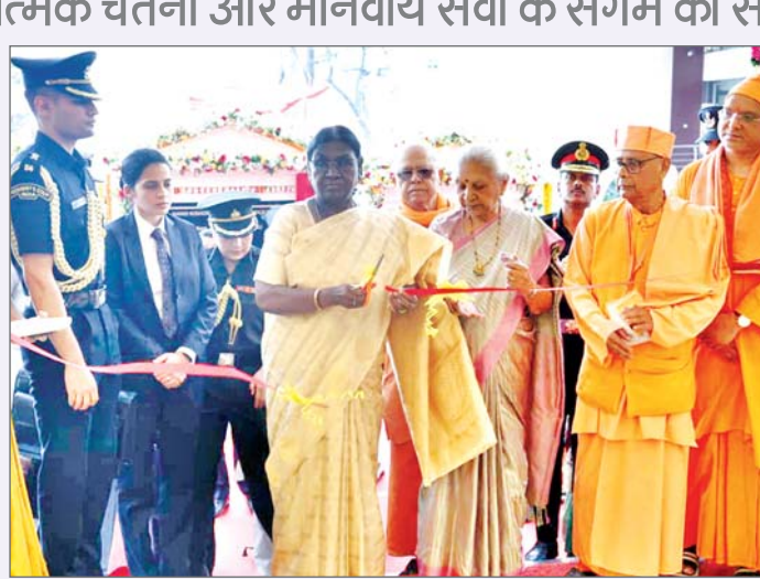
राष्ट्रपति ने रामकृष्ण मिशन को आध्यात्मिक चेतना और मानवीय सेवा के संगम का सशक्त प्रतीक बताते हुए कहा कि मिशन ने नर सेवा ही

जिला संवाददाता मथुरा। राष्ट्रपति द्रौपदी मुर्मू ने वृंदावन की पावन धरा को दिव्यता और भक्ति का जीवंत प्रतीक बताते हुए शुक्रवार को कहा कि यहां का प्रत्येक कण भगवान श्रीकृष्ण की लीलाओं का साक्षी है। उत्तर प्रदेश के मथुरा जिले में वृंदावन धाम स्थित रामकृष्ण मिशन सेवा आश्रम चैरिटेबल अस्पताल के नवनिर्मित ऑनकोलॉजी ब्लॉक का उद्घाटन करने के बाद मुर्मू ने अपने संबोधन में वृंदावन की पावन धरा को दिव्यता और भक्ति का जीवंत प्रतीक बताते हुए कहा कि यहां का प्रत्येक कण भगवान श्रीकृष्ण की लीलाओं का साक्षी है। उन्होंने मथुरा-वृंदावन को इस भूमि को सदियों से संतों और भक्तों को आध्यात्मिक चेतना प्रदान करने वाली तपोभूमि बताया। उन्होंने कहा कि जनकल्याण हेतु समर्पित एक उत्कृष्ट चिकित्सा केंद्र का इस पावन भूमि पर विकास अत्यंत पुण्य और प्रेरणादायक कार्य है।