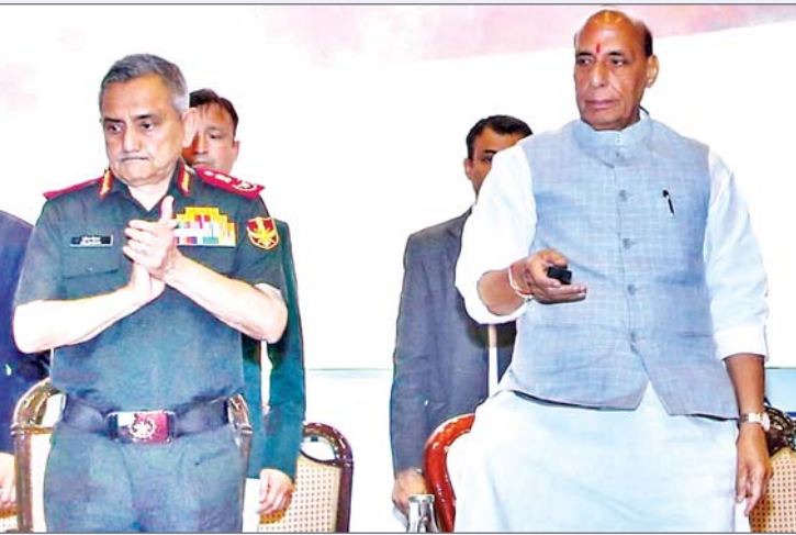
बेहद महत्वपूर्ण होने वाली है। उन्होंने कहा आज भारत में ऐसा ड्रोन निर्माण तंत्र विकसित करने की जरूरत है जिसमें हम पूरी तरह से आत्मनिर्भर हों। इस सम्मेलन में देश की प्रमुख रक्षा निर्माण कंपनियों के शीर्ष अधिकारियों के साथ-साथ सार्वजनिक क्षेत्र के उपक्रमों के अधिकारी भी

एजेंसी नयी दिल्ली। रक्षा मंत्री राजनाथ सिंह ने रूस-यूक्रेन और ईरान-इजराइल संघर्षों का जिक्र करते हुए वृहस्पतिवार को कहा कि भारत को ड्रोन निर्माण के क्षेत्र में एक मजबूत तंत्र विकसित करना चाहिए। सिंह ने राष्ट्रीय रक्षा उद्योग सम्मेलन को संबोधित करते हुए कहा कि इन दोनों संघर्षों ने ड्रोन और ड्रोन रोधी तकनीकों के महत्व को स्पष्ट रूप से दर्शाया है। रक्षा मंत्री ने कहा कि भारत को रणनीतिक स्वायत्तता सुनिश्चित करने और सैन्य क्षमता बढ़ाने के लिए आने वाले कुछ वर्षों में देशी ड्रोन निर्माण के लिए वैश्विक केंद्र बनने के उद्देश्य से मिशन मोड में काम करना चाहिए। उन्होंने कहा पूरी दुनिया इस समय रूस-यूक्रेन के साथ-साथ ईरान और इजराइल से जुड़े संघर्षों को देख रही है और हम स्पष्ट रूप से देख सकते हैं कि भविष्य के युद्धों में ड्रोन और ड्रोन रोधी तकनीकों की भूमिका