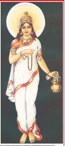
दधाना करप्रदायामक्षमला कण्ठडलु। देवीप्रसीदनु मयि ब्रह्मचारिण्यनुत्तमा ॥ शिवजी को प्रति के रूप में प्रार्थना करने के लिये उन्होंने ब्रह्म अर्थात् ईश्वर का कठिनताम किया एवं शिव प्रती हुई।