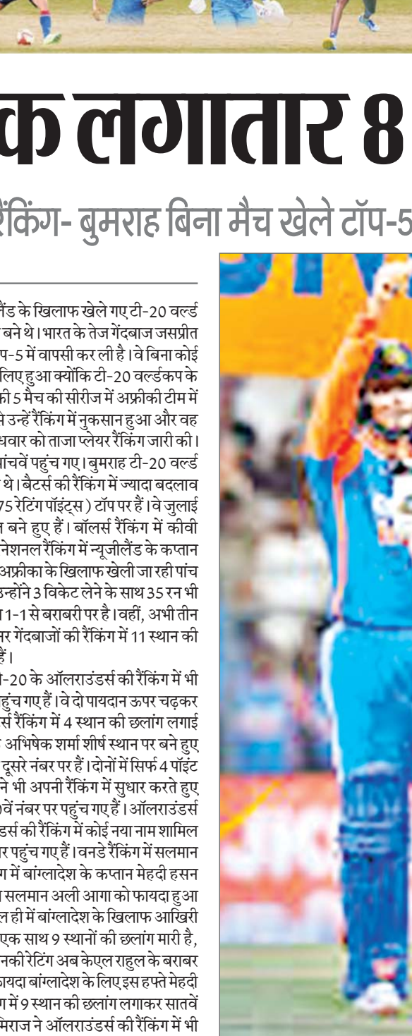
अफ्रीकी बॉलर बॉश के पाइंट्स गिरने से फायदा