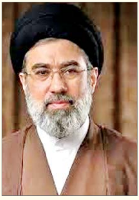
कट्टर विचारों वाला माना जा रहा है। वह युद्ध शुरू होने के बाद से सार्वजनिक रूप से नजर नहीं आए हैं। उन्हें उनके पिता की मौत से भी पहले से उनका

एजेंसी दुबई। ईरान में सर्वोच्च नेता अयातुल्ला अली खामेनेई की मौत के बाद उनके बेटे मुजतबा खामेनेई को सोमवार को देश का अगला शासक नामित किया गया। देश की असेंबली ऑफ एक्सपर्ट्स ने उनका चुनाव किया है। मुजतबा (56) के देश के अर्धसैनिक बल रिवांल्यूशनरी गार्ड से करीबी संबंध हैं। रिवांल्यूशनरी गार्डयुद्ध की शुरुआत के दौरान 28 फरवरी को अयातुल्ला अली खामेनेई (86) की मौत के बाद से इजराइल और खाड़ी के अरब देशों पर मिसाइलों और ड्रोन से हमले कर रहा है। मुजतबा को उनके पिता से भी ज्यादा