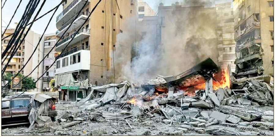
एयरस्ट्राइक की खबरें सामने आई हैं। इजराइल ने एक बार फिर ईरान पर बड़े पैमाने पर हवाई हमले शुरू किए हैं। इजराइली सेना के मुताबिक राजधानी तेहरान, मध्य ईरान के इस्फहान और दक्षिणी इलाकों में ईरानी शासन से जुड़े इन्फ्रास्ट्रक्चर को निशाना बनाकर एयरस्ट्राइक किए जा रहे हैं। इजराइली सेना ने ...शेष पृष्ठ 14 पर

एजेंसी तेल अवीव/तेहरान। अमेरिका-इजराइल और ईरान के बीच जारी जंग का आज दसवां दिन है। इजराइल ने एक बार फिर ईरान पर बड़े पैमाने पर हवाई हमले शुरू किए हैं। इजराइली सेना के मुताबिक राजधानी तेहरान, इस्फहान और दक्षिणी इलाकों में ईरानी शासन से जुड़े इन्फ्रास्ट्रक्चर को निशाना बनाकर एयरस्ट्राइक किए जा रहे हैं। ईरान के विदेश मंत्रालय के प्रवक्ता ने कहा कि जब तक हमले जारी हैं, तब तक बातचीत की कोई गुंजाइश नहीं है और ईरान निर्णायक जवाब देने पर ध्यान दे रहा है। लेबनान की राजधानी बेरुत के दक्षिणी उपनगरों में भी कई