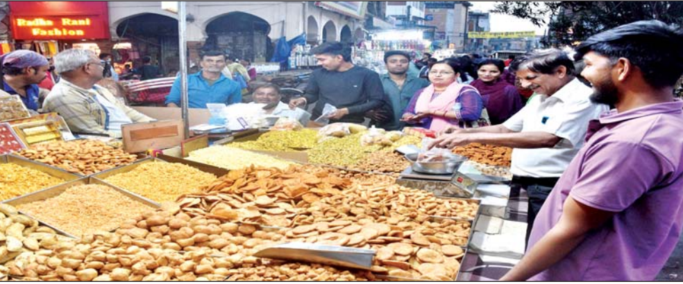
खासतौर पर बहुत पसंद आ रही है। बच्चे भी