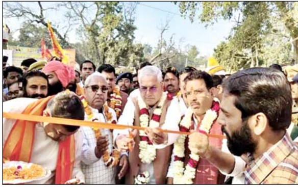
जिला संवाददाता (VOL)

सीतापुर। जनपद में चल रही पावन 84 कोशी परिक्रमा के अंतर्गत पंचकोशी पड़ाव पर लगने वाले पारंपरिक मेले का आज भव्य शुभारंभ किया गया। मुख्य अतिथि के रूप में प्रदेश सरकार के प्रभारी मंत्री मयंकेश्वर शरण सिंह ने फीता काटकर मेले का उद्घाटन किया। इस अवसर पर क्षेत्रीय विधायक रामकृष्ण भागवत विशेष रूप से उपस्थित रहे। 18 तारीख से प्रारंभ हुई 84 कोशी परिक्रमा विभिन्न पड़ावों से होती हुई पंचकोशी के लिए मिश्रिख पहुंच चुकी है। परिक्रमा के आगमन के साथ ही कस्बा मिश्रिख में