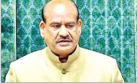
का समाधान कर रहे हैं। इन चुनौतियों का समाधान हमारी जिम्मेदारी है। उन्होंने जोर देकर कहा कि वैश्विक चुनौतियों से निपटने के लिए देश के नौजवानों को और कठिन परिश्रम करते हुए अपना सामर्थ्य बढ़ाना होगा। हमें अपने विश्वविद्यालयों के परिसरों में साझा प्रयास करते हुए खुद को बदलती तकनीकों के मुताबिक ढालना होगा ताकि हम वैश्विक चुनौतियों का मुकाबला करने के लिए और सक्षम

इंदौर (मध्य प्रदेश)। युवा आवादी को भारत की सबसे बड़ी ताकत बताते हुए लोकसभा अध्यक्ष ओम बिरला ने शुक्रवार को कहा कि दुनिया अपनी चुनौतियों के समाधान के लिए देश की ओर देख रही है। बिरला, इंदौर के श्री वैष्णव विद्यापीठ विश्वविद्यालय के आठवें दीक्षांत समारोह को मुख्य अतिथि के रूप में संबोधित कर रहे थे। उन्होंने कहा कि दुनिया के सारे देश अपनी चुनौतियों के समाधान के लिए भारत की ओर देख रहे हैं। इन देशों की निगाहें हमारे नौजवानों की जनसांख्यिकीय ताकत पर हैं। लोकसभा अध्यक्ष ने कहा कि नौजवान भारत की सबसे बड़ी ताकत हैं जिनका सामर्थ्य, आत्मविश्वास और नयी दृष्टि भारत को विकास के पथ पर ले जा रही है। उन्होंने कहा कि कई देशों की आबादी में युवाओं की तादाद घट रही है जिससे चुनौतियों से लड़ने का उनका सामर्थ्य भी कम हो रहा है। बिरला ने कहा कि नवाचारों और नये अनुसंधानों के बूते वैश्विक चुनौतियों के समाधान के लिए भारत के नौजवानों का सामर्थ्य लगातार बढ़ रहा है। हमारे नौजवान स्टार्ट-अप के माध्यम से भारत के साथ ही दुनिया भर की चुनौतियों