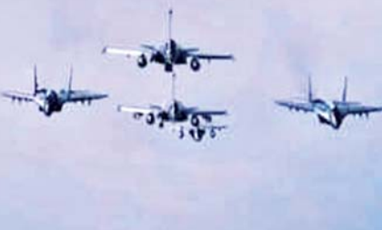
को चिह्नित करना व लक्ष्यों को तबाह करना शामिल है। इसके तहत जगुआर और मिराज लड़ाकू विमानों ने ऑपरेशन सिंदूर के दौरान अपने हमले के समन्वित तरीके को दोहराते हुए एक साथ लक्ष्यों को निशाना बनाया। सुखोई लड़ाकू विमान ने आतंकी शिविर पर हमला किया। स्वदेशी हलके लड़ाकू हेलीकॉप्टर प्रचंड ने नकल रीप्यूटिंग पॉइंट पर हमला करके अपनी फुर्ती दिखाई।

जैसलमेर। भारतीय वायुसेना ने शुक्रवार शाम भारत-पाक अंतरराष्ट्रीय सीमा के पास पोकरण में वायुशक्ति अभ्यास में अपनी ताकत का प्रदर्शन किया जिसे देखने के लिए राष्ट्रपति द्रौपदी मुर्मू भी मौजूद थीं। जैसलमेर जिले में थार के रेगिस्तानी इलाके में वायुसेना ने इस अभ्यास में अपनी जंगी ताकत दिखाई। शुक्रवार शाम शुरू हुए इस अभ्यास के अवसर पर रक्षा मंत्री राजनाथ सिंह, राजस्थान के राज्यपाल हरिभाऊसाहेब और केंद्रीय मंत्री गजेंद्र सिंह शेखावत भी मौजूद थे। कार्यक्रम को शुरूआत राष्ट्रपति ने राष्ट्रगीत से हुई। अभ्यास के दौरान तीन किलोमीटर के इलाके में फैले लक्ष्यों को दिखाया गया। प्रदर्शन के लिए बनाए गए लक्ष्यों में दुश्मन का रनवे, पेट्रोलियम भंडार, बंकर, राडार स्थल, टैंक और सशस्त्र काफिले, कम्यूनिकेशन सेंटर, आतंकी शिविर, शस्त्र भंडार व हैंगर शामिल था। इसके बाद लड़ाकू विमान व युद्धक हेलीकॉप्टर ने तालमेल बिठाकर ऑपरेशन शुरू किया। इसमें रणनीति बनाना, लक्ष्य