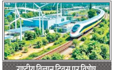
राष्ट्रीय विज्ञान दिवस पर विशेष

भारत ने अंतरिक्ष क्षेत्र में महत्वपूर्ण उपलब्धियां हासिल कीं। भारतीय अंतरिक्ष अनुसंधान संगठन इसरो ने चंद्रयान और अद्वितीय मिशन ने भारत को वैश्विक मंच पर विश्वसनीयता से स्थापित किया है और साल 2047 तक हमारा लक्ष्य है कि हम मानव अंतरिक्ष मिशन की नियमित उड़ानें करें। आज निजी स्पेस स्टार्टअप में 8 से 10 फीसदी का वैश्विक बाजार है। सैटेलाइट आधारित कृषि, आपदा और शिक्षा सेवाओं के विस्तार हेतु यह बहुत जरूरी है। सरकार को चाहिए कि वो संचार, मोबाइल और पूर्वाह्नमान जैसे मामलों में रक्षा-सुरक्षा के आधार को बढ़ाए। देश के लिए जरूरी है सेमिकंडक्टर और इलेक्ट्रॉनिक्स में आत्मनिर्भरता डिजिटल युग में सेमिकंडक्टर चिप्स, नई 'तेल' अर्थव्यवस्था का रूप ले चुके हैं। भारत में साल 2023 से 2025 के बीच सेमिकंडक्टर विनिर्माण के लिए कई प्रोत्साहन योजनाएं शुरू की हैं और अगले चार सालों में यानी 2030 तक हम कम से कम दो या