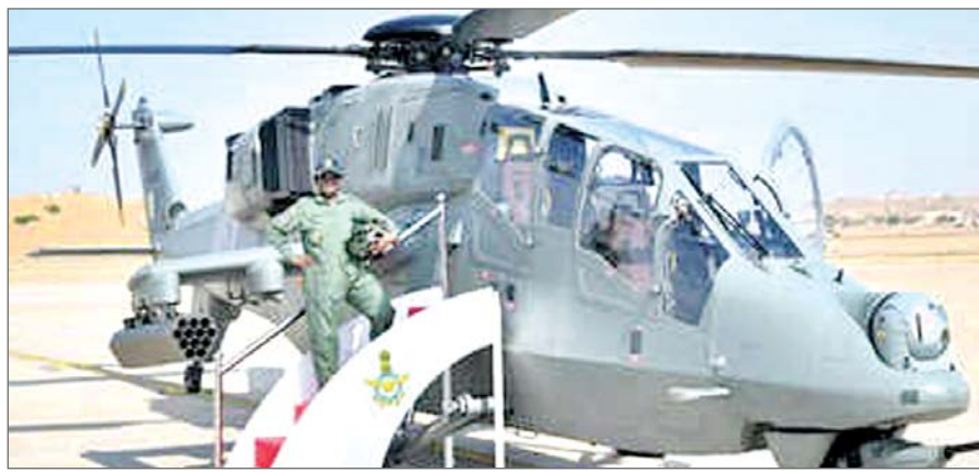
प्रचंड को आत्मनिर्भरता का सशक्त प्रतीक बताया। उन्होंने कहा, प्रचंड हेलीकॉप्टर आत्मनिर्भरता का प्रबल प्रतीक है। इस समय मैं जैसलमेर के प्रसिद्ध किले के ऊपर से उड़ान भर रही हूँ। मैं देश के वीर बहादुर सैनिकों को अत्यंत गर्व के साथ