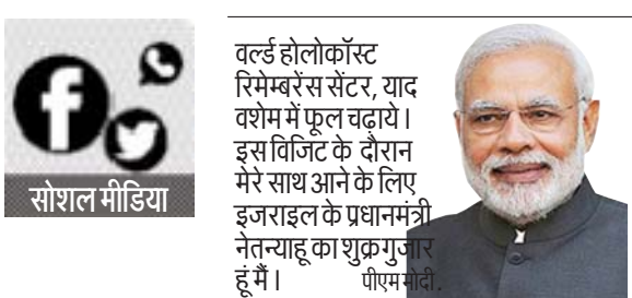
वर्ल्ड होलोकॉस्ट रिमेम्बरेंस सेंटर, याद वशेम में फूल चढ़ाये। इस विजिट के दौरान मेरे साथ आने के लिए इजराइल के प्रधानमंत्री नेतन्याहू का शुक्र गुजारूँ हूँ मैं। पीएम मोदी

वास्तव में मोदी की इस यात्रा के पीछे यह सबसे बड़ा हित शामिल है कि इजरायल, भारत को अपना एरियल डिफेंस सिस्टम जो कि बहु स्तरीय सुरक्षा कवच है, जो शॉर्ट से लेकर लाना रूट मिसाइलों, ड्रोन और रॉकेट हमलों से रक्षा करता है। भारत उनके इन दो प्रमुख सिस्टम आयरन डोम और डेविड स्लिंग को न सिर्फ पाना चाहता है बल्कि कहा जा रहा है कि अब इजरायल, भारत के साथ भारत में ही इस सिस्टम को विकसित करेगा।