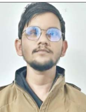
बम से उड़ाने की धमकी दिया गया ताकि पुलिस उन सभी लोगों को गिरफ्तार कर जेल भेज दे और इसका बदला पूरा हो सके।