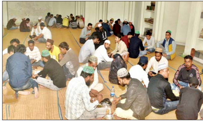
वरिष्ठ संवाददाता (vol)

लखनऊ। अल्लाह की राह में दिन भर के भूखे-प्यासे इबादतगुजारों ने शुक्र का सजदा कर, दूसरा रोजा मुकम्मल किया। मगरिब (सूरज डूबने के बाद) की नमाज के बाद रोजा खोला। तड़के सहर्री का समय खत्म होने पर पहले रोजे की नियत की गई। फिर फज्र (अल सुबह) की नमाज अदा की। कुरआन-ए-पाक के पारों की तिलावत की। मस्जिदों से लेकर घर कुरआन-ए-पाक की तिलावत से रोजाना रहे। खुशनुमा मौसम के साथ रमजान की अल सुबह शुरूआत हुई।