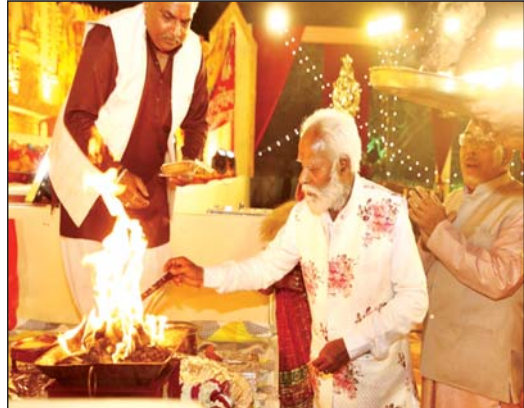
वरिष्ठ संवाददाता (vol)

मल्ल राजवंश के भव्य राजदरबार में विराजे बाबा खादू नरेश