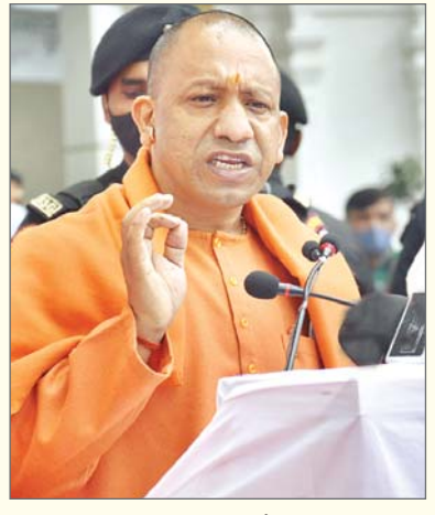
मानव संसाधन विकसित करना है। उन्होंने बताया कि एआई प्रज्ञा पहल के माध्यम से दस लाख से अधिक युवाओं को अत्याधुनिक तकनीकी कौशल से लैस किया जा रहा है, ताकि वे ...शेष पृष्ठ 14 पर

विशेष संवाददाता लखनऊ। मुख्यमंत्री योगी आदित्यनाथ ने इंडिया एआई इपैक्ट समिट 2026 में प्रधानमंत्री नरेंद्र मोदी द्वारा प्रस्तुत मानव-केंद्रित, जिम्मेदार और पारदर्शी एआई विज्ञान को ऐतिहासिक कदम बताते हुए कहा कि उत्तर प्रदेश इस दृष्टि को धरातल पर उतारने के लिए दृढ़ संकल्प के साथ आगे बढ़ रहा है। उन्होंने कहा कि प्रधानमंत्री का एम.एन.ए.वी. की भावना पर आधारित एआई का विचार न केवल तकनीकी प्रगति, बल्कि नैतिक, समावेशी और जवाबदेह नवाचार का मार्ग प्रशस्त करता है।