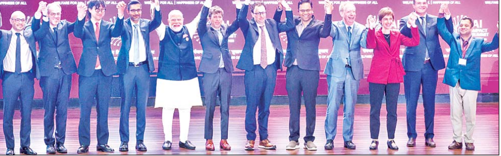
भारत-फ्रांस साझा दृष्टिकोण के लिए सहमत

एजेंसी नयी दिल्ली। प्रधानमंत्री नरेंद्र मोदी ने कृत्रिम बुद्धिमत्ता (एआई) की पहुंच सभी तक सुनिश्चित किए जाने की वकालत करते हुए बुधस्वतिवार को मानव विज्ञान का अनावरण किया जिसके तहत संप्रभुता और समावेशिता पर विशेष जोर देते हुए तेजी से उभरती इस प्रौद्योगिकी के उपयोग एवं मानव-केंद्रित दृष्टिकोण को अपनाने की परिकल्पना की गई है। प्रधानमंत्री मोदी ने कहा एआई हमारे तंत्रों को अधिक स्मार्ट, अधिक दक्ष व अधिक प्रभावी बनाएगा। यह लोगों के लिए रचनात्मक भूमिकाएं अपनाने के लिए और अवसरों के द्वार खोलेगा। एआई रोजगार के नये अवसर प्रदान करेगा और भारतीय युवाओं को रोजगार दिलाने में बड़ी मदद करेगा।