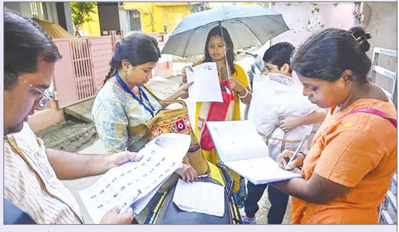
नौ राज्यों और तीन केंद्र शासित प्रदेशों में यह अभी जारी है। असम में एसआईआर के बजाय विशेष पुनरीक्षण 10 फरवरी को पूरा हो गया था। यह चुनाव आयोग की एक प्रक्रिया है। इसमें घर-घर जाकर लोगों से फॉर्म भरवाकर वोट लिस्ट अपडेट की जाती है। 18 साल से ज्यादा के नए वोटर्स को जोड़ा जाता है। ऐसे लोग जिनकी मौत हो चुकी है या जो दूसरी जगह शिफ्ट हो चुके हैं, उनके नाम हटाए जाते हैं।

एजेंसी नयी दिल्ली। निर्वाचन आयोग ने बुधस्वतिवार को 22 राज्यों और केंद्र शासित प्रदेशों को विशेष गहन पुनरीक्षण (एसआईआर) से संबंधित तैयारी का काम जल्द से जल्द पूरा करने को कहा है, क्योंकि इस प्रक्रिया के अप्रैल से शुरू किये जाने के आसार हैं। एक बार यह प्रक्रिया पूरी हो जाने पर सभी राज्य और केंद्र शासित प्रदेश (यूटी) इसके दायरे में आ जाएंगे।