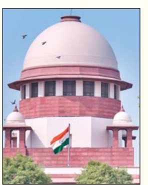
र कर रही थी। इसने कहा कि अदालत के समक्ष ऐसा कुछ भी नहीं लया गया है जो लघु वाद न्यायालय और अपीलपीठ पीठ द्वारा तथ्यों और कानून के सुविचारित और सर्वसम्मत निष्कर्ष में हस्तक्षेप को उचित ठहराये और न ही संविधान के अनुच्छेद 227 के तहत उच्च न्यायालय द्वारा पारित आदेश में। इसने पिछले साल छह नवंबर को उच्च