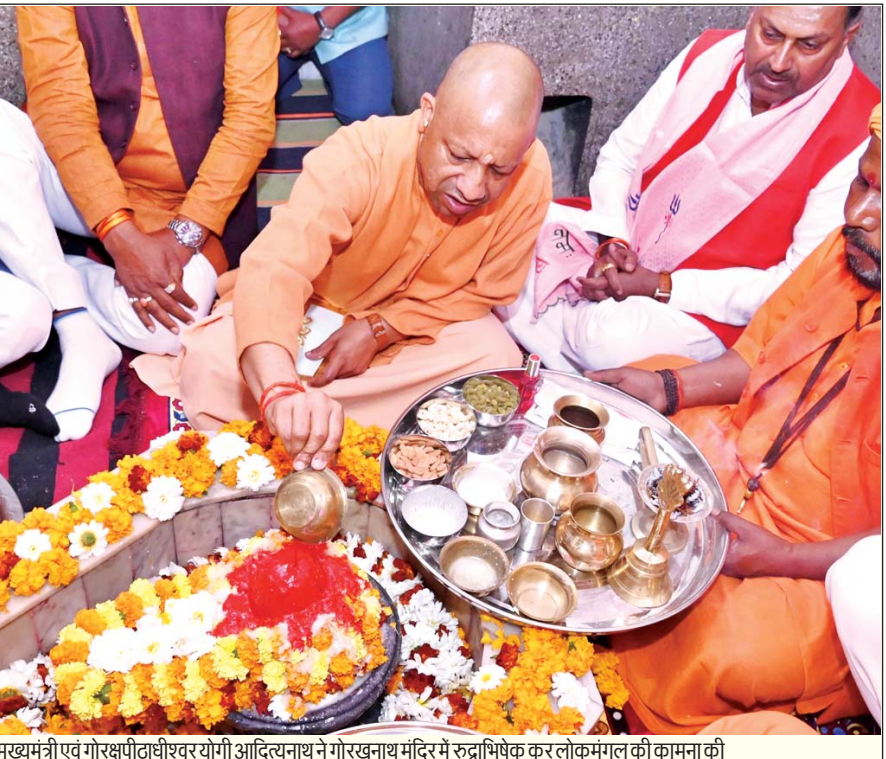
मुख्यमंत्री एवं गोरक्षापीठाधीश्वर योगी आदित्यनाथ ने गोरखनाथ मंदिर में रुद्राभिषेक कर लोकरामंगल की कामना की

बांग्लादेश में तारिक के शपथ ग्रहण समारोह में भारत का प्रतिनिधित्व करेंगे बिरला लोकसभा अध्यक्ष ओम बिरला 17 फरवरी को बांग्लादेश में तारिक रहमान के शपथ ग्रहण समारोह में भारत का प्रतिनिधित्व करेंगे। प्रधानमंत्री नरेन्द्र मोदी को शपथ ग्रहण समारोह में आमंत्रित किया था। } 16