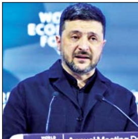
अन्य बुनियादी ढांचों और लोगों को रूसी हमलों से बचाने में मदद करती हैं। युद्ध को समाप्त करने पर आम सहमति बनाने के लिए अमेरिका के नेतृत्व में प्रयास किए गए हैं, जिनमें हाल ही में संयुक्त अरब अमीरात (यूएई) की राजधानी अबू धाबी में हुई

एजेंसी कीव। यूक्रेन के राष्ट्रपति वोलेदिमिर जेलेन्सकी ने अपने अंतरराष्ट्रीय सहयोगियों को उनके समर्थन के लिए धन्यवाद दिया। हालांकि, उन्होंने संकेत दिया कि यूक्रेन के लिए भविष्य की सुरक्षा गारंटी को लेकर इन देशों के मन में अब भी कुछ सवाल हैं। जेलेन्सकी ने शनिवार को जर्मनी में म्यूनिख सुरक्षा सम्मेलन में यूक्रेन की मदद करने के लिए अमेरिकी और यूरोपीय सहयोगियों का आभार व्यक्त किया। अमेरिका और यूरोपीय देशों ने यूक्रेन को हवाई क्षमता प्रणालियां प्रदान की हैं, जो उसके बिजली संयंत्रों सहित