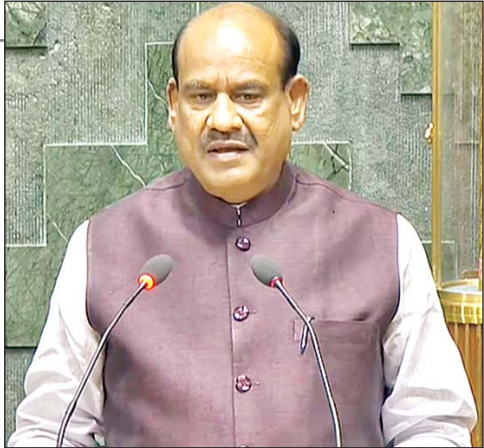
लोकसभा अध्यक्ष का शामिल होना भारत और बांग्लादेश के लोगों के बीच गहरी मित्रता को दर्शाता है, और हमारे दोनों देशों के जुड़ाव वाले लोकतांत्रिक मूल्यों के प्रति भारत के दृढ़ संकल्प की पुष्टि करता है।

दिल्ली। लोकसभा अध्यक्ष ओम बिरला 17 फरवरी को बांग्लादेश में प्रधानमंत्री पद के लिए तारिक रहमान के शपथ ग्रहण समारोह में भारत का प्रतिनिधित्व करेंगे। पता चल रहा है कि बांग्लादेश ने प्रधानमंत्री नरेन्द्र मोदी को ढाका में होने वाले शपथ ग्रहण समारोह में आमंत्रित किया था। विदेश मंत्रालय ने रविवार को कहा कि लोकसभा अध्यक्ष ओम बिरला भारत सरकार की ओर से तारिक रहमान के नेतृत्व वाली बांग्लादेश की नयी सरकार के शपथ ग्रहण समारोह में शामिल होंगे। रहमान की अगुवाई में बांग्लादेश नेशनलिस्ट पार्टी (बीएनपी) को बांग्लादेश के संसदीय चुनावों में शानदार जीत मिली है। मंत्रालय ने एक बयान में कहा, इस महत्वपूर्ण समारोह में