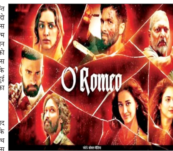
कलेक्शन किया था, जिसके बाद शनिवार को फिल्म ने 14.50 करोड़ के लगभग कमाई की है। इसी के साथ फिल्म ने कुल 23.51 करोड़ का बॉक्स ऑफिस कलेक्शन कर लिया है। ओपनिंग डे के मुकाबले फिल्म के बॉक्स ऑफिस कलेक्शन में 45 प्रतिशत का उछाल देखने मिला है। फिल्म देशभर में 4700 से ज्यादा स्क्रीन्स पर रिलीज हुई है। फिल्म की ऑक्स्पेंसी लगभग 19.3 प्रतिशत है। अनुमान है कि शनिवार की ही तरह रविवार को भी फिल्म अच्छा

मुंबई। शाहिद कपूर और तुषि डिमरी स्टारर फिल्म ओ रोमियो ने दो दिनों में 23.51 करोड़ रुपए का बॉक्स ऑफिस कलेक्शन कर लिया है। फिल्म ने 9 करोड़ रुपए का ओपनिंग कलेक्शन किया था, जिसके बाद अब फिल्म को वीकेंड का फायदा मिला है। बॉक्स ऑफिस ट्रैकर वेबसाइट सैकनिलक के मुताबिक, 13 फरवरी को रिलीज हुई फिल्म ओ रोमियो ने 9 करोड़ का शनिवार में बॉक्स ऑफिस कलेक्शन 14.50 करोड़