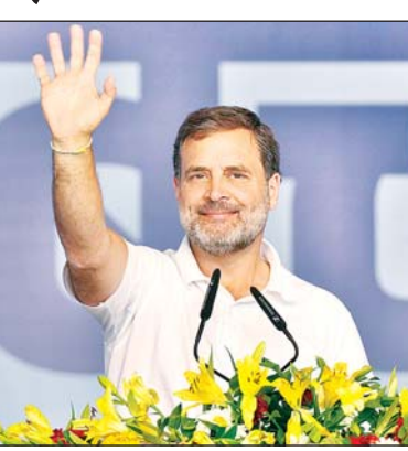
डिस्ट्रिक्ट ग्रेन (डीडीजी) के आयात का क्या मतलब है? राहुल ने कहा, क्या इसका मतलब यह है कि भारतीय मवेशियों को जीएम (अनुवांशिक रूप से परिवर्तित)

एजेंसी नयी दिल्ली। कांग्रेस नेता राहुल गांधी ने भारत और अमेरिका के बीच हुए अंतिम व्यापार समझौते को लेकर केंद्र सरकार पर हमला तेज करते हुए रविवार को प्रधानमंत्री नरेन्द्र मोदी से कई सवाल किए और किसानों के साथ विश्वासघात होने का आरोप लगाया। राहुल ने सरकार पर इस समझौते के जरिबे आत्मसमर्पण करने का आरोप लगाते हुए कहा कि यह मुद्दा देश के भविष्य से जुड़ा है। उन्होंने सवाल किया कि क्या भारत किसी दूसरे देश को अपने कृषि क्षेत्र पर दीर्घकालिक नियंत्रण हासिल करने की अनुमति दे रहा है। लोकसभा में नेता प्रतिपक्ष ने एक्स पर लिखा, अमेरिका से व्यापार समझौते के नाम पर हम भारत के किसानों के साथ विश्वासघात होते हुए देख रहे हैं। उन्होंने प्रधानमंत्री से सवाल किया कि ड्राइड