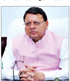
○ 20 आईपीएस अफसरों के तबादले देहरादून के एएसपी भी बदले