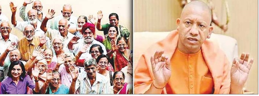
महिलाओं, दिव्यांगजनों और वृद्धों 1000 रुपये पेंशन को दी जाती है। अभी हर साल 12000 रुपए मिलते हैं। सीएम ने कहा प्रदेश में पिछले नौ वर्षों के दौरान महिलाओं की भागीदारी, सुरक्षा और आत्मनिर्भरता के क्षेत्र में ऐतिहासिक परिवर्तन हुआ है। वर्ष 2017 से पहले प्रदेश में महिला वर्कफोर्स की भागीदारी 12 से 13 प्रतिशत के बीच थी, जो अब बढ़कर 36 से 37 प्रतिशत तक पहुंच गई है। इसे तीन गुना से अधिक वृद्धि बताते हुए कहा कि यह बदलाव केवल आंकड़ों में नहीं बल्कि सामाजिक और आर्थिक जीवन में भी स्पष्ट रूप से दिखाई देता है। उत्तर प्रदेश पुलिस की ही बात करूँ तो महिलाओं की संख्या मात्र 10,000 थी, आज यह संख्या 44,000 पहुंच चुकी है। उन्होंने नेता प्रतिपक्ष माता प्रसाद पांडेय से कहा कि आपके समय में तो एक कहावत प्रचलित थी, देख