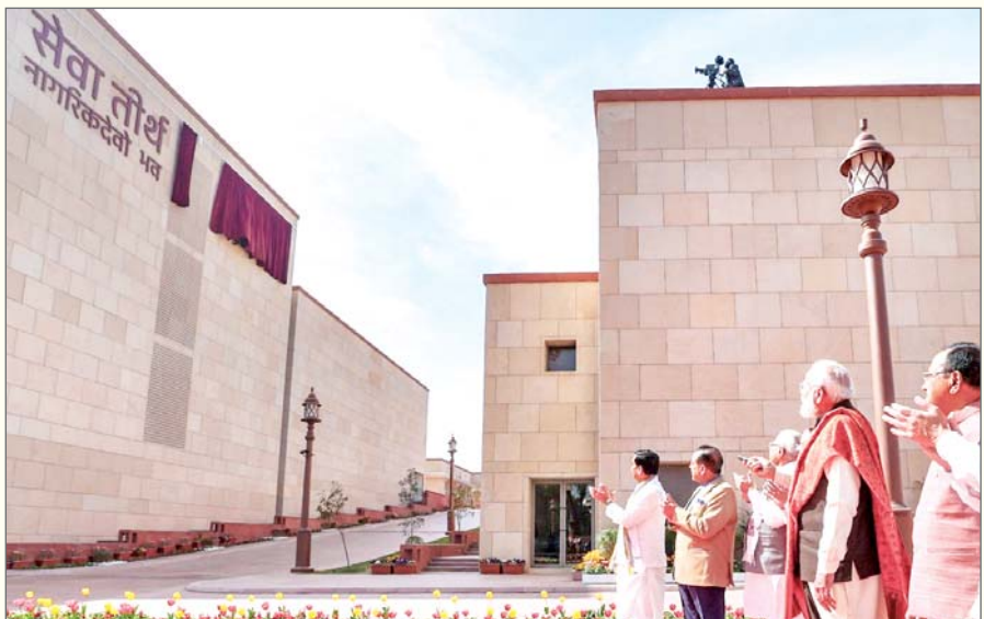
नौकरशाहों और केंद्र सरकार के अन्य अधिकारियों को उपस्थित में आयोजित एक कार्यक्रम में कहा सेवा तीर्थ, कर्तव्य भवन। और 2, विकसित भारत की दिशा में भारत की यात्रा में एक महत्वपूर्ण मील का पत्थर है। ये