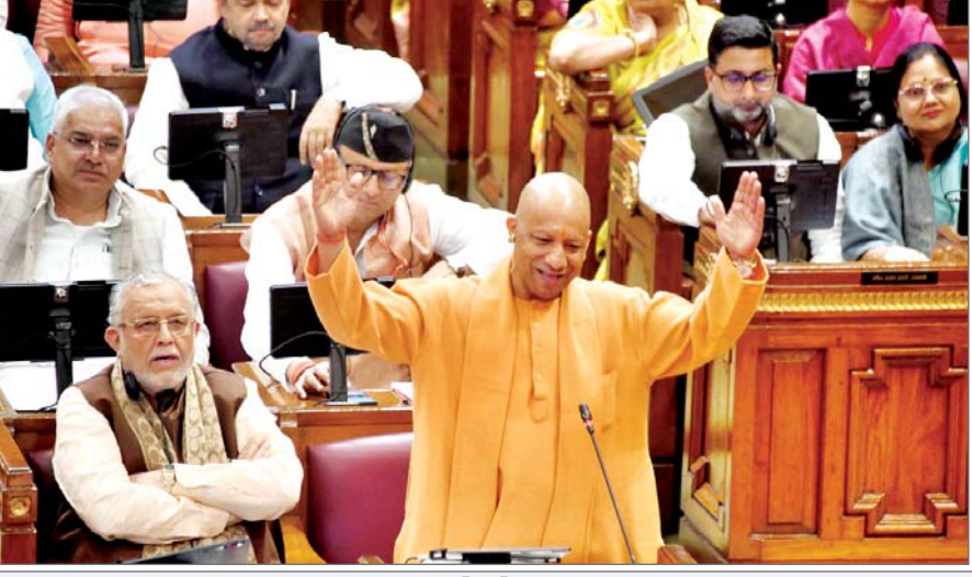
माफिया की तरह इन्सेफेलाइटिस पर भी किया प्रभावी नियंत्रण : मुख्यमंत्री

विशेष संवाददाता लखनऊ। राज्यपाल के अभिभाषण पर शुक्रवार को विधानसभा में धन्यवाद प्रस्ताव पर चर्चा में के दौरान मुख्यमंत्री योगी आदित्यनाथ ने कहा कि पिछले नौ वर्षों की यात्रा अपराध और अव्यवस्था से अनुशासन की यात्रा है। कर्फ्यू से कानून के राज की यात्रा है। उपद्रव से उत्सव की यात्रा है। समस्या से समाधान की यात्रा है और अविश्वास से आत्मविश्वास की यात्रा है। अपने संबोधन में मुख्यमंत्री ने उत्तर प्रदेश की उपलब्धियों, नीतिगत बदलावों और भविष्य की दिशा का व्यापक खाका प्रस्तुत किया। मुख्यमंत्री ने जोर देकर कहा कि उत्तर प्रदेश अब भय का नहीं, विश्वास और विकास का प्रदेश है। अपराध और अव्यवस्था से अनुशासन की यात्रा केवल प्रशासनिक बदलाव नहीं, बल्कि मानसिकता और नीतिगत प्रतिबद्धता का परिणाम है। राजनीतिक मतभेद लोकतंत्र का हिस्सा हैं, लेकिन संवैधानिक संस्थाओं की गरिमा बनाए