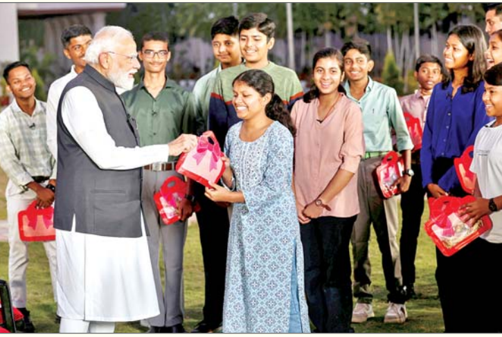
आग्रह किया कि वे एआई जैसी उभरती प्रौद्योगिकियों से न डरें, बल्कि उनका उपयोग अपने कौशल को निखारने के लिए करें। उन्होंने कहा हमें एआई या मोबाइल फोन को अपना मालिक नहीं बनने देना चाहिए, कुछ बच्चे स्मार्टफोन देखे बिना खाना नहीं खाते। हमें

एजेंसी नयी दिल्ली। प्रधानमंत्री नरेन्द्र मोदी ने सोमवार को छात्रों को सल्लाह दी कि वे प्रौद्योगिकी को उन्हें गुलाम नहीं बनाने दें और कृत्रिम बुद्धिमत्ता (एआई) का उपयोग मार्गदर्शन और अपने काम में बेहतर लाने के लिए किया जाना चाहिए, न कि सीखने के विकल्प के रूप में। प्रधानमंत्री के वार्षिक परीक्षा पे चर्चा कार्यक्रम के नौवें संस्करण की दूसरी कड़ी में, मोदी ने कहा कि मोबाइल फोन उन कुछ बच्चों के मालिक बन गए हैं, जो उनके या टेलीविजन स्क्रीन के बिना खाना भी नहीं खा सकते। उन्होंने कोयंबटूर, रायपुर, गुवाहाटी और गुजरात के विद्यार्थियों से हुई बातचीत में कहा हर युग में नयी प्रौद्योगिकियां, चाहे कंप्यूटर हों या मोबाइल फोन, को लेकर चिंताएं रही हैं। लेकिन यह डर बेवजह है। आपको यह दृढ़ संकल्प लेना होगा कि हम प्रौद्योगिकी के गुलाम नहीं बनेंगे। प्रधानमंत्री ने विद्यार्थियों से