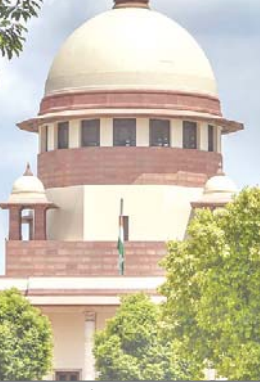
नाम हटाए जाने की आशंका जाहिर की गई है। पीठ ने कहा हम किसी को भी एसआईआर प्रक्रिया में बाधा डालने की अनुमति नहीं देंगे। राज्यों को यह बात स्पष्ट हो जानी चाहिए। शीर्ष अदालत ने निर्वाचन आयोग की ओर से