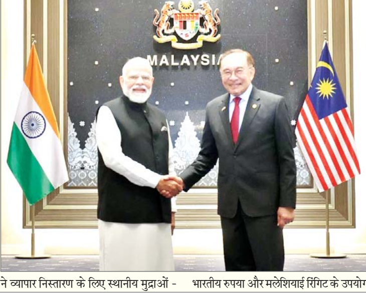
ने व्यापार निस्तारण के लिए स्थानीय मुद्राओं - भारतीय रुपया और मलेशियाई रिंगिट के उपयोग

एजेंसी कुआलालंपुर। भारत और मलेशिया ने रिविवा को व्यापार एवं निवेश, रक्षा, ऊर्जा, उन्नत विनिर्माण तथा सेमीकंडक्टर जैसे उच्च प्रारथमिकता वाले क्षेत्रों में अपने संबंधों का विस्तार करने का संकल्प लिया। प्रधानमंत्री नरेंद्र मोदी ने जोर देकर कहा कि दोनों पक्ष हिंद-प्रशांत क्षेत्र में शांति एवं स्थिरता के लिए प्रतिबद्ध हैं। मलेशिया के प्रधानमंत्री अनवर इब्राहिम के साथ व्यापक वार्ता के बाद मोदी ने आतंकवाद से निपटने के मुद्दे पर भारत के रुख को दोहराते हुए कहा कि आतंकवाद पर हमारा संदेश स्पष्ट है, कोई दोहरा मापदंड नहीं, कोई समझौता नहीं। दोनों पक्षों ने सेमीकंडक्टर क्षेत्र में गहन सहभागिता के लिए एक रूपरेखा समझौते सहित कई प्रमुख क्षेत्रों में सहयोग बढ़ाने के लिए कुल 11 समझौतों और दस्तावेजों पर हस्ताक्षर किए। मोदी शनिवार को कुआलालंपुर पहुंचे। मोदी और इब्राहिम दोनों ने व्यापार निस्तारण के लिए स्थानीय मुद्राओं - भारतीय रुपया और मलेशियाई रिंगिट के उपयोग