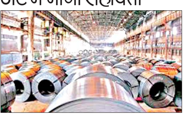
लखनऊ रविवार 25 जनवरी 2026

धातु कबाड़ आपूर्ति श्रृंखला पर लगू करने का भी आग्रह किया है। इसका उद्देश्य कर चोरी रोकना, अनुपालन को सरल बनाना और कारोबार सुगमता में सुधार करना है। जीएसटी के तहत रिवर्स चार्ज मैकेनिज्म कुछ अधिसूचित वस्तुओं या सेवाओं के लिए कर भुगतान की जिम्मेदारी आपूर्तिकर्ता से प्राप्तकर्ता (खरीदार) पर स्थानान्तरित कर देता है। जैसे-जैसे