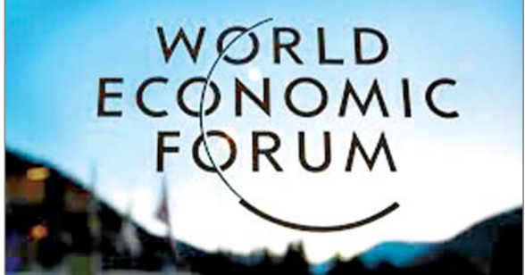
अर्थ/विविध, 2025 में आयोजित किया गया

गाजा और यूक्रेन के लिए अपनी शांति योजनाओं पर कुछ प्रगति करते नजर आए। उन्होंने यूक्रेनी राष्ट्रपति वोलोदिमिर जेलेंस्की से मुलकात की और इसे एक अच्छी बैठक बताया। साथ ही, उन्होंने रूसी राष्ट्रपति व्लादिमीर पुतिन के पास एक दूत भेजकर यह संदेश दिया कि युद्ध अभी समाप्त होना चाहिए। भारत-अमेरिका व्यापार समझौते के बारे में ट्रंप ने कहा कि मोदी उनके दोस्त हैं और जल्द ही एक अच्छा समझौता होगा। भारत के