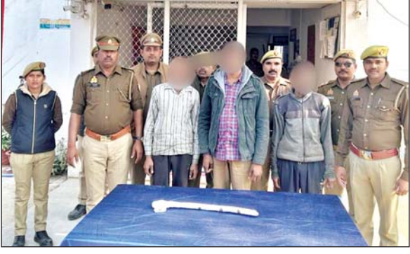
फांरसिक टीम के साथ साक्ष्य संग्रह किया।

थी वह अब शांत हो रही है। यह सफलता क्षेत्र में पुलिस की सतर्कता और कुशल जांच का प्रतीक है। अटन और खुलासाग्रामीणों ने नहर किनारे पुलिया के पास धारदार हथियार से मृत युवक का शव देखा, जिसकी सूचना पर पहुंची मालवा थाना पुलिस ने