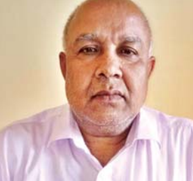
गोला, गोरखपुर। के आर मेमोरियल एकेडमी के भड़सरा व सुरदापार राजा स्थित विद्यालय के