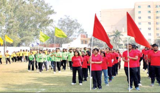
जिला संवाददाता (vol)