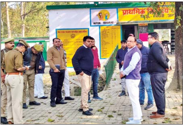
जिला संवाददाता (vol)