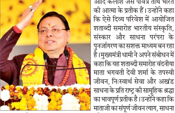
साधना और राष्ट्र चेतना का अनुपम संगम देखने को मिला। मुख्यमंत्री पुष्कर सिंह धामी ने देवभूमि उत्तराखण्ड की आध्यात्मिक परंपरा को स्मरण करते हुए कहा कि गंगोत्री, यमुनोत्री, केदारनाथ, बद्रीनाथ और आदि कैलाश जैसे पवित्र तीर्थ भारत की आत्मा के प्रतीक हैं। उन्होंने कहा कि ऐसे दिव्य परिवेश में आयोजित शताब्दी समारोह भारतीय संस्कृति, संस्कार और साधना परंपरा के पुनर्जागरण का सशक्त माध्यम बन रहा है। मुख्यमंत्री धामी ने अपने संबोधन में कहा कि यह शताब्दी समारोह वंदनीया माता भगवती देवी शर्मा के तपस्वी जीवन, निःस्वार्थ सेवा और अखंड साधना के प्रति राष्ट्र की सामूहिक श्रद्धा का भावपूर्ण प्रतीक है। उन्होंने कहा कि माताजी का संपूर्ण जीवन त्याग, साधना और मानव कल्याण की प्रेरक मिसाल रहा है। मुख्यमंत्री ने स्पष्ट किया कि गायत्री परिवार किसी एक संस्था की परिधि तक सीमित नहीं, बल्कि वह युग परिवर्तन की वह चेतना है, जो व्यक्ति निर्माण...शेष पृष्ठ 14 पर

हरिद्वार। साधना, सेवा और संस्कार को त्रिवेणी से अनुप्राणित शताब्दी ध्वज वंदन समारोह ने हरिद्वार को आध्यात्मिक ऊर्जा और सांस्कृतिक संकल्प की नई पहचान दी। अखिल विश्व गायत्री परिवार, शांतिकुंज के तत्वावधान में आयोजित इस भव्य आयोजन में मुख्यमंत्री पुष्कर सिंह धामी एवं केन्द्रीय संस्कृति एवं पर्यटन मंत्री गजेन्द्र सिंह शेखावत ने सहभागिता की। यह समारोह गायत्री परिवार की संस्थापिका वंदनीया माता भगवती देवी शर्मा जी एवं अखण्ड दीपक के शताब्दी वर्ष के शुभारंभ के अवसर पर आयोजित किया गया है, जो 23 जनवरी तक चलेगा। कार्यक्रम में श्रद्धा