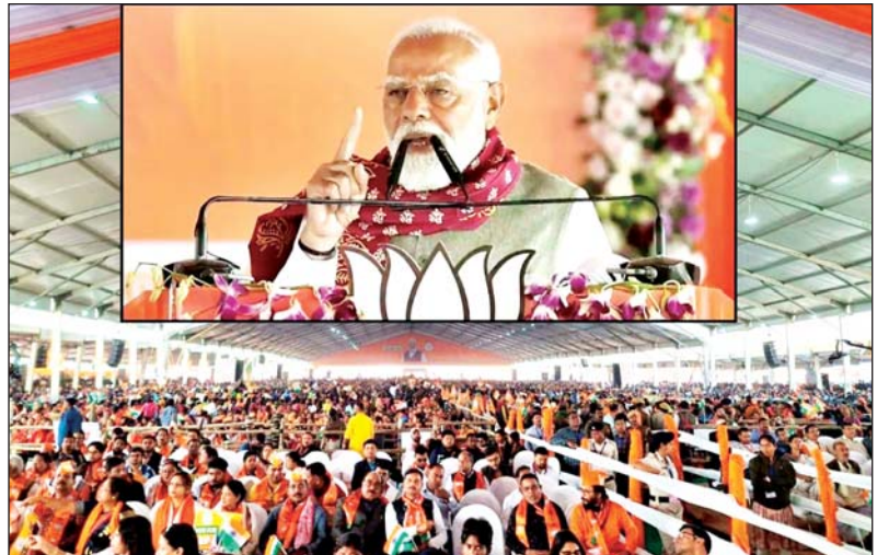
देशों में वापस भेजना होगा। मोदी ने आरोप लगाया, पिछले कई वर्षों से केंद्र सरकार सीमा पर बाड़ लगाने के लिए जमीन की मांग करते हुए तृणमूल सरकार को पत्र लिख रही है, लेकिन ...शेष पृष्ठ 14 पर

सिंगूर (पश्चिम बंगाल)। प्रधानमंत्री नरेन्द्र मोदी ने रविवार को तृणमूल कांग्रेस सरकार पर वोट बैंक की राजनीति के लिए घुसपैठियों की मदद करके राष्ट्रीय सुरक्षा से खिलवाड़ करने का आरोप लगाते हुए कहा कि विकास और सुशासन का मार्ग प्रशस्त करने के लिए पश्चिम बंगाल में पार्टी के महाजंगल राज को समाप्त करना जरूरी है। हुगली जिले के सिंगूर में एक रैली को संबोधित करते हुए मोदी ने आरोप लगाया कि राज्य सरकार सीमा पर बाड़ लगाने सहित महत्वपूर्ण सुरक्षा उपायों पर केंद्र के साथ सहयोग करने में विफल रही है।