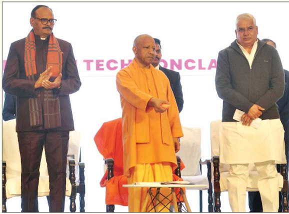
का भार इस प्रदेश पर पड़ता है। उन्होंने 2014 में देश में प्रधानमंत्री नरेन्द्र मोदी के नेतृत्व में सरकार बनने और 2017 में उत्तर प्रदेश में भाजपा की सरकार बनने के बाद स्वास्थ्य क्षेत्र में हुए बदलावों का दावा करते हुए कहा कि इस राज्य ने भारत सरकार के साथ मिलकर पिछले आठ-नौ वर्षों के अंदर स्वास्थ्य क्षेत्र में परिवर्तन करने में व्यापक सफलता...शेष पृष्ठ 14 पर

लखनऊ। उत्तर प्रदेश के मुख्यमंत्री योगी आदित्यनाथ ने रविवार को कहा कि स्वास्थ्य क्षेत्र का सबसे बड़ा उपभोक्ता बाजार उत्तर प्रदेश है। चिकित्सा प्रौद्योगिकी एवं स्वास्थ्य देखभाल पारिस्थितिकी तंत्र में निवेश, नवाचार और वैश्विक सहयोग के लिए यहां आयोजित तीन दिवसीय यूपी हेल्थ टेक कॉन्फ्लेक्स की शुरुआत करते हुए योगी आदित्यनाथ ने कहा, हमारे लिए यह सम्मेलन इसलिए महत्वपूर्ण है कि इस क्षेत्र का सबसे बड़ा उपभोक्ता बाजार उत्तर प्रदेश है। उन्होंने कहा कि उत्तर प्रदेश की आबादी 25 करोड़ है और उसके साथ ही अगल-बगल के राज्य तथा पड़ोसी देश नेपाल की भी स्वास्थ्य सुविधाओं