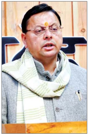
हम शिक्षा व्यवस्था को और अधिक आधुनिक, व्यावहारिक और सुव्यवस्थित बनाने के लिए भी कई स्तरों पर कार्य कर रहे हैं। मुख्यमंत्री ने कहा सरकार, शिक्षा व्यवस्था को

सीएम धामी ने रुड़की में आयोजित सम्मान समारोह को किया सम्बोधित प्रमुख संवाददाता रुड़की/देहरादून। शिक्षक, समाज की चेतना को दिशा देने वाला मार्गदर्शक होता है। जिस समाज में शिक्षक सुरक्षित, सम्मानित और संतुष्ट होता है। वहीं, समाज प्रगति के पथ पर आगे बढ़ते हुए उन्नति के शिखर को छूता है। यह विचार मुख्यमंत्री पुष्कर सिंह धामी ने रुड़की के कन्हैया लाल इंदेल्वी महाविद्यालय में आयोजित सम्मान समारोह कार्यक्रम को वर्चुअल माध्यम से संबोधित करते हुए व्यक्त किए। मुख्यमंत्री ने कहा कि प्रधानमंत्री नरेन्द्र मोदी के मार्गदर्शन में सरकार शिक्षकों और विद्यार्थियों के हितों को प्रमुखता देते हुए राज्य में शिक्षा के स्तर को बेहतर बनाने के लिए निरंतर कार्य कर रही है। केवल परीक्षा और डिग्री तक सीमित नहीं रखना चाहती, बल्कि उसे रिकल डेवलपमेंट से जोड़कर राज्य में रोजगार के साथ स्वरोजगार के क्षेत्र में भी युवाओं को आगे बढ़ाना चाहती है। सरकार ने देश में सबसे पहले नई शिक्षा नीति को लागू कर अपनी प्राथमिकताओं के बारे में स्पष्ट कर दिया है। नई शिक्षा नीति के तहत अब हमारे विश्वविद्यालयों में आर्टिफिशियल इंटेलिजेंस, मशीन लर्निंग और बिग डेटा जैसे कई नए कोर्स शुरू हो रहे हैं। मुख्यमंत्री ने कहा सरकार द्वारा राज्य में 20 मॉडल कॉलेजों की स्थापना की जा रही है। छात्र-छात्राओं की सुविधा के लिए महिला छात्रावास, आधुनिक आई.टी. लैब और नए परीक्षा भवनों का निर्माण किया जा रहा है। हमने ब्रिटेन के साथ ... शेष पृष्ठ 14 पर