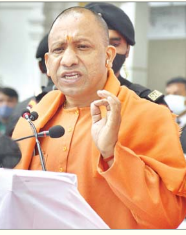
और व्यंजन केवल भोजन नहीं, बल्कि स्थानीय विरासत, कौशल और आर्थिकी का प्रतिनिधित्व करते हैं। इन्हें गुणवत्ता, पहचान और बाजार उपलब्ध कराकर प्रदेश की सांस्कृतिक ताकत को आर्थिक शक्ति में बदला जाएगा। मुख्यमंत्री योगी आदित्यनाथ ने निर्देश दिए कि ओडीओसी को ओडीओपी की तर्ज पर जमीनी स्तर पर लागू किया जाए, ताकि पारंपरिक कारीगरों, हलवाईयों और छोटे उद्यमियों को स्थायी आजीविका के अवसर मिलें। उन्होंने कहा कि गुणवत्ता, स्वच्छता और खाद्य सुरक्षा सर्वोच्च प्राथमिकता होगी और सभी उत्पादों को खाद्य सुरक्षा मानकों के अनुरूप प्रमाणित किया जाए। मुख्यमंत्री ने जीआई टैगिंग को प्रोत्साहित करने, स्थानीय व्यंजनों की पहचान सुरक्षित रखने और युवाओं व आधुनिक उपभोक्ताओं की पसंद के अनुसार स्वाद-आधारित विविधता विकसित करने पर भी बल दिया। मुख्यमंत्री ने कहा कि ओडीओसी के तहत प्रत्येक जनपद के विशिष्ट व्यंजनों की पहचान कर उन्हें व्यंजनी ... शेष पृष्ठ 14 पर

○ ओडीओपी की तर्ज पर जमीनी स्तर पर लागू होगी ओडीओसी ○ कारीगरों व हलवाईयों को मिलेगी स्थायी आजीविका विशेष संवाददाता लखनऊ। मुख्यमंत्री योगी आदित्यनाथ ने प्रदेश की समृद्ध और विविधतापूर्ण खान-पान परंपरा को वैश्विक पहचान दिलाने की दिशा में एक जनपद-एक व्यंजन (ओडीओसी) योजना के शुभारंभ का निर्णय लिया है। ब्रांड यूपी को सशक्त बनाने में एक जनपद-एक उत्पाद योजना की बड़ी भूमिका के बाद अब उत्तर प्रदेश की पारंपरिक व्यंजनों को संगठित ब्रांडिंग के माध्यम से राष्ट्रीय और अंतरराष्ट्रीय मंच पर स्थापित किया जाएगा। मुख्यमंत्री ने कहा कि प्रदेश का हर जनपद अपने विशिष्ट स्वाद, संस्कृति और पहचान के साथ सामने आए, यही ओडीओसी योजना का मूल उद्देश्य है। मुख्यमंत्री ने उदाहरण देते हुए कहा कि मैनपुरी की सोनपापड़ी, मथुरा का पेड़ा, अलीगढ़ की चमचम, हाथरस की रबड़ी, कासगंज का कलाकंद और मूंग का दलमा, एटा की चिकोरी, सुल्तानपुर की कड़ाहा की पूरी और कोहड़े की सब्जी, बाराबंकी की चंद्रकला मिठाई, आजमगढ़ का सफेद गाजर का हलवा, वाराणसी की लौंगलता, बरेली की सिंवइयां, अमेठी का समोसा, बस्ती का सिरका और सिद्धार्थनगर की रामकटोरी जैसी पारंपरिक मिठाइयों को चंद्रकला मिठाई, आजमगढ़ का सफेद गाजर का हलवा, वाराणसी की लौंगलता, बरेली की सिंवइयां, अमेठी का समोसा, बस्ती का सिरका और सिद्धार्थनगर की रामकटोरी जैसी पारंपरिक मिठाइयों