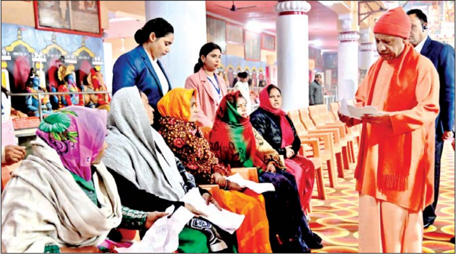
सख्त कार्रवाई करें। गोरखनाथ मंदिर के महंत दिग्विजयनाथ स्मृति भवन

गोरखपुर। लगातार दो दिन मकर संक्रांति/खिचड़ी महापर्व को लेकर श्रद्धालुओं की सुरक्षा, सुविधाओं के प्रबंधन तथा निगरानी में व्यस्त रहे मुख्यमंत्री योगी आदित्यनाथ ने शुक्रवार को जनता दर्शन का आयोजन किया। गोरखनाथ मंदिर में मुख्यमंत्री ने लोगों से मुलाकात कर उनकी समस्याएं सुनीं और शीघ्रता से निस्तारण के लिए अधिकारियों को निर्देशित किया। जनता दर्शन में भूमि पट्टा आवंटन से जुड़ी कतिपय शिकायतों पर गंभीर दिखे मुख्यमंत्री ने अधिकारियों को निर्देश दिया कि जिस भी गांव में रुपया लेकर पट्टा आवंटन की शिकायत हो, वहां तत्काल जांच कर दोषी के विरुद्ध