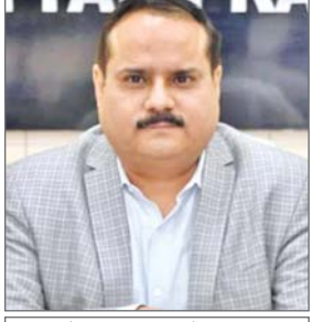
○ विशेष अभियान में हर मतदान केंद्र पर बनेगी हेल्प डेस्क, फार्म भरने में मिलेगी सहायता तिथि जिला निर्वाचन अधिकारियों द्वारा जिला स्तर पर सुविधागुप्तार निर्धारित की जाएगी। मुख्य निर्वाचन अधिकारी ने बताया कि विशेष अभियान तिथियों के दौरान प्रदेश ... शेष पृष्ठ 14 पर