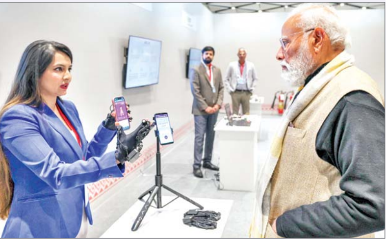
का तीसरा सबसे बड़ा स्टार्टअप परिवेश बन गया है। प्रधानमंत्री ने कहा कि जोखिम लेने की प्रवृत्ति को पहले हतोत्साहित किया जाता था लेकिन अब वह मुख्यधारा में आ गई है और स्टार्टअप रोजगार सृजन, नवाचार और वैश्विक प्रतिस्पर्धा को बढ़ावा दे रहे हैं। उन्होंने स्टार्टअप संस्थापकों ... शेष पृष्ठ 14 पर

पीएम मोदी ने स्टार्टअप इंडिया पहल की 10वीं वर्षगांठ पर आयोजित कार्यक्रम को किया संबोधित एजेसी नयी दिल्ली। प्रधानमंत्री नरेन्द्र मोदी ने शुक्रवार को भारतीय स्टार्टअप से विनिर्माण, गहन प्रौद्योगिकी और वैश्विक नेतृत्व पर अधिक ध्यान देने का आह्वान करते हुए कहा कि स्टार्टअप इंडिया का अगल दशक भारत को नवाचार के वैश्विक अग्रणी देशों की पंक्ति में खड़ा करने वाला होना चाहिए। प्रधानमंत्री मोदी ने स्टार्टअप इंडिया पहल की 10वीं वर्षगांठ पर भारत मंडप में आयोजित कार्यक्रम को संबोधित करते हुए कहा कि स्टार्टअप भारत के आर्थिक और प्रौद्योगिकी भविष्य को आकार देने में अहम भूमिका निभा रहे हैं। उन्होंने स्टार्टअप इंडिया पहल को एक क्रांति करार देते हुए कहा कि 2014 में जहां देश में 500 से भी कम स्टार्टअप थे, वहीं आज यह संख्या दो लाख से अधिक हो चुकी है। इनमें से करीब 125 स्टार्टअप एक अरब डॉलर या उससे अधिक मूल्यांकन के साथ यूनिคอร์न दर्जा हासिल कर चुके हैं। मोदी ने कहा कि इसके साथ ही भारत विश्व