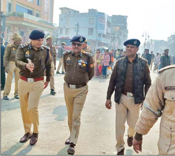
सीसीटीवी निगरानी, पुलिस बल की तैनाती सहित भीड़ नियंत्रण की व्यवस्थाओं का जायजा लिया। अधिकारियों ने मौके पर मौजूद