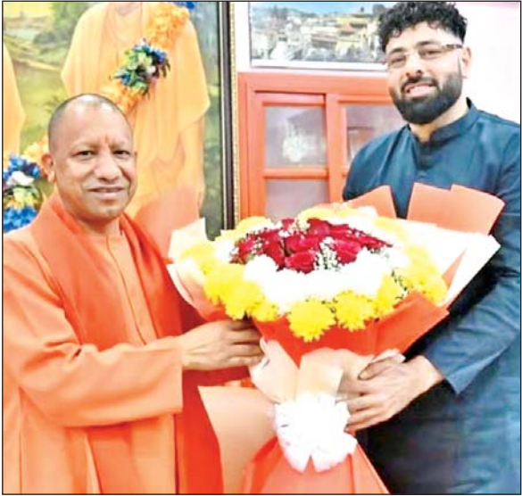
गोरखपुर। बॉलीवुड के मशहूर गायक बादशाह ने मंगलवार देर शाम गोरखनाथ मंदिर में महायोगी गुरु गोरखनाथ

का दर्शन पूजन किया। उन्होंने मंदिर के बैठक कक्ष में गोरक्षपीठाधीश्वर एवं मुख्यमंत्री योगी आदित्यनाथ से शिष्टाचार भेंट भी की। गोरखपुर महोत्सव के औपचारिक समापन समारोह के दिन मंगलवार को बॉलीवुड नाइट में अपनी गायन कला का प्रदर्शन करने आए गायक बादशाह ने मंचीय प्रस्तुति देने से पूर्व गोरखनाथ मंदिर पहुंचकर शिवावतार गुरु गोरखनाथ के दरबार में मत्था टेका। विधि विधान से दर्शन पूजन करने के बाद उन्होंने मुख्यमंत्री योगी आदित्यनाथ से शिष्टाचार भेंट की। इस अवसर पर मंदिर का प्रसाद ग्रहण करने के बाद वह विदा हुए।