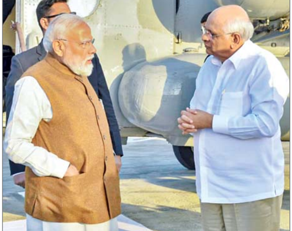
सड़क के दोनों तरफ बड़ी संख्या में स्थानीय और बाहरी श्रद्धालु मोदी का स्वागत करने के लिए जमा हुए थे। मोदी सोमनाथ स्वामिमान पर्व के तहत देर शाम सोमनाथ मंदिर में उ्कारमंत्र के जाप में भाग लेंगे। यह कार्यक्रम मंदिर

एजेंसी वेरावल। प्रधानमंत्री नरेन्द्र मोदी शनिवार को अपने तीन-दिवसीय गुजरात दौरे के तहत सोमनाथ पहुंचे और इस दौरान वह यहाँ सोमनाथ स्वामिमान पर्व एवं राजकोट में वाइब्रेंट गुजरात क्षेत्रीय सम्मेलन सहित कई कार्यक्रमों में भाग लेंगे। राज्य सरकार द्वारा जारी एक विज्ञापित के अनुसार, प्रधानमंत्री मोदी का गुजरात के मुख्यमंत्री भूपेंद्र पटेल और अन्य गणमान्य व्यक्तियों ने गिर सोमनाथ जिले के वेरावल कस्बे के पास स्थित प्रसिद्ध सोमनाथ महादेव मंदिर के पास हेलीपैड पर गर्मजोशी से स्वागत किया। हेलीपैड से मोदी अपने कार्टिले के साथ मंदिर के पास स्थित वीवीआईपी सर्किट हाउस पहुंचे।