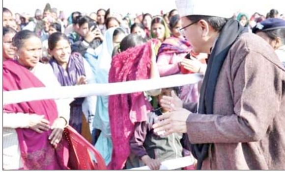
देहरादून। लोक उत्सवों के जरिये नई पीढ़ी को अपनी सांस्कृतिक जड़ों से जोड़ने का संकल्प दोहराते हुए मुख्यमंत्री पुष्कर सिंह धामी थौलधार के सांस्कृतिक महोत्सव में शामिल हुए। मुख्यमंत्री धामी ने आज राजकीय इंटर कॉलेज छाम, टिहरी गढ़वाल में सांस्कृतिक विकास समिति द्वारा आयोजित प्रथम खेलकूद एवं सांस्कृतिक महोत्सव के समापन समारोह को संबोधित करते हुए कहा कि भगवान नागराजा की पवित्र भूमि को नमन करते हुए कहा कि ऐसे आयोजन हमारी लोक-संस्कृति एवं परंपराओं के संरक्षण और नई पीढ़ी को उनसे जोड़ने में महत्वपूर्ण भूमिका निभाते हैं।

पर 1000 वर्ष पहले हुए आक्रमण की पृष्ठभूमि में आयोजित किया जा रहा है। ये स्वामिमान पर्व आठ जनवरी को शुरू हुए और 11 जनवरी को समाप्त होंगे। विज्ञापित में कहा गया है, बाद में वह मंदिर परिसर में ड्रोन शो देखेंगे। मंदिर से जुड़ी ऐतिहासिक घटनाओं को दर्शाने के लिए लगभग 3,000 ड्रोन का इस्तेमाल किया जाएगा। इसके बाद प्रधानमंत्री मोदी श्री सोमनाथ ट्रस्ट के अध्यक्ष के रूप में उसकी बैठक की अध्यक्षता करेंगे। पत्र सूचना कार्यालय (पीआईबी) द्वारा जारी एक विज्ञापित के अनुसार, रविवार को सुबह लगभग 9-45 बजे प्रधानमंत्री शौर्य यात्रा में भाग लेंगे, जो सोमनाथ मंदिर की रक्षा करते हुए प्राणों की आहुति देने वालों को श्रद्धांजलि अर्पित करने के लिए ...शेष पृष्ठ 14 पर