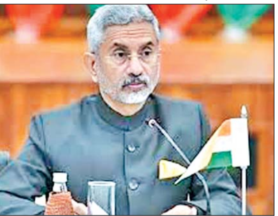
गलत समझने से रोकने का तरीका है संवाद करना। अगर आप अच्छी तरह, स्पष्ट रूप से और ईमानदारी से संवाद करते हैं, तो अन्य देश और अन्य लोग इसका सम्मान करते हैं और इसे स्वीकार करते हैं। जयशंकर ने कहा कि दुनिया भर में बहुत से लोग अपनी संस्कृति, परंपरा और

भारत की प्रगति इस क्षेत्र के लिए एक सकारात्मक लहर है और हमारे अधिकांश पड़ोसी मानते हैं कि भारत की प्रगति से उनका भी विकास होता है। लेकिन जब आतंकवाद फैलाने वाले बुरे पड़ोसियों की बात आती है, तो भारत को अपने लोगों की रक्षा करने का पूरा अधिकार है और वह हर संभव कदम उठाएगा। आप हमारे देश में आतंकवाद फैलाना जारी रखते हुए हमसे पानी साझा करने का अनुरोध नहीं कर सकते। विदेश मंत्री ने कहा कि ऐसी स्थिति से बचने के लिए अन्य देशों के साथ संवाद करना जरूरी है, जिसमें भारत के इरादों को गलत तरीके से समझा जाए। उन्होंने कहा कि लोगों को आपको