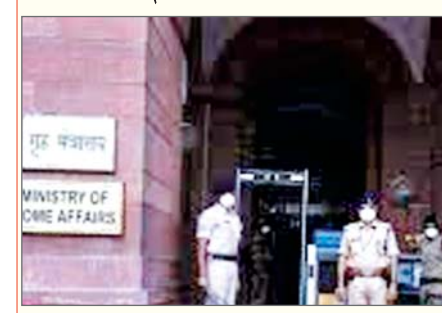
लेह/जम्मू। केंद्रीय गृह मंत्रालय ने वित्तीय शक्तियों के प्रत्यायोजन नियम (डीएफपीआरएस) के तहत 100 करोड़ रुपये तक की लागत वाली परियोजनाओं के मूल्यांकन और स्वीकृति के लिए लद्दाख के उपराज्यपाल को प्रत्यायोजित शक्तियों को बहाल कर दिया। एक आधिकारिक आदेश में गृह मंत्रालय ने कहा है कि मंत्रालय ने डीएफपीआरएस, 2024 के तहत 100 करोड़ रुपये तक की परियोजनाओं के मूल्यांकन और स्वीकृति के लिए बिना विधानमंडल वाले केंद्र शासित प्रदेशों के प्रशासकों और उपराज्यपालों को शक्तियों के प्रत्यायोजन (डेलिगेशन) को मंजूरी दे दी है, जिनमें

लद्दाख भी शामिल है। भारत सरकार के गृह मंत्रालय में उप सचिव लेंदुप शेरपा द्वारा जारी आदेश में कहा गया है, मुझे यह सूचित करने का निर्देश दिया गया है कि सक्षम प्राधिकारी ने डीएफपीआरएस, 2024 के तहत 100 करोड़ रुपये तक की परियोजनाओं के मूल्यांकन और स्वीकृति के लिए लद्दाख, अंडमान एवं निकोबार द्वीपसमूह, चंडीगढ़, दादरा एवं नगर हवेली तथा दमन एवं दीव और लक्षद्वीप के केंद्र शासित प्रदेशों के प्रशासकों एवं उपराज्यपालों को शक्तियों के प्रत्यायोजन को (कुछ शर्तों के अधीन) स्वीकृति प्रदान कर दी है। यह आदेश ऐसे समय में आया है, जब लगभग एक महीने पहले गृह मंत्रालय ने लद्दाख के उपराज्यपाल की 100 करोड़ रुपये तक की योजनाओं और परियोजनाओं को मंजूरी देने की पूर्व में प्रत्यायोजित शक्तियों को, साथ ही प्रशासनिक सचिवों की 20 करोड़ रुपये तक की परियोजनाओं को स्वीकृति देने की शक्तियों को वापस ले लिया था। नये आदेश के अनुसार, ये शक्तियां उपराज्यपाल द्वारा संबंधित केंद्र शासित प्रदेश के वित्त सचिव अथवा समकक्ष वित्तीय सहायक से परामर्श करके तथा पर्याप्त बजटीय प्रावधानों की उपलब्धता के अधीन प्रयोग की जाएंगी।