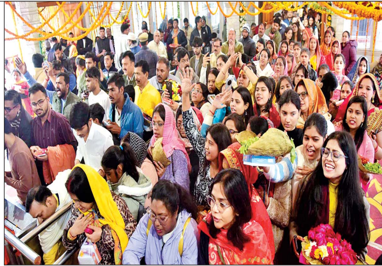
मंदिरों में उमडा भक्तों का हुजूम