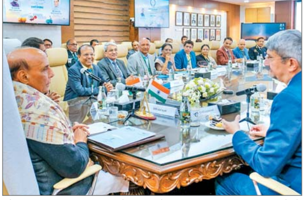
केरगा। मिशन सुदर्शन चक्र की घोषणा प्रधानमंत्री नरेन्द्र मोदी ने 2025 में लाल किले की प्राचीर से स्वतंत्रता दिवस के अपने भाषण में की थी। सिंह ने एक बैठक के दौरान कहा, इस पहल के तहत, डीआरडीओ को अगले दशक में पूर्ण हवाई सुरक्षा सुनिश्चित करने के लिए हमारी महत्वपूर्ण सैन्य प्रतिष्ठानों को वायु रक्षा प्रणाली से लैस करने का दायित्व सौंपा गया है। ऑपरेशन सिंदूर के दौरान हमने आधुनिक युद्ध में वायु रक्षा के महत्व ...शेष पृष्ठ 14 पर

नयी दिल्ली। रक्षामंत्री राजनाथ सिंह ने बृहस्पतिवार को कहा कि रक्षा अनुसंधान एवं विकास संगठन (डीआरडीओ) द्वारा विकसित हथियार प्रणालियों ने ऑपरेशन सिंदूर के दौरान निर्णायक भूमिका निभाई और यह राष्ट्रीय हितों की रक्षा के प्रति संगठन की व्यावसायिकता और प्रतिबद्धता का प्रमाण है। रक्षामंत्री ने डीआरडीओ की 68वीं वर्षगांठ के अवसर पर संगठन के मुख्यालय का दौरा किया। उन्होंने इस अवसर पर कहा कि संगठन सुदर्शन चक्र के निर्माण में महत्वपूर्ण भूमिका निभाएगा, और विश्वास व्यक्त किया कि यह इस लक्ष्य की जल्द से जल्द प्राप्त करने के लिए पूरी लगन से काम