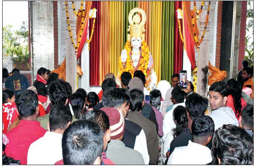
साल के पहले दिन हनुमान सेतु मंदिर में दर्शन करते श्रद्धालु