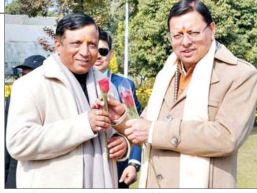
उत्तराखंड के विकास पथ पर एक महत्वपूर्ण मील का पत्थर सिद्ध होगा। उन्होंने स्पष्ट किया कि राज्य सरकार सुशासन, जनकल्याण व आत्मनिर्भर उत्तराखंड के लक्ष्य को केंद्र में रखकर अपनी नीतियों और कार्यक्रमों को और अधिक प्रभावी बनाएगी। प्रधानमंत्री नरेन्द्र मोदी के मार्गदर्शन में राज्य सरकार प्रदेश के समग्र और संतुलित विकास के लिए पूरी निष्ठा से कार्य कर रही है। मुख्यमंत्री धामी ने कहा कि ...शेष पृष्ठ 14 पर

प्रमुख संवाददाता देहरादून। उत्तराखंड को देश के अग्रणी राज्यों की कतार में खड़ा करने के संकल्प के साथ मुख्यमंत्री पुष्कर सिंह धामी ने नववर्ष 2026 को विकास और आत्मनिर्भरता का नया अध्याय बताया। नववर्ष 2026 के पहले ही दिन मुख्यमंत्री आवास में शासन, प्रशासन व जनप्रतिनिधियों का शुभकामनाओं का सिलसिला देखने को मिला। आज धामी से नववर्ष 2026 के अवसर पर शुभकामनाएं देने हेतु सभी वर्गों के लोग भारी संख्या में उमड़े। मंत्रियों, सांसद, विधायकों, जनप्रतिनिधियों, वरिष्ठ प्रशासनिक एवं पुलिस अधिकारियों, सूचना विभाग के अधिकारियों के अलावा विभिन्न सामाजिक और सरकारी संगठनों के प्रतिनिधियों ने सीएम धामी से शिष्टाचार भेंट कर उन्हें नए वर्ष की शुभकामनाएं दीं। मुख्यमंत्री ने कहा कि वर्ष 2026 उत्तराखंड के विकास पथ पर एक महत्वपूर्ण मील का पत्थर सिद्ध होगा। उन्होंने स्पष्ट किया कि राज्य सरकार सुशासन, जनकल्याण व आत्मनिर्भर उत्तराखंड के लक्ष्य को केंद्र में रखकर अपनी नीतियों और कार्यक्रमों को और अधिक प्रभावी बनाएगी। प्रधानमंत्री नरेन्द्र मोदी के मार्गदर्शन में राज्य सरकार प्रदेश के समग्र और संतुलित विकास के लिए पूरी निष्ठा से कार्य कर रही है। मुख्यमंत्री धामी ने कहा कि ...शेष पृष्ठ 14 पर