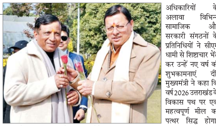
मुख्यमंत्री पुष्कर सिंह धामी ने नववर्ष 2026 को विकास और आत्मनिर्भरता का नया अध्याय बताया।

प्रमुख संवाददाता देहरादून। उत्तराखंड को देश के अग्रणी राज्यों की कतार में खड़ा करने के संकल्प के साथ मुख्यमंत्री पुष्कर सिंह धामी ने नववर्ष 2026 को विकास और आत्मनिर्भरता का नया अध्याय बताया। नववर्ष 2026 के पहले ही दिन शासन, प्रशासन व जनप्रतिनिधियों का शुभकामनाओं का सिलसिला देखने को मिला। आज धामी से नववर्ष 2026 के अवसर पर शुभकामनाएं देने हेतु सभी वर्गों के लोग भारी संख्या में उमड़े। मंत्रियों, सांसद, विधायकों, जनप्रतिनिधियों, वरिष्ठ प्रशासनिक एवं पुलिस अधिकारियों, सूचना विभाग के अधिकारियों के अलावा विभिन्न सामाजिक और सरकारी संगठनों के प्रतिनिधियों ने सीएम धामी से शिष्टाचार भेंट कर उन्हें नए वर्ष की शुभकामनाएं दीं। मुख्यमंत्री ने कहा कि वर्ष 2026 उत्तराखंड के विकास पथ पर एक महत्वपूर्ण मील का पत्थर सिद्ध होगा। उन्होंने स्पष्ट किया कि राज्य सरकार सुशासन, जनकल्याण व आत्मनिर्भर उत्तराखंड के लक्ष्य को केंद्र में रखकर अपनी नीतियों और कार्यक्रमों को और अधिक प्रभावी बनाएगी। प्रधानमंत्री नरेन्द्र मोदी के मार्गदर्शन में राज्य सरकार प्रदेश के समग्र और संतुलित विकास के लिए पूरी निष्ठा से कार्य कर रही है। मुख्यमंत्री धामी ने कहा कि ...शेष पृष्ठ 14 पर