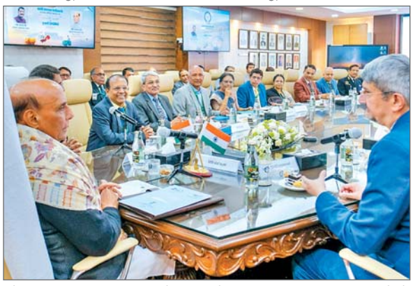
राजनाथ सिंह ने डीआरडीओ की 68वीं वर्षगांठ के अवसर पर संगठन के मुख्यालय का दौरा किया।

एजेंसी नयी दिल्ली। रक्षामंत्री राजनाथ सिंह ने बृहस्पतिवार को कहा कि रक्षा अनुसंधान एवं विकास संगठन (डीआरडीओ) द्वारा विकसित हथियार प्रणालियों ने ऑपरेशन सिंदूर के दौरान निर्णायक भूमिका निभाई और यह राष्ट्रीय हितों की रक्षा के प्रति संगठन की व्यावसायिकता और प्रतिबद्धता का प्रमाण है। रक्षामंत्री ने डीआरडीओ की 68वीं वर्षगांठ के अवसर पर संगठन के मुख्यालय का दौरा किया। उन्होंने इस अवसर पर कहा कि संगठन सुदर्शन चक्र के निर्माण में महत्वपूर्ण भूमिका निभाएगा, और विश्वास व्यक्त किया कि यह इस लक्ष्य की जल्द से जल्द प्राप्त करने के लिए पूरी लगन से काम करेगा। मिशन सुदर्शन चक्र की घोषणा प्रधानमंत्री नरेन्द्र मोदी ने 2025 में लाल किले की प्राचीर से स्वतंत्रता दिवस के अपने भाषण में की थी। सिंह ने एक बैठक के दौरान कहा, इस पहलू के तहत, डीआरडीओ को अगले दशक में पूर्ण हवाई सुरक्षा सुनिश्चित करने के लिए हमारी महत्वपूर्ण सैन्य प्रतिष्ठानों को वायु रक्षा प्रणाली से लैस करने का दायित्व सौंपा गया है। ऑपरेशन सिंदूर के दौरान हमने आधुनिक युद्ध में वायु रक्षा के महत्व ...शेष पृष्ठ 14 पर