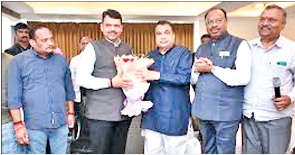
अर्थव्यवस्था बनाना। अगर हम पांच हजार अरब डॉलर की अर्थव्यवस्था और तीसरी सबसे बड़ी अर्थव्यवस्था बनाना चाहते हैं, तो ज्ञान सबसे शक्तिशाली उपकरण होगा। गडकरी ने कहा कि

पुणे। केंद्रीय मंत्री नितिन गडकरी ने सोमवार को कहा कि भारत को पांच हजार अरब डॉलर की अर्थव्यवस्था और विश्व की तीसरी सबसे बड़ी अर्थव्यवस्था बनाने के लिए ज्ञान सबसे शक्तिशाली उपकरण है। भारतीय प्रौद्योगिकी संस्थान, मुंबई में आयोजित एक कार्यक्रम में उन्होंने कहा कि किसी भी देश का भविष्य उसके पास मौजूद भविष्योन्मुखी प्रौद्योगिकी पर आधारित होता है। केंद्रीय सड़क परिवहन और राजमार्ग मंत्री ने कहा, देश के विकास और प्रगति में भारतीय प्रौद्योगिकी संस्थान (आईआईटी) और उसके छात्रों का बहुत बड़ा योगदान रहा है। सरकार में काम करते समय अगर हमें कोई चुनौती आती है, तो हम सबसे पहले आईआईटी से सलाह लेते हैं। आईआईटी की विश्वसनीयता इतनी अच्छी है कि हमें जो समाधान मिलता है, वह व्यापक रूप से स्वीकार्य होता है। संक्षेप में कहें तो आप ज्ञान की राजधानी हैं। गडकरी ने कहा कि देश की प्रगति, संसाधन और प्रौद्योगिकी महत्वपूर्ण हैं लेकिन इससे भी अधिक महत्वपूर्ण भविष्य की प्रौद्योगिकी और ज्ञान है। किसी भी देश का भविष्य इस बात पर निर्भर करता है कि उसके पास किस प्रकार की भविष्योन्मुखी प्रौद्योगिकी है। उन्होंने कहा कि प्रधानमंत्री नरेन्द्र मोदी ने एक मिशन के रूप में लक्ष्य निर्धारित किया है और वह है भारत को पांच हजार अरब डॉलर की अर्थव्यवस्था और दुनिया की तीसरी सबसे बड़ी