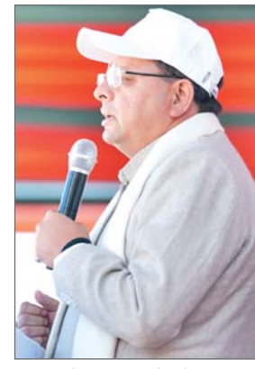
उत्कृष्ट खेल प्रशिक्षकों को सम्मानित कर उनका उत्साहवर्धन किया। मुख्यमंत्री धामी ने कहा कि भारत की युवा शक्ति देश की सबसे बड़ी पूंजी है, जो अपने परिश्रम, प्रतिभा और संकल्प से विकसित और आत्मनिर्भर

उत्तराखंड सरकार शीघ्र ही लागू करेगी 'स्पोर्ट्स लेगेसी प्लान' : सीएम प्रमुख संवाददाता अल्मोड़ा (उत्तराखंड)। उत्तराखंड सरकार शीघ्र ही एक व्यापक स्पोर्ट्स लेगेसी प्लान लागू करने जा रही है, जिसके तहत प्रदेश के आठ प्रमुख शहरों में 23 खेल अकादमियों की स्थापना की जाएगी। हल्द्वानी में उत्तराखंड का पहला खेल विश्वविद्यालय और लोहाघाट में महिला स्पोर्ट्स कॉलेज की स्थापना की जा रही है। उपरोक्त जानकारी मुख्यमंत्री पुष्कर सिंह धामी ने अल्मोड़ा में आयोजित सांसद खेल महोत्सव के शुभारंभ समारोह को संबोधित करते हुए प्रदान की। मुख्यमंत्री ने फुटबॉल एवं बैडमिंटन प्रतियोगिताओं का उद्घाटन किया तथा अंतरराष्ट्रीय क्रिकेट खिलाड़ी एकता बिष्ट सहित