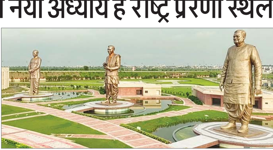
चल रही है। राष्ट्र प्रेरणा स्थल राजधानी लखनऊ की सुंदरता में एक नया अध्याय जुड़ जायेगा। इससे जहां एक तरफ लोगों को अटलजी के बताये मार्ग पर चलने की प्रेरणा मिलेगी तो वहीं दूसरी ओर राजधानी लखनऊ की सुंदरता और भी निखर जायेगी। राजधानी लखनऊ में सुरक्षा का पुख्ता इंतजाम किया गया है। चपे-चपे पर पुलिस का पहरा है और सीसी