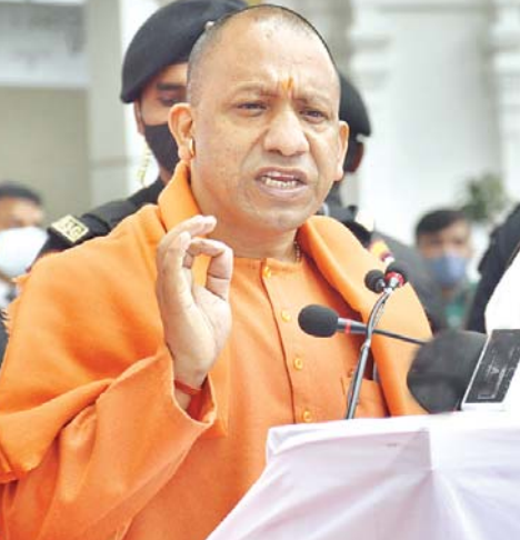
लखनऊ, गौतमबुद्ध नगर और गाजियाबाद में 8 कामकाजी महिला हॉस्टल बनेंगे। भूमि एक रुपया सालाना लीज पर दी जाएगी। आंगनवाड़ी में बच्चों को रीसिपी आधारित पौष्टिक भोजन मिलेगा। राष्ट्रीय ग्रामीण स्वास्थ्य मिशन (एनआरएचएम) के तहत संचालित विभिन्न योजनाओं के बेहतर कार्यान्वयन के लिए 2,000 करोड़ रुपये की अतिरिक्त व्यवस्था की गई है। इस राशि से ग्रामीण क्षेत्रों में प्राथमिक स्वास्थ्य केंद्रों, सामुदायिक स्वास्थ्य केंद्रों व जिला अस्पतालों की सेवाओं को और सशक्त किया ...शेष पृष्ठ 14 पर

विशेष संवाददाता लखनऊ। उत्तर प्रदेश कैबिनेट ने सोमवार को मुख्यमंत्री योगी आदित्यनाथ की अध्यक्षता में कई महत्वपूर्ण फैसले लिए। कैबिनेट बैठक में शिक्षा, स्वास्थ्य, इंफ्रास्ट्रक्चर, कृषि और महिलाओं-बच्चों के कल्याण से जुड़े 25 से ज्यादा प्रस्तावों को हरी झंडी दी गई। लखनऊ के बसंतकुंज स्थित राष्ट्र प्रेरणा स्थल के संचालन, सुरक्षा और रखरखाव के लिए अलग समिति बनेगी। इसके लिए कॉर्पस फंड भी बनाया जाएगा, जिससे हर साल खर्च की व्यवस्था होती रहे। कैबिनेट बैठक में वित्तीय वर्ष 2025-26 के लिए करीब 25 हजार करोड़ रुपये का अनुपूरक बजट भी मंजूर किया गया। इसके अलावा शिक्षा, स्वास्थ्य, इंफ्रास्ट्रक्चर, कृषि और शहरी विकास से जुड़े दर्जनों प्रस्तावों पर मुहर लगी। कैबिनेट की बैठक में 15 हजार 189.7 करोड़ के निवेश प्रस्तावों को मंजूरी दी गई। इसके तहत मिजापुर, हरदोई, बुलंदशहर, रायबरेली, गौतमबुद्धनगर, सोनभद्र, मेरठ, मुजफ्फरनगर, अलीगढ़ में मेगा एवं सुपर मेगा श्रेणी की 12 औद्योगिक इकाइयों को लेटर ऑफ कम्प्ट (एलओसी) जारी किया जाएगा। कैबिनेट ने दो नए विश्वविद्यालय बनाने का फैसला किया है। भदोही के काशी नरेश राजकीय स्नातकोत्तर महाविद्यालय को काशी नरेश विश्वविद्यालय