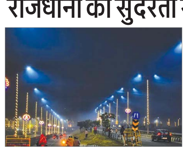
विशेष संवाददाता लखनऊ। राजधानी लखनऊ के बसंतकुंज योजना में बने कमल के आकार वाले राष्ट्र प्रेरणा स्थल की