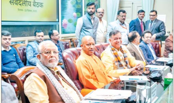
सर्वदलीय बैठक में विधान सभा के सदस्यों का एक दृश्य।