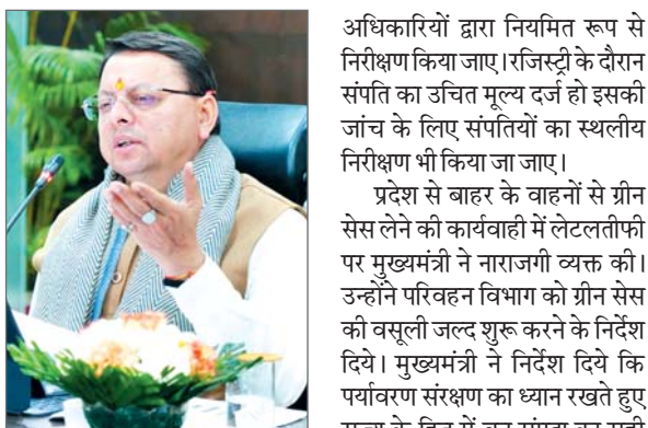
मुख्यमंत्री धामी ने राज्य सरकार के नौकरशाहों और अधिकारियों के लिए माननीय शब्द के इस्तेमाल पर कड़ी आपत्ति व्यक्त करते हुए प्रमुख सचिव (राजस्व) को हलकनामा दाखिल कर

प्रमुख संवाददाता देहरादून (उत्तराखंड)। मुख्यमंत्री पुष्कर सिंह धामी ने कहा कि राज्य के समग्र विकास के लिए राजस्व में बढ़ोतरी करना सरकार की सर्वोच्च प्राथमिकता है। अतः अब कर चोरी पर प्रभावी नियंत्रण के लिए एआई आधारित तकनीक का अधिकतम इस्तेमाल किया जाएगा। मुख्यमंत्री धामी सचिवालय में वित्तीय वर्ष 2025-26 की राजस्व प्राप्ति की स्थिति की समीक्षा बैठक को सम्बोधित कर रहे थे। मुख्यमंत्री ने अधिकारियों को निर्देश दिये कि राजस्व वसूली बढ़ाने पर विशेष ध्यान देते हुए तय लक्ष्य समय पर पूरे किये जाएं। संबोधित विभागों के उच्चाधिकारी एवं जिलाधिकारियों द्वारा जनपदों में इसकी नियमित निगरानी की जाए। उन्होंने कहा कि निबंधन एवं रजिस्ट्रेशन से संबंधित सभी कार्यों का डिजिटल इजेशन किया जाए। सब रजिस्ट्रार कार्यालयों का जिलाधिकारियों एवं संबंधित वरिष्ठ अधिकारियों द्वारा नियमित रूप से निरीक्षण किया जाए। रजिस्ट्री के दौरान संपत्ति का उचित मूल्य दर्ज हो इसकी जांच के लिए संपत्तियों का स्थलीय निरीक्षण भी किया जा जाए। प्रदेश से ग्रीन सेस लेने की कार्यवाही में लेटलतीफी पर मुख्यमंत्री ने नाराजगी व्यक्त की। उन्होंने परिवहन विभाग को ग्रीन सेस की वसूली जल्द शुरू करने के निर्देश दिये। मुख्यमंत्री ने निर्देश दिये कि पर्यावरण संरक्षण का ध्यान रखते हुए राज्य के हित में वन संपदा का सही उपयोग किया जाए। तराई क्षेत्रों में कर्मशिलय प्लांटेशन तथा जडी-बूटियों के क्षेत्र में बेहतर कार्य करने के लिए टोस योजना बनाई जाए। मुख्यमंत्री ने कहा कि राज्य के समग्र विकास के ...शेष पृष्ठ 14 पर