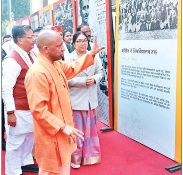
मुख्यमंत्री योगी आदित्यनाथ ने भातखण्डे संस्कृति विश्वविद्यालय के शताब्दी महोत्सव के शुभारंभ पर शुभकामनाएं देते हुए

विशेष संवाददाता लखनऊ। मुख्यमंत्री योगी आदित्यनाथ ने इस बात पर बल दिया कि राष्ट्र की आत्मा उसकी संस्कृति में होती है। उन्होंने कहा कि जैसे किसी मनुष्य की आत्मा उसके शरीर से संबंध तोड़ देती है तो शरीर निस्तेज हो जाता है, उसी प्रकार राष्ट्र के जीवन में भी होता है। किसी भी राष्ट्र की संस्कृति को उससे अलग कर दिया जाए तो राष्ट्र निस्तेज हो जाता है। वह खंडहर में परिवर्तित हो जाता है और अपनी पहचान को खो देता है। मुख्यमंत्री योगी आदित्यनाथ ने गुरुवार को भातखण्डे संस्कृति विश्वविद्यालय के शताब्दी वर्ष समारोह के शुभारंभ कार्यक्रम में कहा कि यह अवसर हमारे लिए बहुत महत्वपूर्ण है। उनके अनुसार, भारत की कला, स्वर व लय ने अपनी पहचान को विश्व परिस्थितियों का सामना करते हुए जो निरंतरता दी उसी के बदौलत हमारी सनातन संस्कृति भी विधा से जुड़ा हो, उसे प्रोत्साहित करना चाहिए। मुख्यमंत्री योगी आदित्यनाथ ने भातखण्डे संस्कृति विश्वविद्यालय के शताब्दी महोत्सव के शुभारंभ पर शुभकामनाएं देते हुए