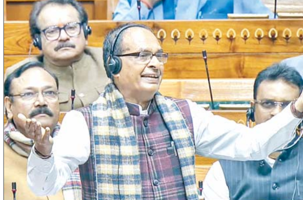
मुख्यमंत्री धामी ने राज्य सरकार के नौकरशाहों और अधिकारियों के लिए माननीय शब्द के इस्तेमाल पर कड़ी आपत्ति व्यक्त करते हुए प्रमुख सचिव (राजस्व) को हलकनामा दाखिल कर