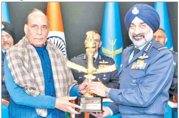
रक्षामंत्री राजनाथ सिंह ने वायुसेना के शीर्ष कमांडरों को संबोधित करते हुए

एजेंसी नयी दिल्ली। रक्षामंत्री राजनाथ सिंह ने बृहस्पतिवार को कहा कि ऑपरेशन सिंदूर ने भारत की उच्च-प्रभाव वाली सैन्य क्षमता का प्रदर्शन किया और पाकिस्तान स्थित कई आतंकी ठिकानों पर हमले के बाद पड़ोसी देश की गैर जिम्मेदाराना प्रतिक्रिया से निपटने के लिए भारतीय वायुसेना की सराहना की। सिंह ने भारतीय वायुसेना के शीर्ष कमांडरों को संबोधित करते हुए वायुसेना को तकनीकी रूप से उन्नत, संचालन में चुस्त, रणनीतिक रूप से आत्मविश्वासी और भविष्य-केंद्रित बल बताया, जो लगातार बदलते भू-राजनीतिक परिदृश्य में राष्ट्रीय हितों की रक्षा कर रहा है। रक्षामंत्री ने ऑपरेशन सिंदूर के दौरान आतंकी शिविरों को नष्ट करने में भारतीय वायुसेना से सबक लेने और भविष्य की हर चुनौती से निपटने के लिए तैयार रहने का आह्वान भी किया। उन्होंने यहां वायुसेना कमांडर सम्मेलन को संबोधित करते हुए कहा, सामान्यतः जब ...शेष पृष्ठ 14 पर