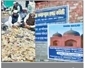
बाबर कटटर, अत्याचारी शासक था, उसने तलवार के जरिए हिन्दुओं का धर्म परिवर्तन कराया ऐसे में उसे सम्मान देना गंभीर मुद्दा है।