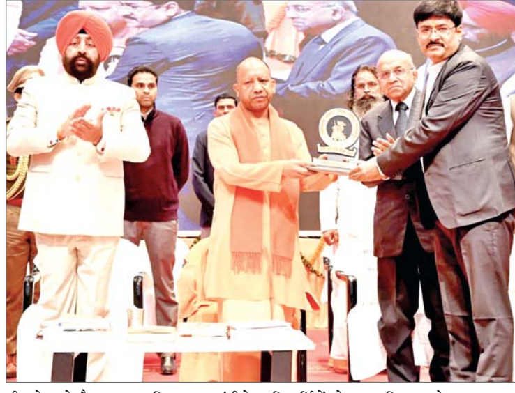
चौफ गेस्ट के तौर पर स्वागत किया। मुख्यमंत्री ने विद्यार्थियों को आगाह किया... शेष पृष्ठ 14 पर

गोरखपुर। मुख्यमंत्री योगी आदित्यनाथ ने नशाखोरी और स्मार्टफोन की लत को आज के युवाओं के लिये सबसे बड़ा खतरा करार देते हुए बुधवार को कहा कि युवाओं से अपने और देश के भविष्य को सुरक्षित रखने के लिए इन दोनों बौमारियों से दूर रहने की जरूरत है।