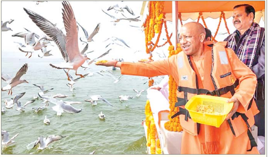
की बड़ी संख्या रहेगी। लगभग 20 से 25 लाख कल्पवासी एक माह तक मेले में प्रवास कर मां गंगा की साधना व तपस्या करते हैं। इनके साथ ही मुख्य स्नान पर्वों पर भी बड़ी संख्या में श्रद्धालु स्नान करने आते ...शेष पृष्ठ 14 पर

जिला संवाददाता प्रयागराज। मुख्यमंत्री योगी आदित्यनाथ ने शनिवार को माघ मेले की तैयारियों को लेकर समीक्षा बैठक की, फिर पत्रकारों को इसकी जानकारी दी। सीएम ने कहा कि मेले की प्रगति युद्ध स्तर पर है। कल्पवासियों व श्रद्धालुओं के साथ पूरे आयोजन को भव्यता-दिव्यता के साथ संपन्न करेंगे। उन्होंने बताया कि माघ मेले की तिथि 15 दिन पहले आ रही है। तीन जनवरी को पौष पूर्णिमा, 15 जनवरी को मकर संक्रांति, 18 जनवरी को मौनी अमावस्या, 23 जनवरी को बसंत पंचमी, पहली फरवरी को माघ पूर्णिमा व 15 फरवरी को महाशिवरात्रि (छह प्रमुख स्नान) होंगे। तीन जनवरी से 1 फरवरी तक यहाँ कल्पवासियों