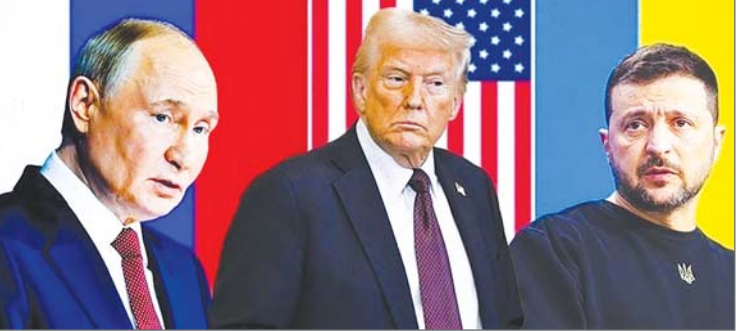
(जेलेन्स्की को) इसे मंजूर करना होगा। यूक्रेन की जेलेन्स्की सरकार पर भ्रष्टाचार के साथ-साथ युद्ध के मैदान से मिल रही चुनौतियों का सामना करना पड़ रहा है रूस लगातार उसके ऊर्जा अवसंरचना पर बमबारी कर रहा है जिससे एक बार फिर यूक्रेनवासियों के लिए सर्दी का मौसम कठिनाई भरा होने की आशंका है। जेलेन्स्की का भी मानना है कि यूक्रेन अब शायद अपने इतिहास के सबसे कठिन दौर का सामना कर रहा है। ट्रंप द्वारा योजना के सार्वजनिक किये जाने के बाद से जेलेन्स्की ने उनसे बात नहीं की है। हालांकि, यूक्रेन के राष्ट्रपति ने कहा है कि आने वाले दिनों में उनकी अमेरिकी राष्ट्रपति से बातचीत होने की उम्मीद है। ट्रंप ने नयी योजना में यूक्रेन पर दबाव ...शेष पृष्ठ 14 पर

एजेंसी वाशिंगटन। अमेरिका के राष्ट्रपति डोनाल्ड ट्रंप ने यूक्रेन-रूस युद्ध को समाप्त करने के लिए 28 सूत्री नयी योजना पेश की और साथ ही साफ कर दिया है कि यूक्रेन के राष्ट्रपति वोलेदिमिर जेलेन्स्की को पास लड़ाई को लंबे समय तक जारी रखने का विकल्प नहीं है और उन्हें इस योजना को स्वीकार करना होगा जो रूस की ओर युकी प्रतीत होती है। ट्रंप पहले भी जेलेन्स्की की सहमति के बिना ही यूक्रेन-रूस युद्ध को समाप्त करने की अपनी योजना पर अग्र बंद चुके हैं। ट्रंप ने शुक्रवार को कहा कि उन्हें उम्मीद है कि यूक्रेन के राष्ट्रपति उनकी सरकार की युद्ध समाप्त करने की नई योजना पर अगले बुधवार तक प्रतिक्रिया देंगे। ट्रंप ने ओवल ऑफिस में संवाददाताओं से बातचीत में कहा, हम मानते हैं कि हमारे पास शांति स्थापित करने का एक तरीका है। उन्हें