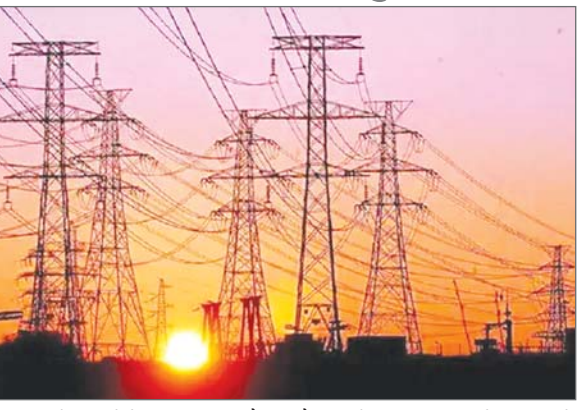
हजार करोड़ रुपये के पार जा चुकी है। बिजली दरों में इजाफे के पहले पावर कारपोरेशन को यह बकाया चुकता करना होगा। लिहाजा अब एक लंबे समय तक उत्तर प्रदेश में बिजली दरों में इजाफे के आसार न के बराबर रह गए हैं। उपभोक्ता परिषद पहले ही बकाये की वजह से उपभोक्ताओं को बिजली बिल में राहत की मांग कर रहा है। लगातार छठे साल दरों में इजाफा न करने वाला उत्तर प्रदेश देश का पहला राज्य बन ...शेष पृष्ठ 14 पर

वरिष्ठ संवाददाता लखनऊ। यूपी के बिजली उपभोक्ताओं के लिए राहत भरी खबर है। बिजली की नई दरें नहीं बढ़ाई जाएंगी। राज्य विद्युत नियामक आयोग ने शनिवार को बिजली की नई दरें जारी कर दी हैं। दिन रात के लिए टैरिफ श्रेणी पिछले साल जैसे ही रहेंगे। यानी, अभी इन्हें प्रभाव नहीं किया जाएगा। यह लगातार छह साल जब है जब प्रदेश में बिजली की दरों में कोई बढ़ोतरी नहीं की गई है। बिजली की नई दरों को बढ़ाने को लेकर पावर कारपोरेशन ने प्रस्ताव रखा था जिसे नियामक आयोग ने खारिज कर दिया है। बिजली कंपनियों पर उपभोक्ताओं का 18,592 करोड़ रुपये बकाया निकला है। अब कुल बकाया राशि 51