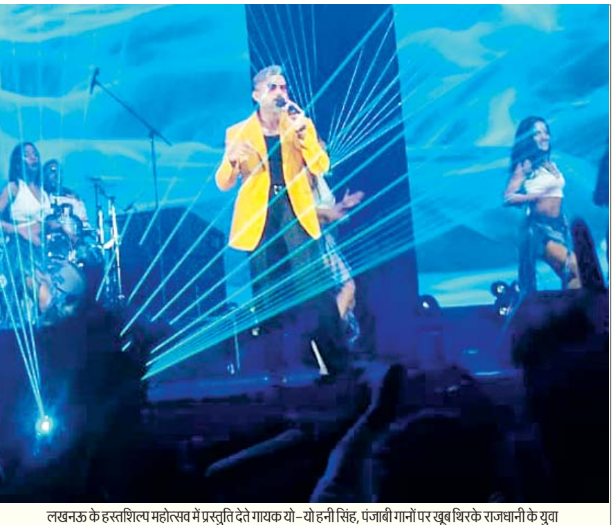
लखनऊ के हस्तशिल्प महोत्सव में प्रस्तुति देते गायक यो-यो हनी सिंह, पंजाबी गानों पर खूब थिरके राजधानी के युवा

राष्ट्रपति द्रौपदी मुर्मू ने कहा कि पूज्य आध्यात्मिक गुरु श्री सत्य साईं बाबा ने लाखों लोगों को सेवा के मार्ग पर चलने के लिए प्रेरित किया।