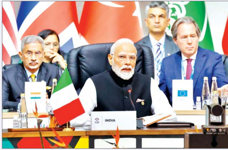
के उद्घाटन सत्र को संबोधित करते हुए कहा कि जी-20 ने लंबे समय से वैश्विक वित्त और विकास को आकार दिया है, लेकिन प्रचलित