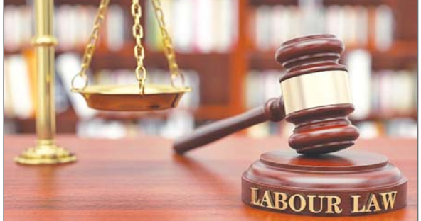
व्यावसायिक सुरक्षा, स्वास्थ्य एवं कार्य दशाएं संहिता, 2020 है। सुधारों में महिलाओं के लिए विस्तारित अधिकार और सुरक्षा शामिल हैं। इनमें रात की पाली में काम, 40 वर्ष से अधिक आयु के श्रमिकों के लिए मुफ्त वार्षिक स्वास्थ्य जांच, खतरनाक प्रक्रिया इकाइयों सहित पूरे भारत में

एजेंसी नयी दिल्ली। सरकार ने शुक्रवार को एक ऐतिहासिक फैसले में सभी चार श्रम संहिताओं को अधिसूचित कर दिया। इस प्रमुख सुधार को जरिये 29 मौजूदा श्रम कानूनों को तर्कसंगत बनाया गया है। इसमें गिग यानी अल्पकालिक अनुबंध पर काम करने वाले कर्मचारियों के लिए सार्वभौमिक सामाजिक सुरक्षा कवरेज, सभी कर्मचारियों के लिए अनिवार्य नियुक्ति पत्र और सभी क्षेत्रों में वैधानिक न्यूनतम मजदूरी तथा समय पर भुगतान जैसे प्रावधान शामिल हैं। ये चार श्रम संहिताएं-वेतन संहिता, 2019, औद्योगिक संबंध संहिता, 2020, सामाजिक सुरक्षा संहिता, 2020 तथा