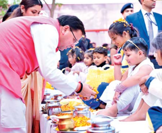
को मुक्त कराया गया है। मुख्यमंत्री पुष्कर सिंह धामी ने कहा कि विकल्प रहित संकल्प की भावना ही उत्तराखंड

प्रमुख संवाददाता हरिद्वार (उत्तराखंड)। रुड़की में जीवनदीप आश्रम के पांच दिवसीय महोत्सव को सम्बोधित करते हुए मुख्यमंत्री पुष्कर सिंह धामी ने कहा कि उत्तराखंड के विकास और सांस्कृतिक अस्मिता की सुरक्षा के लिए सरकार दृढ़ निश्चय के साथ काम कर रही है। राज्य आध्यात्मिक दृष्टि से विश्व का मार्गदर्शक बनने की दिशा में तेजी से आगे बढ़ रहा है। मुख्यमंत्री ने कहा कि राज्य सरकार ने धर्मांतरण विरोधी कानून एवं सख्त दंगरीधी कानून लागू किए गए हैं। लैंड जिहाद, लव जिहाद, थूक जिहाद जैसी जिहादी मानसिकताओं के विरुद्ध कड़ी कार्रवाई की गई है। लैंड जिहाद पर 9 हजार एकड़ से अधिक सरकारी भूमि