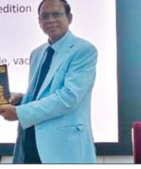
गुरु श्री गोरखनाथ इंस्टिट्यूट ऑफ मेडिकल साइंसेज के समुदाय चिकित्सा विभाग द्वारा प्रतिरक्षण के गूढ़ तत्वों पर आयोजित व्याख्यान को