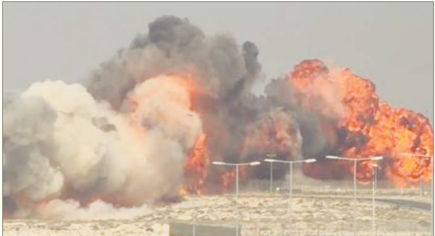
समय जैसलमेर में एक आवासीय कॉलोनी के पास दुर्घटनाग्रस्त हो गया था। यह ऐसी पहली दुर्घटना थी जो स्वदेश निर्मित एकल इंजन वाले विमान के 2001 में उड़ान भरना शुरू करने के बाद हुई थी। उस हादसे में पायलट विमान से सुरक्षित रूप से बाहर निकल गया था। शुक्रवार को स्थानीय समयानुसार दोपहर में, एयरशो में हवाई

एजेंसी नयी दिल्ली/दुबई। भारतीय वायुसेना (आईएफ) का लड़ाकू विमान तेजस शुक्रवार को दुबई एयरशो के दौरान दुर्घटनाग्रस्त हो गया और इस हादसे में पायलट की मौत हो गई। आईएफ ने यह जानकारी दी। विभिन्न टीवी चैनलों पर दिखाए गए दुर्घटना के दृश्यों में विमान को ऊंचाई से गिरते और फिर आग के गोले में तब्दील होते देखा जा सकता है। वायुसेना ने एक संक्षिप्त बयान में कहा कि दुर्घटना के कारणों का पता लगाने के लिए एक कोर्ट ऑफ इन्क्वायरी का गठन किया जा रहा है। मार्च 2024 में, वायुसेना का एक तेजस हल्का लड़ाकू विमान (एलसीए) पोखरण रेगिस्तान में सैन्य अभ्यास भारत शक्ति से लौटते समय जैसलमेर में एक आवासीय कॉलोनी के पास दुर्घटनाग्रस्त हो गया था। यह ऐसी पहली दुर्घटना थी जो स्वदेश निर्मित एकल इंजन वाले विमान के 2001 में उड़ान भरना शुरू करने के बाद हुई थी। उस हादसे में पायलट विमान से सुरक्षित रूप से बाहर निकल गया था। शुक्रवार को स्थानीय समयानुसार दोपहर में, एयरशो में हवाई प्रदर्शन के दौरान उड़ान भरते समय विमान दुर्घटनाग्रस्त हो गया। भारतीय वायुसेना ने एक्स पर एक बयान में कहा आईएफ को इस हादसे में हुए जानमाल के नुकसान पर बहुत दुःख है और वह दुःख की इस घड़ी में शोक संतप्त परिवार के साथ मजबूती से खड़ी है। दुर्घटना के कारणों का पता लगाने के लिए कोर्ट ऑफ इन्क्वायरी का गठन किया जा रहा है। हादसे में जान गंवाने वाले पायलट तथा कोर्ट ऑफ इन्क्वायरी के संबंध में और विवरण की प्रतीक्षा है। प्रमुख रक्षा अध्यक्ष (सीडीएस) जनरल अनिल चौहान ने कहा कि सशस्त्र बल इस दुःख की घड़ी में शोक संतप्त परिवार के साथ मजबूती से खड़े हैं। मुख्यालय एकीकृत रक्षा स्टाफ (एचक्यू आईडीएस) ने ...शेष पृष्ठ 14 पर