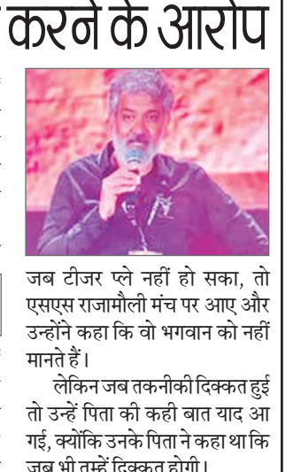
वाराणसी इवेंट में हुई तकनीकी दिक्कत, भावनाओं को आहत किया, भगवान को नहीं मानते

मुंबई। शनिवार को हैदराबाद में एसएस राजामौली की अपकमिंग फिल्म वाराणसी का टीजर लॉन्च इवेंट रखा गया था। इवेंट में तकनीकी दिक्कतों के चलते कई बार कोशिश करने पर भी टीजर प्ले नहीं हुआ, जिसके बाद डायरेक्टर एसएस राजामौली ने मंच पर आकर इवेंट में मौजूद लोगों से माफी मांगी। हालाँकि इस दौरान दिग्गज बयान के चलते उन पर धार्मिक भावनाएं आहत करने के आरोप लगे हैं। तकनीकी खराबी से