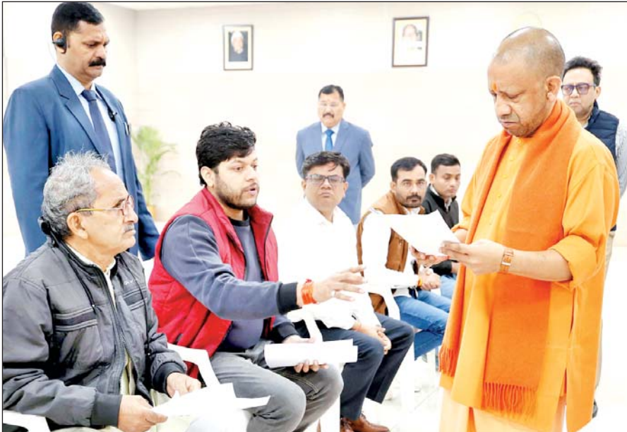
बच्चे का इलाज शुरू हो गया। वहीं हज्जनाता दर्शनरुहमें प्रदेश भर से 60 से अधिक फरियादी आए, मुख्यमंत्री ने

सहयोग का आग्रह किया। मुख्यमंत्री ने महिला की बात सुनी और तत्काल उन्हें एंबुलेंस से केजीएमयू भिजवाया। मुख्यमंत्री योगी आदित्यनाथ के निर्देश पर हृदय संबंधी बीमारी से जुड़ा रहे