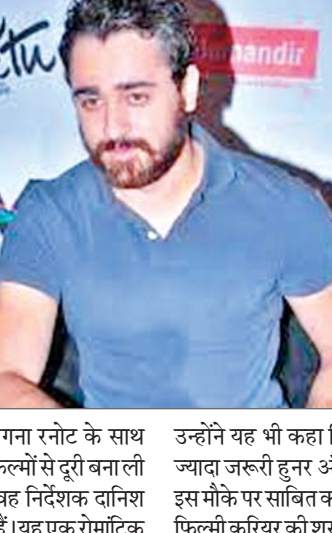
कॉमेडी होगी, जिसमें इमरान के साथ भूमि पेडनेकर की लीड भूमिका में होगी।

मुंबई। एक्टर इमरान खान लगभग 10 साल बाद बड़े पर्दे पर वापसी करने जा रहे हैं। इमरान खान ने पिछले कुछ सालों में फिल्मों से ब्रेक लिया था, लेकिन अब वे फिर से एक्टिंग की दुनिया में कदम रखने वाले हैं। हाल ही में एक इंटरव्यू के दौरान इमरान ने कहा कि फिल्मों में उनकी वापसी को वजह पैसा और स्टारडम नहीं है। इमरान खान की आखिरी फिल्म 2015 में रिलीज हुई हाकट्टी बट्टी थी, जिसमें उन्होंने कंगना रनोट के साथ काम किया था। इसके बाद इमरान ने फिल्मों से दूरी बना ली थी और अब लगभग 10 साल बाद वह निर्देशक दानिश असलम की नई फिल्म वापसी कर रहे हैं। यह एक रोमांटिक