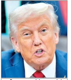
वीजा समाप्त होने पर अपने देश लौटने पर हंगे मजबूर लोग

एजेंसी न्यूयॉर्क/वाशिंगटन | अमेरिका की एक सांसद ऐसा विधेयक पेश करने जा रही हैं जिसका उद्देश्य एच-1बी वीजा कार्यक्रम को पूरी तरह समाप्त करना और इससे मिलने वाली नागरिकता खत्म करना है, जिससे वीजा समाप्त होने पर लोगों को वापस घर लौटने के लिए मजबूर होना पड़ेगा। जॉर्जिया से कांग्रेस सदस्य मार्जरी टेलर ग्रीन ने बृहस्पतिवार को एक्स पर पोस्ट किया है, जिसमें वीजा समाप्त होने पर लोगों को वापस घर लौटने के लिए मजबूर होना पड़ेगा। ग्रीन ने कहा कि इस 10,000 वीजा की सीमा होगी। ग्रीन ने यह भी कहा कि इस 10,000 की सीमा को भी अगले 10 वर्षों में धीरे-धीरे समाप्त कर दिया जाएगा। अमेरिकी सांसद ने कहा कि उनका विधेयक नागरिकता का रस्ता भी बंद कर देगा, जिससे वीजा धारकों को इसकी अवधि समाप्त होने पर स्वदेश लौटना होगा। उन्होंने कहा ये वीजा किसी विशेष समय पर विशेषज्ञता की आवश्यकता को पूरा करने के लिए शुरू किए गए थे। लोगों को यहां आकर हमेशा के लिए रहने की अनुमति नहीं होनी चाहिए। हम उनकी विशेषज्ञता के लिए उन्हें धन्यवाद देते हैं लेकिन साथ ही हम चाहते हैं कि वे अपने देश लौट जाएं। राष्ट्रपति डोनाल्ड ट्रंप के प्रशासन ने एच-1बी वीजा के दुरुपयोग को रोकने के लिए, खासकर प्रौद्योगिकी कंपनियों द्वारा इसके इस्तेमाल को लेकर कड़ा अभियान शुरू किया है। भारतीय पेशेवर खासतौर से प्रौद्योगिकी कर्मचारी और चिकित्सक एच-1बी वीजा धारकों का सबसे बड़ा समूह हैं।