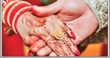
सामयिक • अपराजिता

भारत में अब बड़े पैमाने पर शादियां सदी के मौसम में होती हैं। सदियों के मौसम में होने वाली ये शादियां महज पारिवारिक उत्सवपर नहीं हैं बल्कि देश की अर्थव्यवस्था का मजबूत आर्थिक इंजन भी हैं। इन शादियों से हर साल लाखों लोगों को रोजगार मिलता है, करोड़ों-अरबों का कारोबार होता है। इसलिए अगर कहा जाए कि सदियों का मौसम अब भारत में परंपराओं और अर्थशास्त्र का चमकदार संगम बन चुका है, तो अतिशयोक्ति नहीं होगी। शावद इंसोलिए माना जाता है कि अब सदियों का मौसम हिंदुस्तान में केवल ठंडक नहीं लाता बल्कि शादियों की रौनक और रिशतों की गर्माहट लेकर भी आता है। नवंबर से फरवरी तक देश के अधिकांश हिस्से में आसमान साफ रहता है और हवा में अच्छी लगने वाली हल्की ठंडक घुली होती है। ऐसे सुन्दर मौसम में देश का बड़ा हिस्सा शादी के रंग में रंग जाता है। यह वह समय होता है जब भारत की वेडिंग इंडस्ट्री अरबों रुपये का कारोबार करती है और लाखों लोगों की रोजी रोटी का जरिया बनती है।