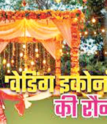
वेडिंग इकोनॉमी की रौनक

यूं तो पूरे देश में ही शादियों में बहुत पैसे खर्च होते हैं, लेकिन आमतौर पर अगर देश के किसी एक हिस्से में सदियों के समय शादियां में होने वाले सबसे ज्यादा खर्च की बात कही जाए, तो वह राजधानी दिल्ली और राष्ट्रीय राजधानी परिषद यानी एनसीआर है। साल 2024 की सदियों में यहाँ करीब 1.3 से लेकर 1.5 लाख करोड़ रुपये के शादियों का कारोबार सिर्फ सदियों में हुआ था। इसलिए अगर देश