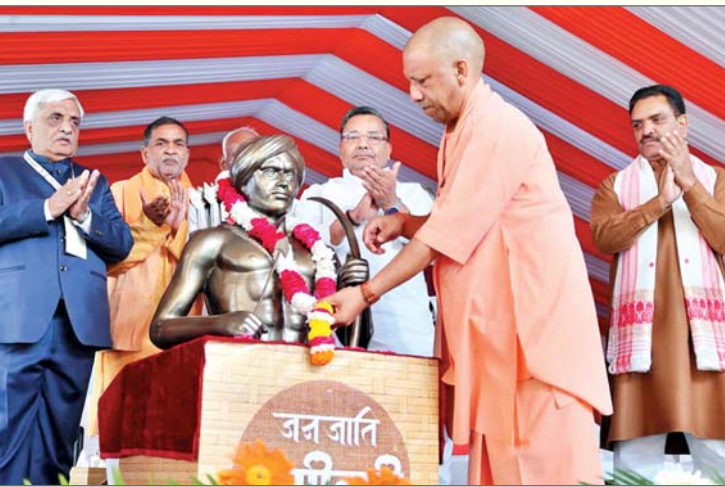
और संस्कृति में जनजातीय समुदाय के अतुलनीय योगदान को समर्पित जनजाति भागीदारी उत्सव (13 से 18 नवम्बर) का शुभारम्भ करने के बाद विचार व्यक्त कर रहे थे। इस अवसर पर उन्होंने भगवान बिरसा मुण्डा की प्रतिमा पर माल्यार्पण कर उन्हें भावभीनी श्रद्धांजलि दी। इसके पूर्व,

विशेष संवाददाता लखनऊ। मुख्यमंत्री योगी आदित्यनाथ ने कहा कि भगवान बिरसा मुण्डा की विरासत राष्ट्रीय एकता तथा सामाजिक सौहार्द को बनाये रखने की प्रेरणा प्रदान करती है। भगवान बिरसा मुण्डा धरती माता को गुलामी की बेड़ियों से आजाद करने के लिए किये जाने वाले संघर्ष के प्रतीक हैं। जनजातीय समुदाय के लोगों ने सदैव समाज के अग्रिम पंक्ति में खड़े होकर भारत की विरासत व धरोहर को संरक्षित करने का कार्य किया है। डबल इंजन सरकार जनजातीय गौरव की पुनर्स्थापना करते हुए जनजातीय समाज के कल्याण के लिए संवेदनशीलता के साथ कार्य कर रही है। जनजातीय समाज व उनकी विरासत के संरक्षण के लिए उन्हें हर प्रकार का सहयोग व समर्थन दे रही है। मुख्यमंत्री गुरुवार को लोकनायक धरती आबा भगवान बिरसा मुण्डा की 150वीं जयंती के उपलक्ष्य में भारतीय सभ्यता