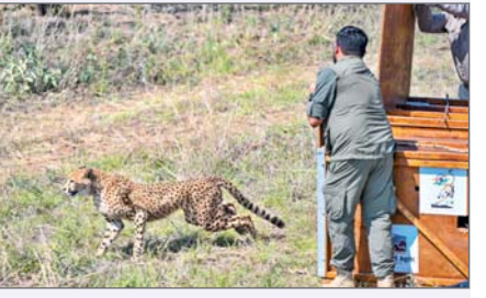
कालाहारी रेगिस्तान में इस अफ्रीकी देश का 70 प्रतिशत भूभाग आता है। मोकोलोडी ...शेष पृष्ठ 14 पर

एजेंसी गबोरोन (बोत्सवाना)। राष्ट्रपति द्रौपदी मुर्मू को बृहस्पतिवार को उनकी राजकीय यात्रा के अंतिम दिन यहां पास में स्थित एक प्राकृतिक अभयारण्य में बोत्सवाना के राष्ट्रपति ड्यूमा गिदोन बोको ने प्रतीकात्मक रूप से आठ चीते सौंपे। दोनों राष्ट्राध्यक्ष सुबह के समय राजधानी गबोरोन से लगभग 10 किलोमीटर दक्षिण में स्थित मोकोलोडी नेचर रिजर्व पहुंचे और दो चीतों को एक पृथकवास बाड़े में छोड़े जाने की घटना को देखने के लिए सफारी वाहन में सवार हुए। भारत और बोत्सवाना के वन्यजीव अधिकारियों ने मुर्मू