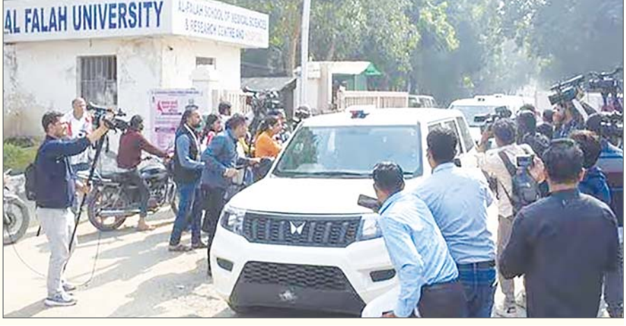
उच्च तीव्रता के धमाके में कम से कम 13 लोगों की मौत हो गई थी। वहीं इससे पूर्व दिल्ली में लाल किले के पास सोमवार शाम को हुए विस्फोट का एक नया सीसीटीवी फुटेज सामने आया है, जिसमें उस दिन मुख्य

एजेंसी नयी दिल्ली। भारतीय विश्वविद्यालय संघ (एआईयू) ने बृहस्पतिवार को घोषणा की कि राष्ट्रीय राजधानी में लाल किले के नजदीक हुए कार धमाके के बाद जांच के घेरे में आए अल फलाह विश्वविद्यालय की सदस्यता निलंबित कर दी गई है। एआईयू सोसाइटी पंजीकरण अधिनियम, 1860 के अंतर्गत पंजीकृत एक सोसाइटी है और इसके सदस्य भारतीय विश्वविद्यालय हैं। यह सदस्य विश्वविद्यालयों के प्रशासकों और शिक्षाविदों ...शेष पृष्ठ 14 पर