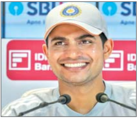
भूमिका को नजरअंदाज नहीं करेगा।

कोलकाता। भारतीय कप्तान शुभमन गिल ने स्वीकार किया कि स्पिनर और अतिरिक्त तेज गेंदबाज के बीच चयन टकराव से कम नहीं है लेकिन भारत जब दक्षिण अफ्रीका के खिलाफ शुकवार से यहां शुरू होने वाले पहले टेस्ट क्रिकेट मैच के लिए अंतिम एकादश का चयन करेगा तो घरेलू धरती पर स्पिनरों की महत्वपूर्ण