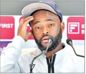
दौरों में लगातार सात टेस्ट गंवाए हैं और

कोलकाता। मौजूदा विश्व टेस्ट चैंपियन दक्षिण अफ्रीका के कप्तान तेम्बा बावुमा के लिए भारत को उसकी सरजमीं पर हराने की संभावना विशेष महत्व रखती है और उनका कहना है कि दो टेस्ट मैच की श्रृंखला जीतना लगभग इस साल के शुरू में मिली विश्व टेस्ट चैंपियनशिप जीत के बराबर ही होगा। दक्षिण अफ्रीका ने भारत के तीन