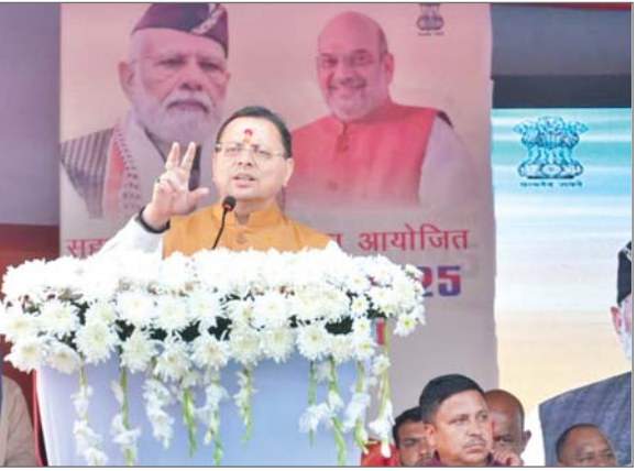
अधिक सशक्त होगा। उन्होंने सहकारिता मेले को ग्रामीण विकास, महिला सशक्तीकरण और सामाजिक सहभागिता को मजबूत करने की दिशा में एक ऐतिहासिक पहल बताया। मुख्यमंत्री पुष्कर सिंह धामी टनकपुर स्थित गांधी मैदान में आयोजित अंतरराष्ट्रीय सहकारिता वर्ष-2025 पर आयोजित सहकारिता

एजेंसी चंपावत (उत्तराखंड)। राज्य सरकार का लक्ष्य है कि सहकारिता आंदोलन को हर गांव, हर परिवार तक पहुंचाया जाए। किसान, महिला समूह और युवा जब सहयोग की भावना से जुड़ेंगे, तो आत्मनिर्भरता का मार्ग और