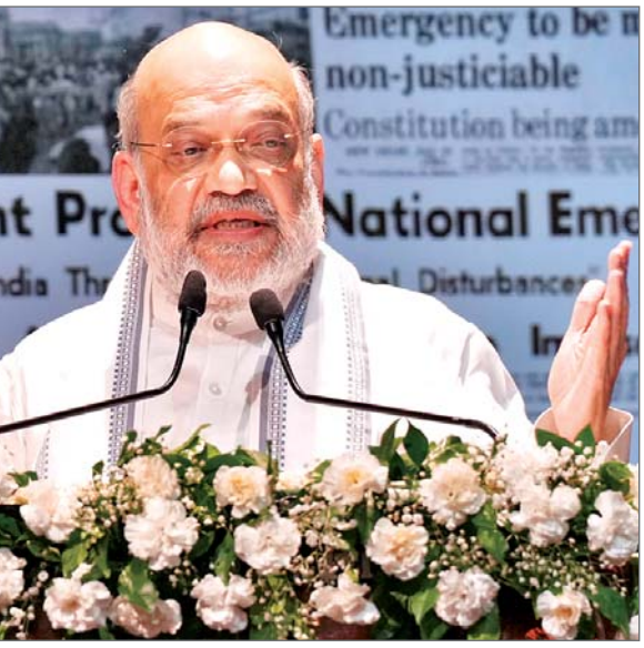
(पीआईबी) की विज्ञापित के अनुसार, शाह ने कहा, इस आतंकवादी कृत्य के लिए जिम्मेदार सभी लोगों को कड़ी सजा दिलाने का प्रधानमंत्री नरेंद्र मोदी का संकल्प निश्चित रूप से पूरा होगा। उन्होंने कहा दिल्ली आतंकवादी हमले के दोषियों को दी जाने वाली सजा से दुनिया को यह संदेश जाएगा कि हमारे देश में इस तरह के हमले के बारे में सोचने की भी किसी को हिम्मत नहीं करनी चाहिए। शाह ने कहा कि मोदी के नेतृत्व में पिछले 11 वर्षों में

एजेंसी अहमदाबाद। केंद्रीय गृह मंत्री अमित शाह ने बृहस्पतिवार को कहा कि दिल्ली में हुए विस्फोट के दोषियों को कड़ी से कड़ी सजा दी जाएगी जिससे दुनिया को यह संदेश जाएगा कि किसी को भी फिर कभी इस तरह के हमले के बारे में सोचने की हिम्मत नहीं करनी चाहिए। शाह गुजरात के मेहसाणा जिले के बोरियावा गांव में श्री मोतीभाई आर चोदरी सागर सैनिक स्कूल और सागर ऑर्गेनिक प्लॉट के उद्घाटन सत्र को वीडियो कॉन्फ्रेंस से संबोधित कर रहे थे। एक आधिकारिक विज्ञापित में उनके हवाले से कहा गया इस कार्यक्रम का कृत्य को अंजाम देने वाले और इसके पीछे जो लोग हैं, उन सभी को कानून के शिकंजे में लया जाएगा और उन्हें सख्त से सख्त सजा दी जाएगी। भारत सरकार और गृह मंत्रालय इसके लिए पूरी तरह प्रतिबद्ध हैं। उन्होंने विस्फोट के पीछे लोगों के प्रतिकारों के प्रति गहरी संवेदना भी व्यक्त की। पत्र सूचना ब्यूरो