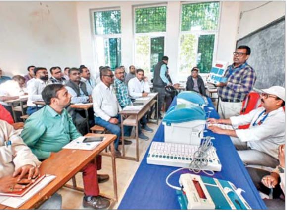
अनुसार, डाक मतपत्रों की गिनती सबसे पहले शुरू होगी। इसके बाद सुबह 8.30 बजे इलेक्ट्रॉनिक वोटिंग मशीन (ईवीएम) में दर्ज मतों की गिनती शुरू होगी। चुनाव आयोग के एक हालिया निर्देश के अनुसार, डाक मतपत्रों की गिनती ईवीएम मतगणना के अंतिम दौर से पहले पूरी की जानी है। डाक मतपत्रों की गणना उम्मीदवारों या उनके मतगणना एजेंटों की उपस्थिति में निर्वाचन अधिकारी या सहायक निर्वाचन अधिकारी द्वारा की जाती है। ईवीएम मतगणना के दौरान, केंद्रीय यूनिट को ...शेष पृष्ठ 14 पर

एजेंसी नयी दिल्ली। निर्वाचन आयोग ने बृहस्पतिवार को कहा कि 14 नवंबर को होने वाली मतगणना के लिए बिहार के सभी 243 विधानसभा क्षेत्रों में व्यापक इंतजाम किए गए हैं। प्रदेश में 243 मतगणना पर्यवेक्षकों और उम्मीदवारों या उनके एजेंटों की उपस्थिति में 243 निर्वाचन अधिकारियों द्वारा मतगणना की जाएगी। आयोग ने कहा कि प्रत्येक टेबल पर एक मतगणना पर्यवेक्षक, मतगणना सहायक और माइक्रो-ऑब्जर्वर के साथ 4,372 मतगणना टेबल स्थापित की गई हैं। उम्मीदवारों द्वारा नियुक्त 18,000 से अधिक मतगणना एजेंट भी मतगणना प्रक्रिया की निगरानी करेंगे। मतगणना सुबह 8 बजे शुरू होगी और निर्वाचन आयोग के निर्देशों के