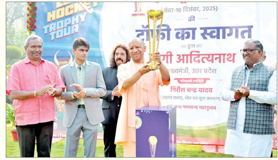
में इस ट्रॉफी का आना राज्य के स्वर्णिम इतिहास का स्मरण कराने वाला क्षण है। हॉकी में उत्तर प्रदेश का योगदान अविस्मरणीय है। उन्होंने ने हॉकी के जादूगर के रूप में विख्यात मेजर ध्यानचंद को याद करते हुए कहा कि

लखनऊ। तमिलनाडु में होने वाले एफआईएच हॉकी पुरुष जूनियर विश्व कप 2025 की ट्रॉफी भारत भ्रमण के अपने एक पड़ाव में बुधवार को यहां पहुंची जिसका राज्य के मुख्यमंत्री योगी आदित्यनाथ ने स्वागत किया। योगी आदित्यनाथ ने इस अवसर पर कहा लखनऊ में एफआईएच हॉकी पुरुष जूनियर विश्व कप 2025 की प्रतिष्ठित ट्रॉफी का स्वागत करना मेरे और प्रदेशवासियों के लिए आह्लादित करने वाला क्षण है। जूनियर पुरुष हॉकी विश्व कप में भात, चीन, बेल्जियम जापान, स्पेन, न्यूजीलैंड चिली, कनाडा, ऑस्ट्रेलिया समेत 24 टीम हिस्सा लेंगी। एक बयान के मुताबिक योगी आदित्यनाथ ने कहा, उत्तर प्रदेश