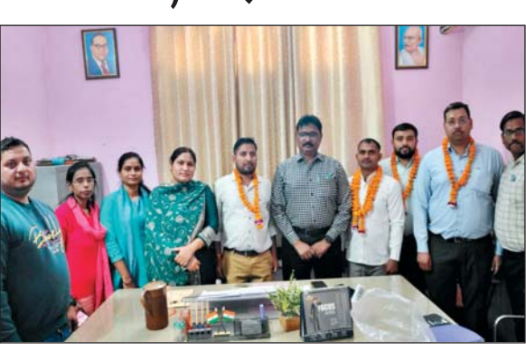
सफीपुर, उन्नाव (वीओएल) । समाज कल्याण विकास संघ की कार्यकारिणी का गठन किया गया। बैठक में सर्व सम्मति से अध्यक्ष, उपाध्यक्ष एवं महामंत्री का चयन किया

गया। समस्त नव नियुक्त पदाधिकारियों को टीम में शुभकामनाएं प्रेषित की। जनपद के समस्त समाज कल्याण विभाग के सहायक विकास अधिकारियों की उपस्थिति में बैठक