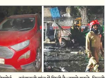
खंदावली गांव में मिली है। इससे पहले, दिल्ली पुलिस ने लाल फोर्ड इकोस्पॉर्ट कार का पता लगाने के लिए राष्ट्रीय ...शेष पृष्ठ 14 पर

चंडीगढ़। दिल्ली के लाल किला विस्फोट मामले से जुड़ी एक संदिग्ध लाल फोर्ड इकोस्पॉर्ट कार का पता लगा लिया गया है और इसे फरीदाबाद जिले के खंदावली में जब्त कर लिया गया है। यह जानकारी पुलिस ने दी। फरीदाबाद पुलिस के एक प्रवक्ता से जब पूछा गया कि क्या इकोस्पॉर्ट कार का पता लगा लिया गया है, तो उन्होंने फोन पर इसकी पुष्टि करते हुए कहा, हां, यह (कार)