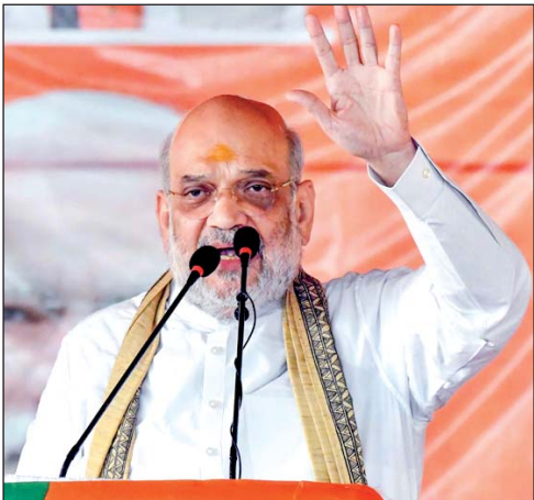
मनमोहन सिंह, सोनिया गांधी और लखनऊ यादव की सरकार थी, तब आतंकवादी देश के अंदर खुलकर हमले करते थे और अब हम आतंकवादियों को उनके घरों में घुसकर मार रहे हैं। शाह ने कहा, भविष्य में अगर पाकिस्तान से कोई आतंकवादी हमला करने की हिम्मत करता है, तो उनके बमों का जवाब मोर्चा से दिया जाएगा

यह यात्रा बिहार के गरीबों, दलितों और अति पिछड़ों के जीवन में सुधार लाने के लिए नहीं थी, बल्कि यह घुसपैठियों की रक्षा के लिए थी। भारतीय जनता पार्टी (भाजपा) के पूर्व राष्ट्रीय अध्यक्ष ने आरोप लगाया कि विपक्ष की वोट बैंक की राजनीति ने उन्हें घुसपैठिया कॉरिडोर बनाने की कोशिश करने पर मजबूर किया है, जबकि प्रधानमंत्री मोदी राज्य में औद्योगिक कॉरिडोर स्थापित कर रहे हैं। रहलू गांधी के इतने आरोप पर कि देश में वोट चोरी हो रही है, शाह ने कहा, अगर उन्हें सच में ऐसा लगता है, तो वे निर्वाचन आयोग में औपचारिक शिकायत क्यों नहीं करते? उन्होंने कहा, जब केंद्र में