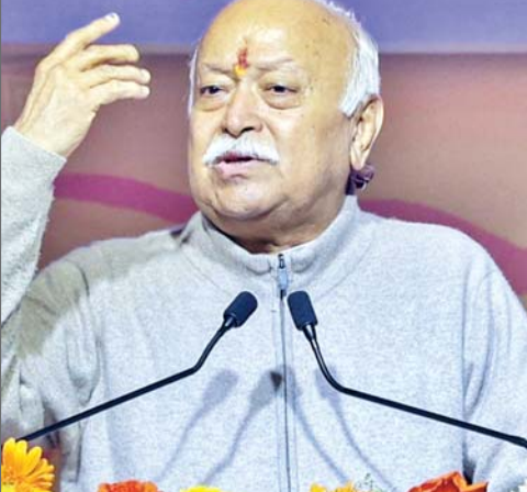
भागवत ने कहा कि कई चीजें पंजीकृत नहीं हैं। उन्होंने कहा, यहां तक कि हिंदू धर्म भी पंजीकृत नहीं है। आरएसएस के केवल भगवा ध्वज का सम्मान करने और तिरंगे को मान्यता नहीं देने के मुद्दे पर

एजेंसी बेंगलूरु। राष्ट्रीय स्वयंसेवक संघ (आरएसएस) प्रमुख मोहन भागवत ने संगठन पर बिना पंजीकरण के काम करने का आरोप लगाने वाले कांग्रेस नेताओं पर परोक्ष रूप से निशाना साधते हुए रविवार को कहा कि उनके संगठन को व्यक्तियों के निकाय के रूप में मान्यता प्राप्त है। भागवत ने आरएसएस की ओर से आयोजित एक आंतरिक प्रश्नोत्तर सत्र के दौरान एक सवाल के जवाब में कहा, आरएसएस की स्थापना 1925 में हुई थी, तो क्या आप उम्मीद करते हैं कि हम ब्रिटिश सरकार के पास पंजीकरण कराते ? उन्होंने कहा कि आजादी के बाद भारत सरकार ने पंजीकरण अनिवार्य नहीं बनाया। भागवत ने स्पष्ट किया, हमें व्यक्तियों के निकाय के रूप में वर्गीकृत किया गया है और हम मान्यता प्राप्त संगठन हैं। उन्होंने कहा कि आयकर विभाग और अदालतों ने आरएसएस को व्यक्तियों का एक निकाय माना है और संगठन को आयकर से छूट दी गई है। आरएसएस प्रमुख ने कहा, हम पर तीन बार प्रतिबंध लगाया गया। ऐसे में सरकार ने हमें मान्यता दी है। अगर हमारा अस्तित्व नहीं था, तो उन्होंने किस पर प्रतिबंध लगाया ?