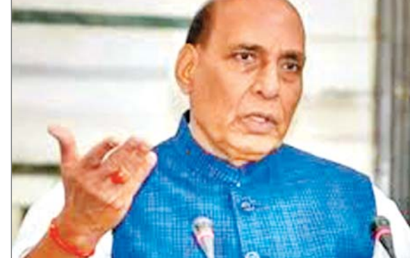
आपने सुना है कि तेलंगाना के मुख्यमंत्री ने क्या कहा? उन्होंने कहा, कांग्रेस मतलब मुसलमान और मुसलमान मतलब कांग्रेस। इस बयान का क्या अर्थ है? यह देश को बांटने का प्रयास है। क्या यही कांग्रेस की राजनीति है? यही उसकी संस्कृति है। सिंह ने आरोप लगाया कि कांग्रेस और राष्ट्रीय जनता दल (राजद) अपनी तुष्टीकरण की राजनीति के लिए राजग को बदनाम करने की कोशिश कर रहे हैं। उन्होंने कहा, कांग्रेस और राजद के विशेष सुरक्षा बल मुख्यालय के

एजेंसी औरंगाबाद/सासाराम (बिहार)। रक्षा मंत्री राजनाथ सिंह ने रविवार को तेलंगाना के मुख्यमंत्री रेंवत रेड्डी के कांग्रेस मतलब मुसलमान संबंधी बयान पर तंज कसते हुए आरोप लगाया कि कांग्रेस पार्टी देश को धर्म के आधार पर बांटने की कोशिश कर रही है। बिहार विधानसभा चुनाव के दूसरे और अंतिम चरण के प्रचार के आखिरी दिन औरंगाबाद और सासाराम में चुनावी रैलियों को संबोधित करते हुए सिंह ने कहा कि भारतीय जनता पार्टी (भाजपा) के नेतृत्व वाला राष्ट्रीय जनतांत्रिक गठबंधन (राजग) धर्म, जाति या संप्रदाय के आधार पर लोगों को नहीं बांटता, बल्कि मानवता की राजनीति में विश्वास करता है। उन्होंने कहा, क्या आपने सुना है कि तेलंगाना के मुख्यमंत्री ने क्या कहा? उन्होंने कहा, कांग्रेस मतलब मुसलमान और मुसलमान मतलब कांग्रेस। इस बयान का क्या अर्थ है? यह देश को बांटने का प्रयास है। क्या यही कांग्रेस की राजनीति है? यही उसकी संस्कृति है। सिंह ने आरोप लगाया कि कांग्रेस और राष्ट्रीय जनता दल (राजद) अपनी तुष्टीकरण की राजनीति के लिए राजग को बदनाम करने की कोशिश कर रहे हैं। उन्होंने कहा, कांग्रेस और राजद के विशेष सुरक्षा बल मुख्यालय के