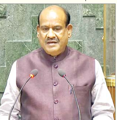
चाकियों को बढ़ाने एवं सांस्कृतिक आदान-प्रदान का आह्वान करना शामिल है। यह क्षेत्र संसदीय प्रक्रियाओं को बेहतर बनाने और प्रौद्योगिकियों के अधिक उपयोग के माध्यम से उन्हें अधिक सुलभ और समावेशी बनाने पर भी ध्यान केंद्रित करता है, जैसा कि राष्ट्रीय ई-विधान ऐप्लीकेशन (नेवा) के कार्यान्वयन, डिजिटलीकरण कार्यक्रम और सक्रिय सार्वजनिक भागीदारी में देखा गया है।

नयी दिल्ली। लोकसभा अध्यक्ष ओम बिरला सोमवार को कोहिमा में राष्ट्रमंडल संसदीय संघ भारत क्षेत्र जोन-तृतीय के 22वें वार्षिक सम्मेलन का उद्घाटन करेंगे। इस दो दिवसीय सम्मेलन में आठ पूर्वोत्तर राज्यों के पीठासीन अधिकारी और विधायक भाग लेंगे। इस सम्मेलन में नगालैंड के मुख्यमंत्री नेप्थू रियो, राज्यसभा के उपसभापति हरिवंश और नगालैंड विधानसभा के अध्यक्ष एवं सीपीए भारत क्षेत्र जोन-तृतीय के अध्यक्ष शारिगेन लोंगकुमेर शामिल होंगे। सम्मेलन का विषय नीति, प्रगति और जनता: परिवर्तन के उत्प्रेरक के रूप में विधानमंडल है और उप-विषय विकसित भारत के लक्ष्य को प्राप्त करने में विधानमंडलों की भूमिका और पूर्वोत्तर के कुछ हिस्सों में हाल में हुई बदल फटने और भूस्खलन की घटनाओं के आलोक में जलवायु परिवर्तन है। एक आधिकारिक बयान में कहा गया है कि सीपीए भारत क्षेत्र तृतीय ने क्षेत्रीय सहयोग को आगे बढ़ाने, संसदीय सर्वोत्तम चलन को बढ़ावा देने और पूर्वोत्तर के लिए एक्ट इस्ट नीति एवं बुनियादी ढांचे के विकास जैसे विशिष्ट क्षेत्रीय मुद्दों के समाधान में महत्वपूर्ण भूमिका निभाई है। इसकी प्रमुख उपलब्धियों में व्यापार और सहयोग के लिए भारत-आसियान वृष्टिकोण में पूर्वोत्तर क्षेत्र को शामिल करना और बुनियादी ढांचा परियोजनाओं में तेजी लाने, व्यापारिक