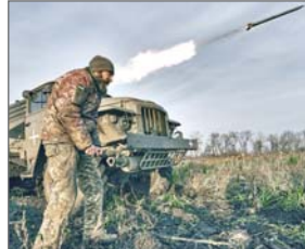
हिस्सों में अस्थायी रूप से बिजली बाधित हो गई और हीटिंग सिस्टम (सर्दियों में इमारतों या संयंत्रों को गर्म रखने की प्रणाली) ठप हो गई। उन्होंने कहा कि दस लाख से ज्यादा की आबादी वाले शहर के अगर रात में कई डोन की मार गिराया गया लेकिन उनके मल्ले से आग लगी जिसे तुरंत