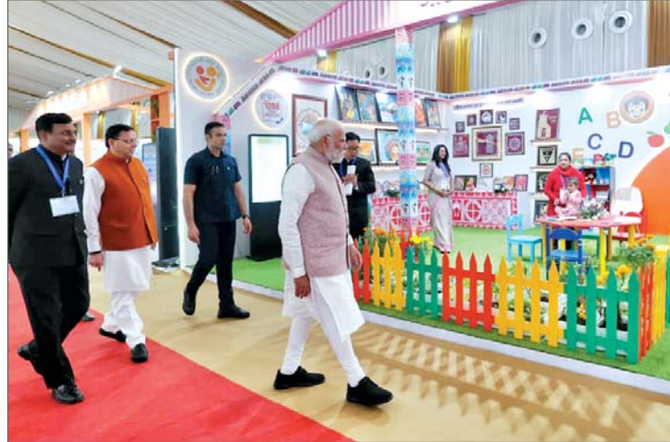
लोकार्पण व शिलान्यास किया। प्रधानमंत्री ने कहा कि जहां चाह, वहां राह के मूलमंत्र के साथ आगे बढ़ना होगा। उत्तराखंड के हर विधानसभा क्षेत्र में

प्रमुख संवाददाता देहरादून। हर विधानसभा क्षेत्र में योग केंद्रों की स्थापना, वाइब्रेंट विलेज को छोटे पर्यटन हब के रूप में विकसित करने और पहाड़ी व्यंजनों को होमस्टे संस्कृति से जोड़ने से जोड़कर राज्य को नई पहचान दी जा सकती है। हरेला, फूलदेई, भिंदोली जैसे त्योहार तथा नंदा देवी, जालजीवी, बागेश्वर उत्तराखण, देवीधुरा और श्रावणी जैसे पारंपरिक मेले राज्य को पहचान दिलाते हैं और इन्हें वन डिस्ट्रिक्ट वन फेस्टिवल के माध्यम से विश्व मंच पर लाया जा सकता है। देहरादून के एफआरआई के ऐतिहासिक परिसर में प्रधानमंत्री नरेन्द्र मोदी ने देवभूमिवासियों को सम्बोधित करते हुए उक्त उद्घाटन किया। प्रधानमंत्री ने गढ़वाली और कुमाऊं की प्रदेशवासियों को स्थापना दिवस की 25 वीं वर्षगांठ की शुभकामनाएं दीं। प्रधानमंत्री ने 8260 करोड़ रुपये की विकास परियोजनाओं का