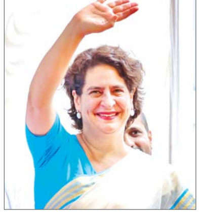
साल इस जहरीली हवा को झेलने पर मजबूर होते हैं और उनके पास कोई विकल्प नहीं होता। उन्होंने कहा, सांस

नयी दिल्ली। कांग्रेस नेता प्रियंका गांधी वादा ने दिल्ली में वायु प्रदूषण की समस्या को उठाते हुए प्रधानमंत्री नरेन्द्र मोदी, पर्यावरण मंत्री भूपेन्द्र यादव और दिल्ली की मुख्यमंत्री रेखा गुप्ता से हस्तक्षेप की रिविवार को अपील की। प्रियंका ने कहा कि केरल के वायनाड और फिर बिहार के बछवाड़ा से दिल्ली लौटकर सांस लेना वास्तव में चौंका देने वाला अनुभव है। प्रियंका गांधी ने एक्स पर लिखा, अब समय आ गया है कि हम सभी अपने राजनीतिक स्वार्थों से ऊपर उठकर एकजुट हों और इसके खिलाफ कुछ ठोस कदम उठाएं। केंद्र और राज्य सरकारों को तुरंत कार्रवाई करनी चाहिए। हम सब किसी भी ऐसे कदम का समर्थन और सहयोग करेंगे जो इस भयावह स्थिति से निपटने में मददगार साबित हो। प्रियंका गांधी ने कहा कि दिल्लीवासी हर