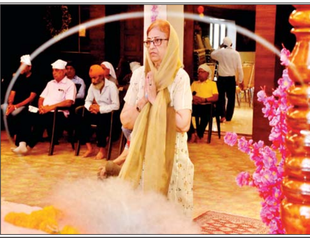
हरिओम मंदिर में प्रार्थना करती महिला