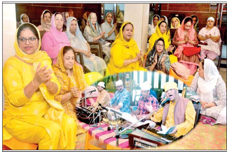
देवउठनी एकादशी पर भजन कीर्तन करती महिलाएं